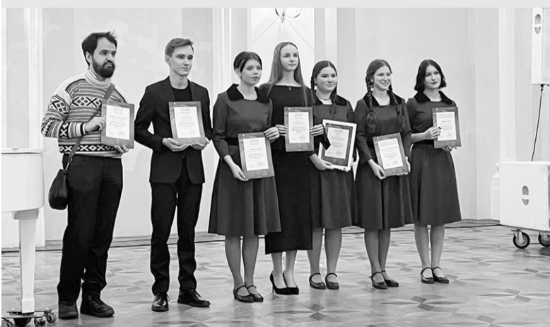
Ансамбль «ЗаБаВа» – в числе победителей и призеров конкурса