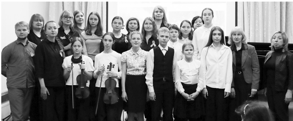
Участники памятного концерта в Кировской ДМШ

24 января в Кировской детской музыкальной школе состоялся тематический вечер, посвящённый освобождению Ленинграда от фашистской блокады и памяти героических защитников Невского пятачка.