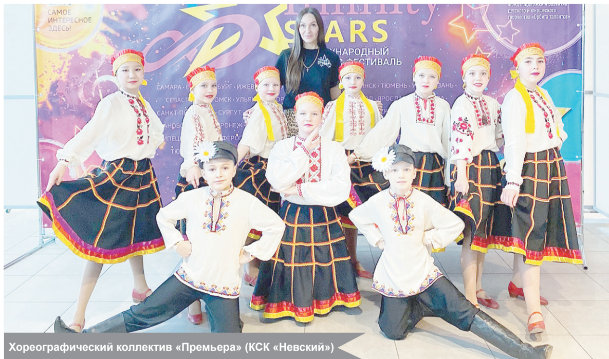
Хореографический коллектив «Премьера» (КСК «Невский»)