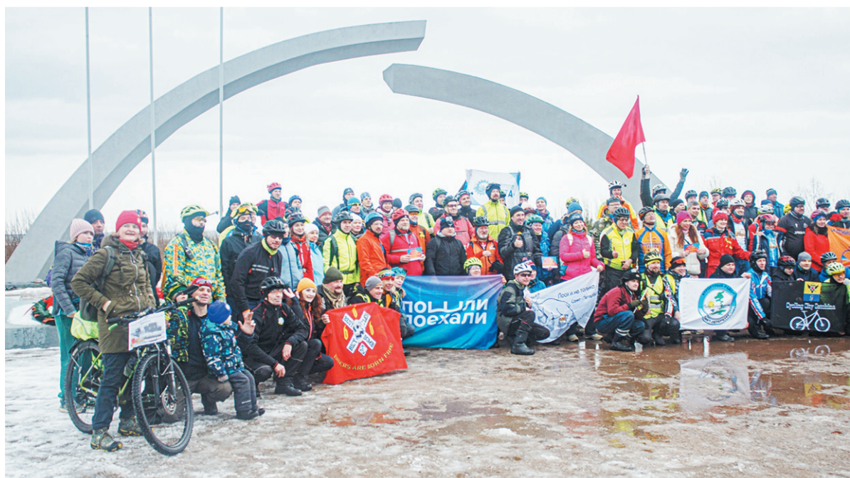
Участники пробега у мемориала «Разорванное кольцо»

25 января «Вело Кировск» по традиции принимал участие в областном велопробеге «Дорога жизни», чтобы отдать дань памяти и уважения родным и близким, пережившим блокаду и воевавшим на Ленинградском фронте.