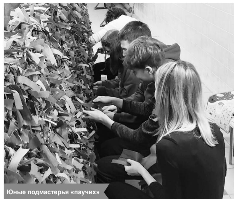
Юные подмастерья «паучих»

По материалам КСК «Невский» г. Шлиссельбурга