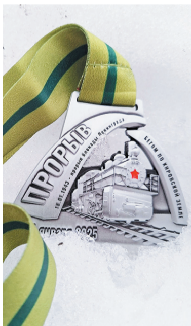
Медаль финишёра с изображением паровоза ЭМ 721-83

2 февраля на мемориале «Невский пяточок» состоялся III Зимний легкоатлетический пробег «Прорыв», посвящённый 81-й годовщине прорыва блокады Ленинграда.