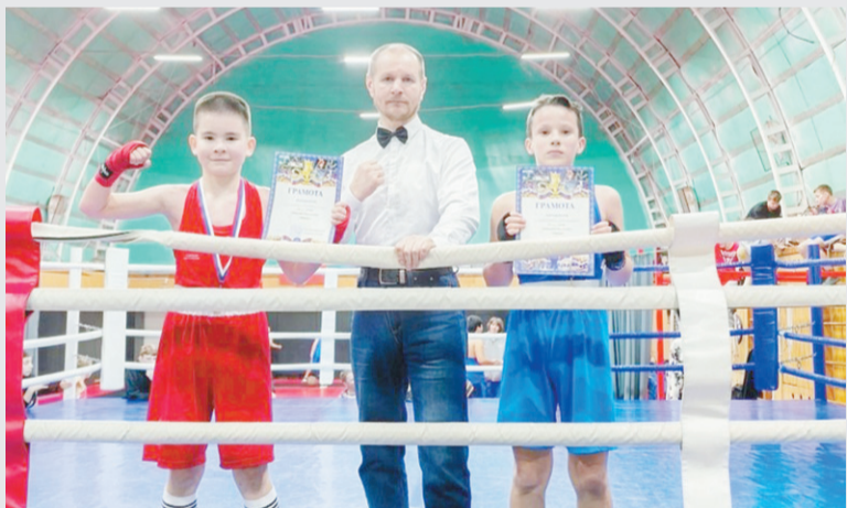
Гордимся нашими победителями и призёрами!

25 января в городе Отрадное состоялся Кубок Кировского района по боксу, собравший на ринге перспективных спортсменов из Отрадного, Шлиссельбурга и Кировска.