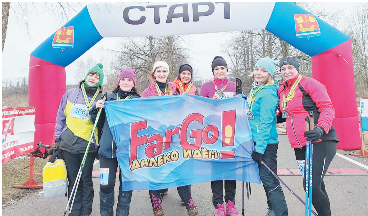
На старте – команда любителей скандинавской ходьбы