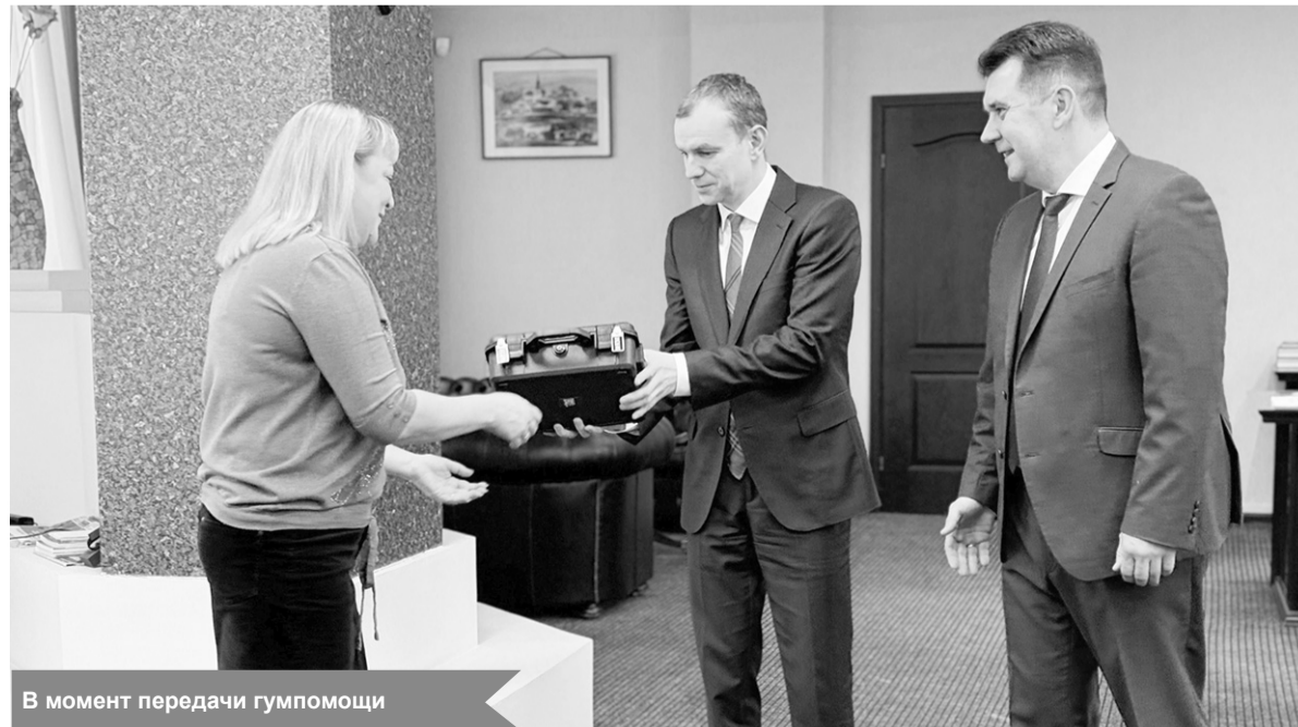
В момент передачи гумпомощи