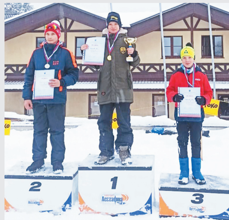
На пьедестале почёта – победители и призёры гонки