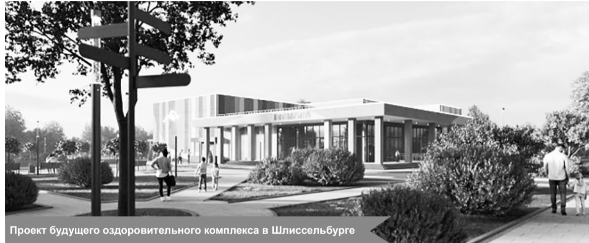
Проект будущего оздоровительного комплекса в Шлиссельбурге