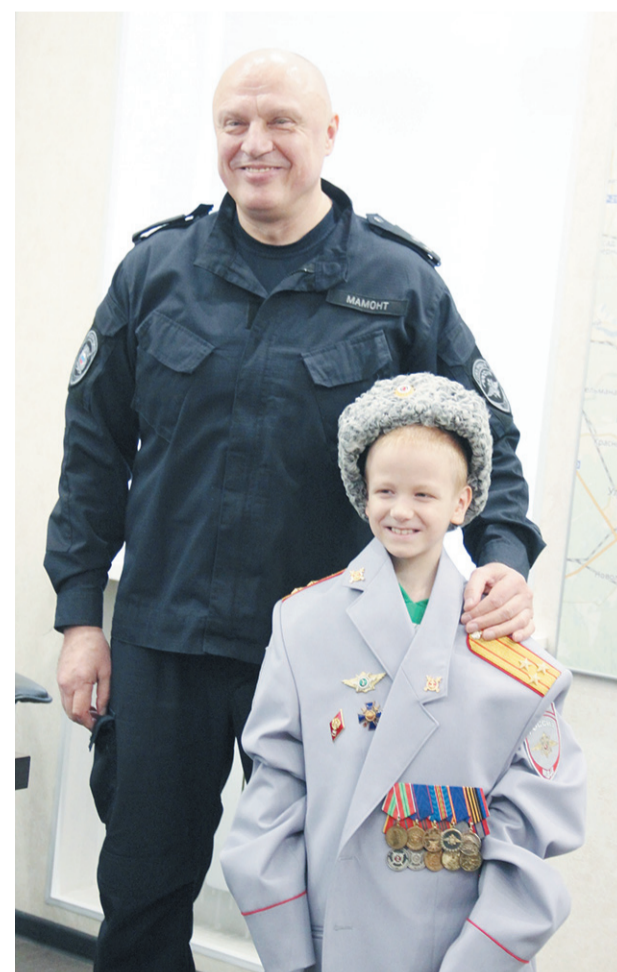
Отличная смена растёт!