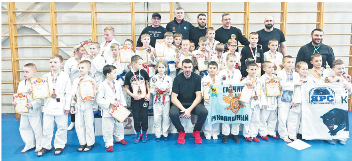
Победители и призёры областных соревнований в Отрадном