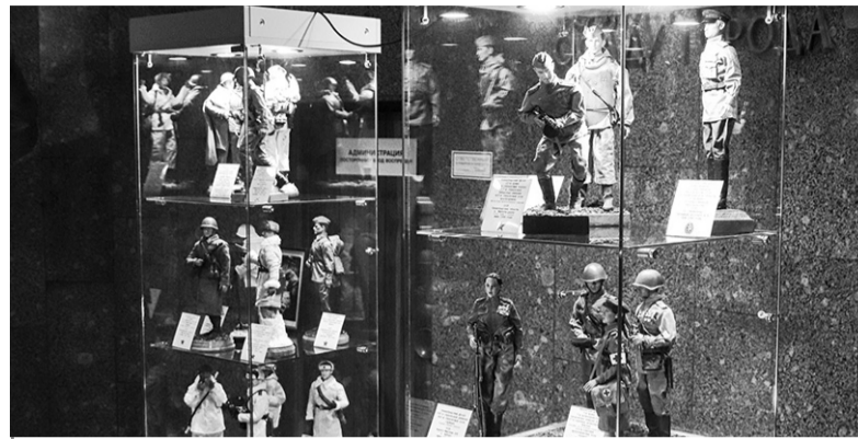
Часть экспозиции в зале диорамы

Конечно, фигурки делаются не с нуля. Телоид – шарнирная основа фигуры выполнена из особого пластика, которому можно придать нужную форму: согнуть ноги в коленях, чтобы герой шагнул, сжать пальцы на винтовке и т.д. Голова – отдельный элемент, над которым автор может работать самостоятельно