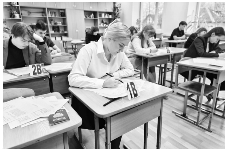
Во время пробного госэкзамена в Кировской школе № 1

Благодаря пробному мероприятию выпускники смогли погрузиться в атмосферу проведения настоящего экзамена со сдачей телефонов и личных вещей, проверкой документов, регистра-