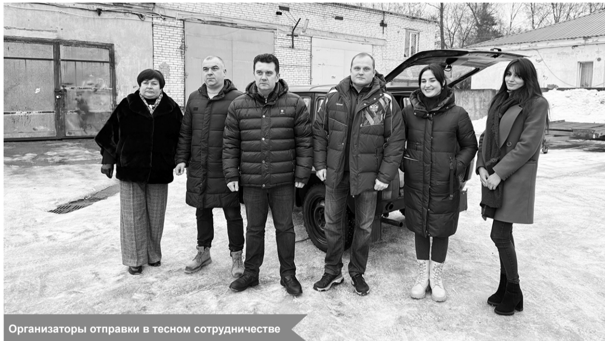
Организаторы отправки в тесном сотрудничестве