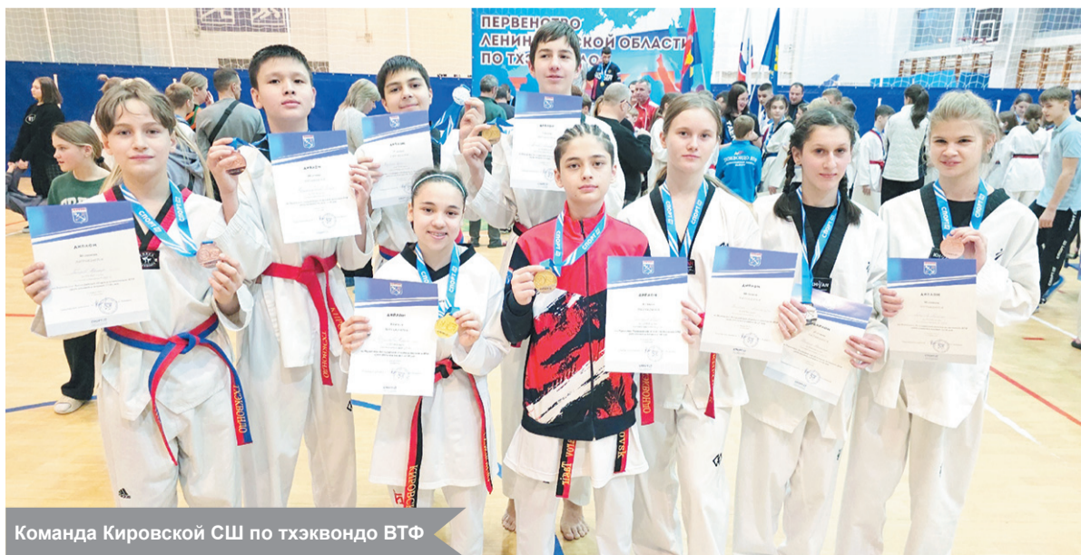
Команда Кировской СШ по тхэквондо ВТФ