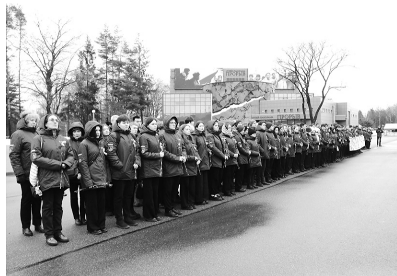
Гости из Санкт-Петербурга на преддиорамной площади

31 января в музейный комплекс «Прорыв блокады Ленинграда» по случаю 81-й годовщины полного освобождения Ленинграда от фашистской блокады приезжали студенты Санкт-Петербургского горного университета императрицы Екатерины II. На преддиорамной площади состоялся митинг с возложением цветов.