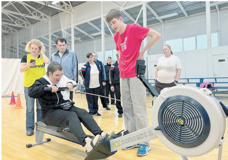
На празднике спорта в Кировске

Участие в этих мероприятиях не только способствовало популяризации норм ГТО, но и создало отличные условия для