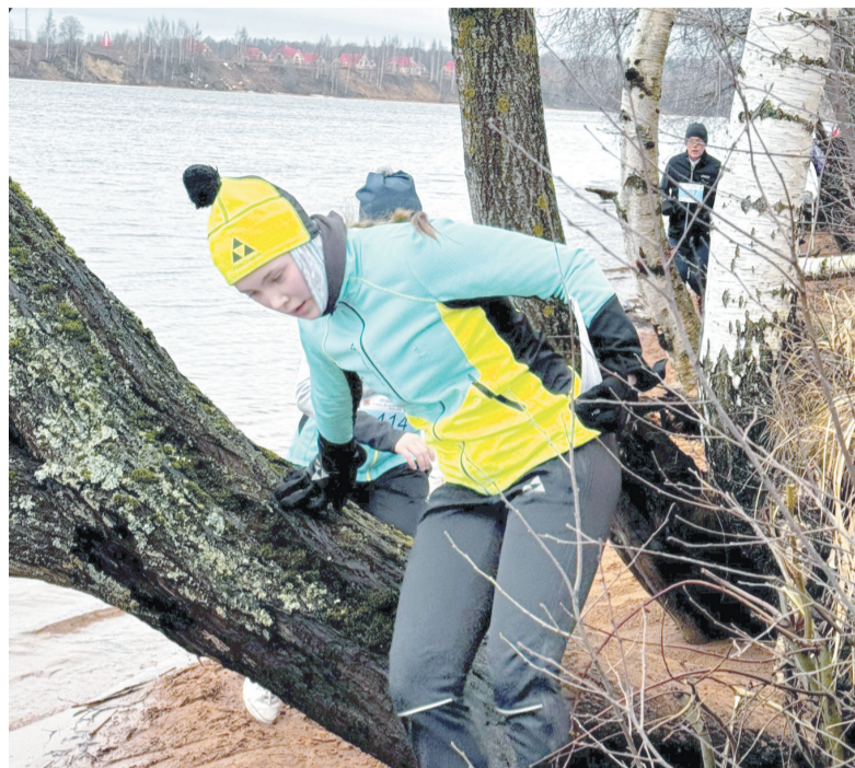
Часть дистанции проходила под крутым берегом Невы