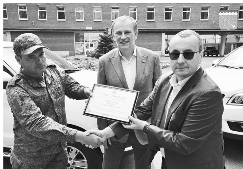
Передача сертификата военному округу 47 региона

Ленинградский военный округ получил от региона два пикапа Sollers ST6, оснащённых специальным оборудованием, для работы мобильных огневых групп. Закупку провели из средств областного бюджета.