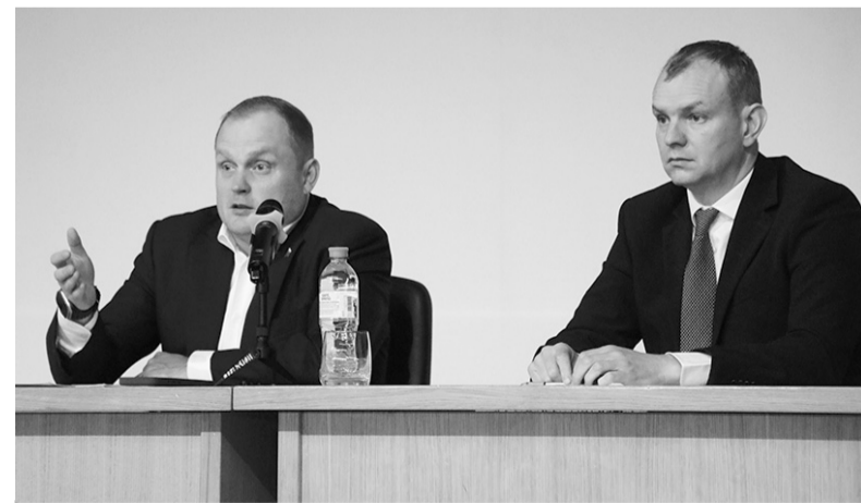
В формате диалога о важном

ваны для того, чтобы быстрее решать проблемы, слышать друг друга и вместе строить