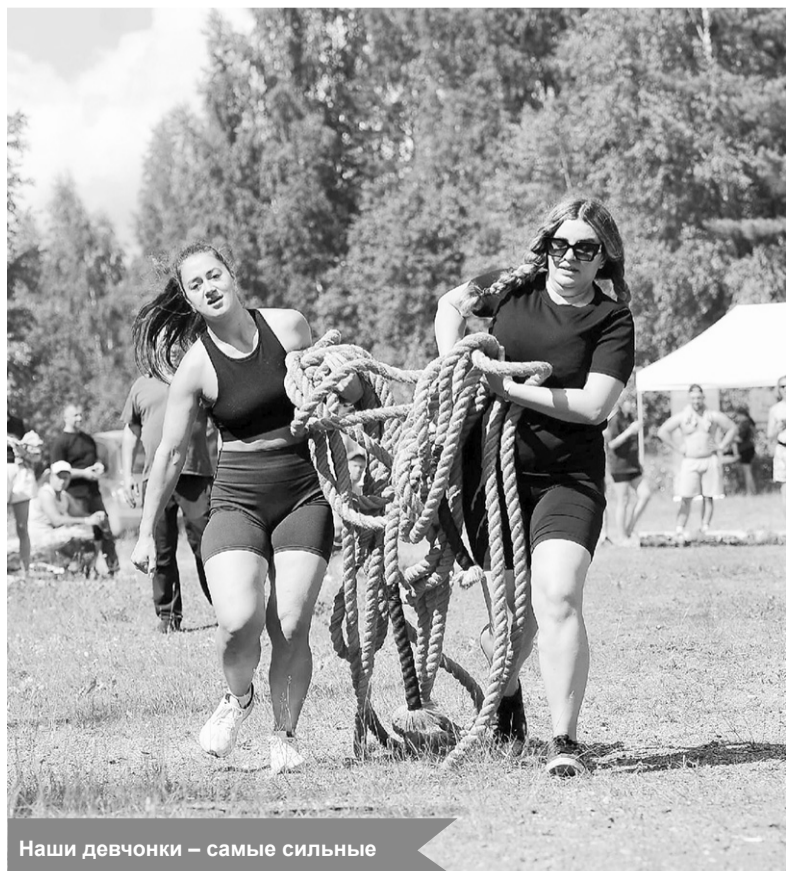
Наши девчонки – самые сильные

Яна НОСЕНКО, фото автора и Дениса ФАЙЗУЛИНА