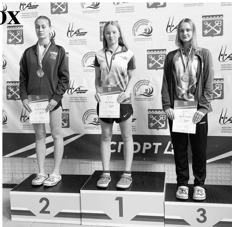
Награды – лучшим!