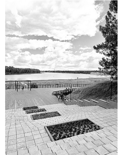
Благоустроенная набережная с видом на Свирь

текторов Б.В. Воронцова и К.Н. Калайды. Военные строители смогли удивительным образом соединить в архитектурном облике музея петровский корабль и колорит северной избы. В комплекс вошли парк (около 20 гектаров), павильоны для разных родов войск и музей в главном здании.