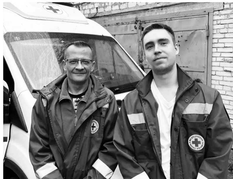
Первая бригада скорой помощи – настоящие герои!

История о том, как медики спасли жизнь маме главного редактора газеты «Ладога» (от первого лица).