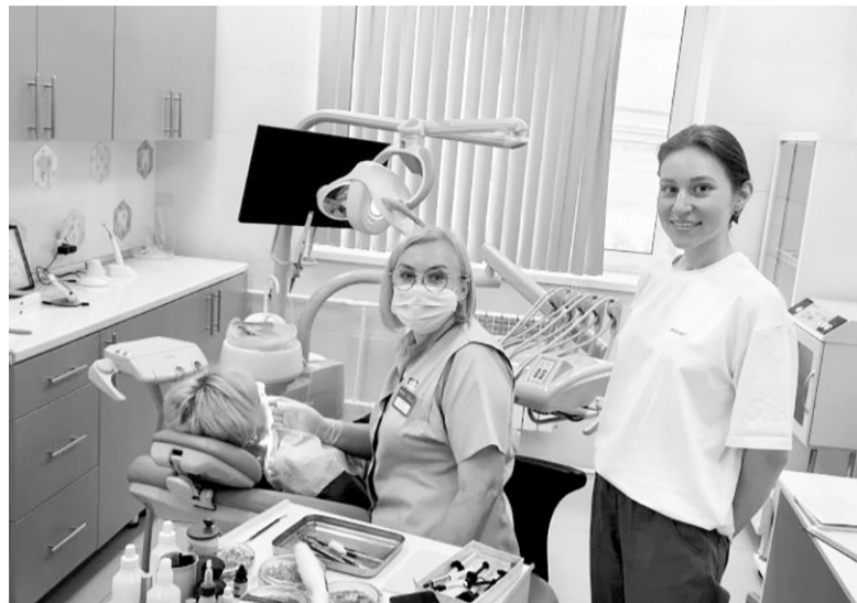
На приёме у стоматолога в Шлиссельбургской поликлинике