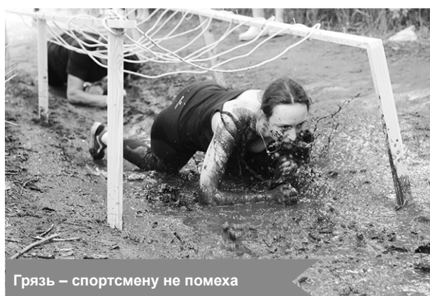
Грязь – спортсмену не помеха