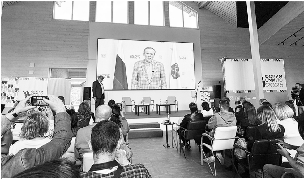
Обращение губернатора 47 региона к представителям СМИ