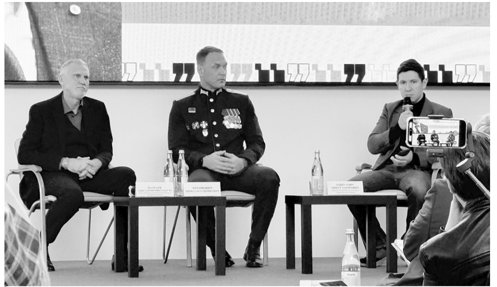
Почётные гости форума