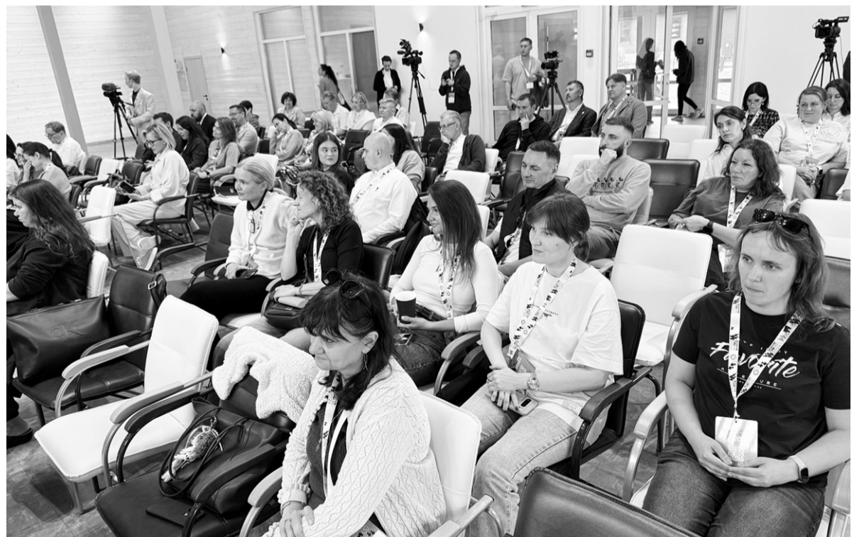
Учиться, учиться и ещё раз учиться!