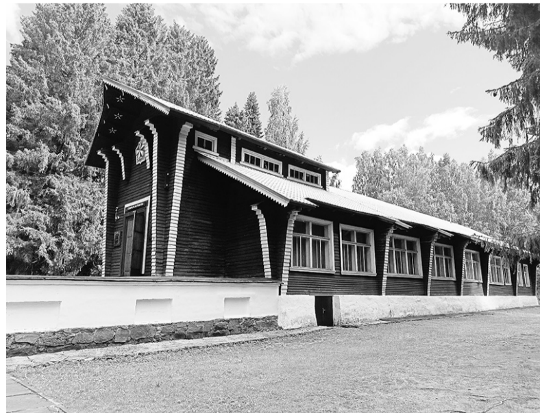
Лодейнопольский краеведческий музей в виде перевернутой ладьи