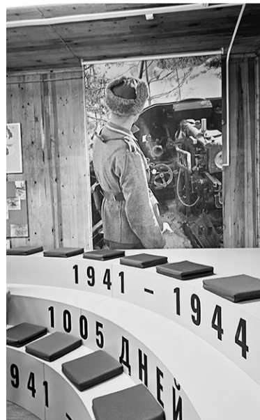
Экспозиция, посвящённая Великой Отечественной войне