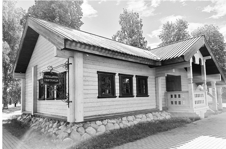
Выставочный центр «Домик Петра» в Лодейном Поле