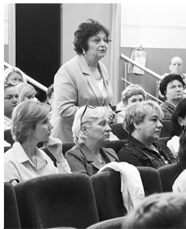
С насущными вопросами

В формате диалога депутаты подробно ответили на все волнующие коллектив вопросы и искренне поблагодарили собравшихся за их неравнодушие и активное участие в образовательной жизни Кировского района. Отдельные вопросы депутаты пообещали взять под лич-