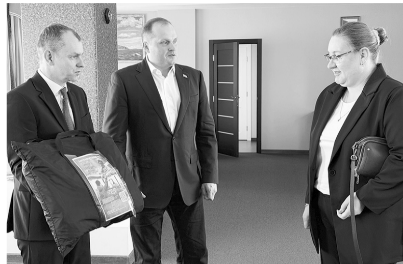
Кировский район: своих не бросаем!