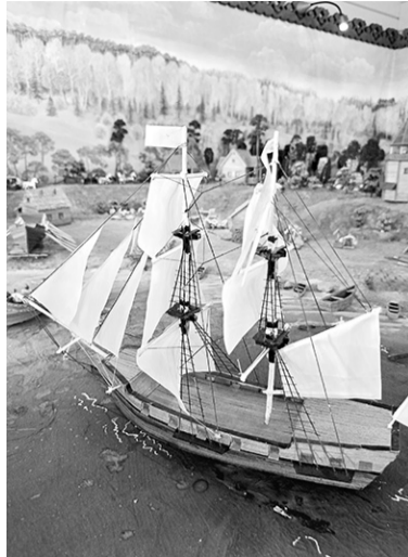
Фрагмент экспозиции в «Домике Петра»

Следующая остановка – Лодейнопольский историко-краеведческий музей «Свирская Победа». Он является филиалом Государственного бюджетного учреждения культуры Ленинградской области «Музейное агентство». Само здание музея, выполненное в форме корпуса корабля, построили в 1944 году по проекту архи-