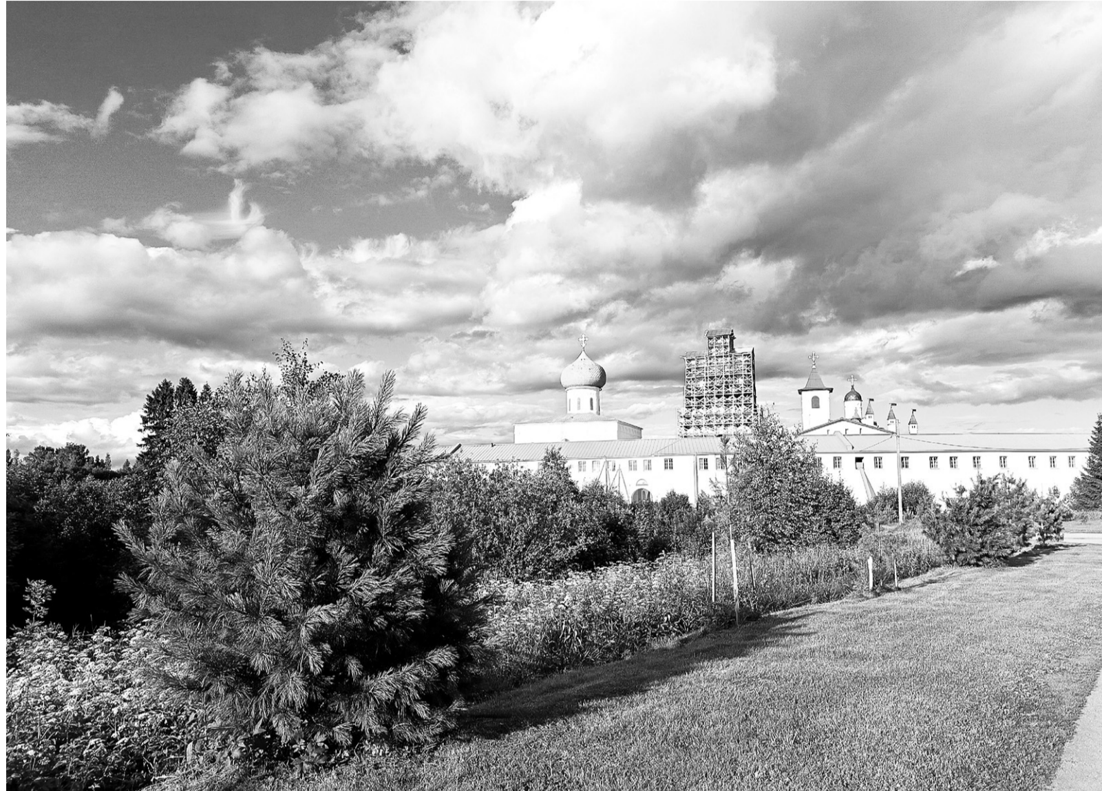
Территория Свято-Троицкого Александра Свирского монастыря утопает в зелени

Согласно официальным и историческим источникам, название города Лодейное Поле происходит от двух слов и напрямую связано с его историей: «Лодейное» – от слова «лодья» (старинное название речного или морского судна, корабля), «Поле» – в значении «открытое, безлесное пространство». Таким образом, Лодейное Поле буквально означает «место, где строят суда» (корабельная верфь). Название было закреплено официально, когда в 1785 году указом императрицы Екатерины II поселение при Олонецкой верфи получило статус города. Сама верфь была основана в 1702 году по указу Петра I, и местные жители называли слободу, стоящую на открытом месте, «Лодейным Полем».