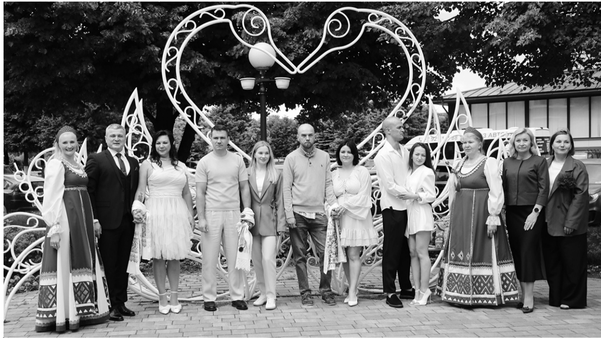
● Молодожёны Кировского района

Ещё одним важным символом Дня семьи, любви и верности является ромашка – она олицетворяет чистоту, верность и нежность. Каждой паре вручили букет ромашек и символические подарки от администрации Кировского района.