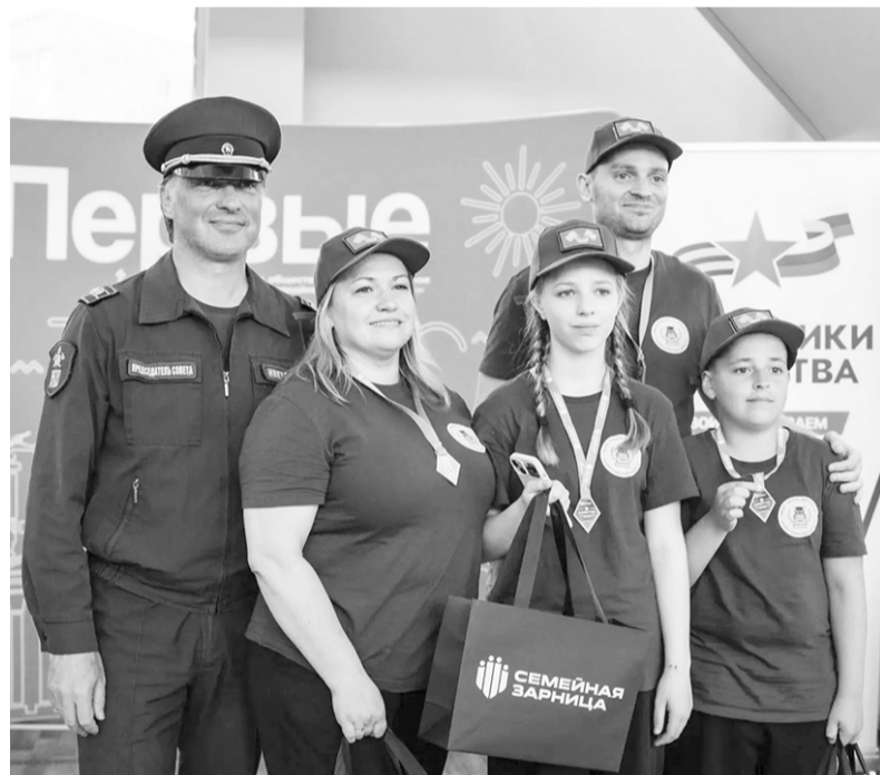
Равнение на лучших