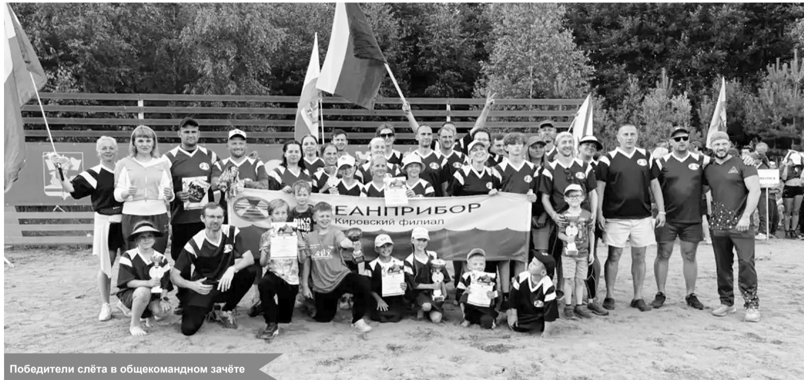
Победители слёта в общекомандном зачёте

Сразу после торжественного открытия мероприятия спорт-