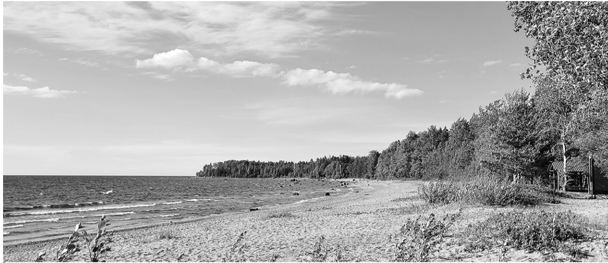
Побережье Финского залива