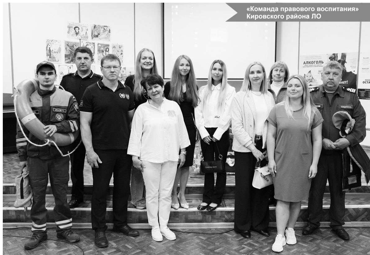
«Команда правового воспитания» Кировского района ЛО

По материалам администрации МО «Город Отрадное»