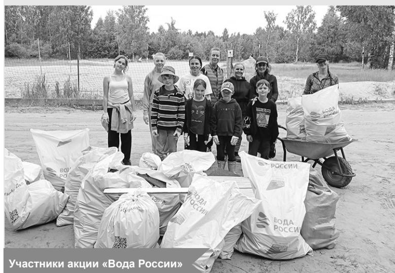
Участники акции «Вода России»