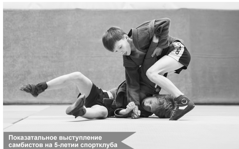
Показательное выступление самбистов на 5-летию спортклуба

тическое и физическое развитие подрастающего поколения.