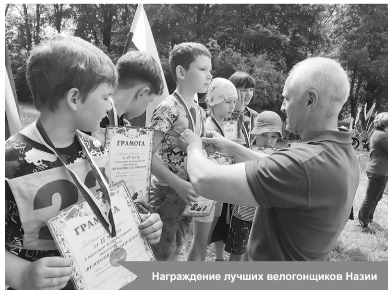
Награждение лучших велогонщиков Назии