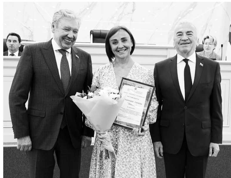
На церемонии награждения

• В интернете: первое место – «Онлайн47.ру», второе – «Сясь-ТВ», третье –