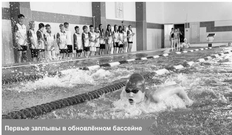
Первые заплывы в обновлённом бассейне

От момента начала работ в бассейне до оснащения современными