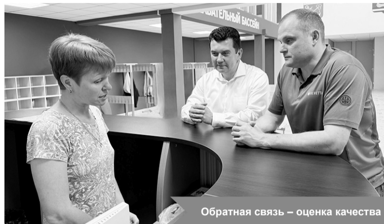
Обратная связь – оценка качества

– Отмечу, что особое внимание в обновленном бассейне уделено доступной среде и спортивной реабилитации. Для людей с ограниченными возможностями здоровья и участников