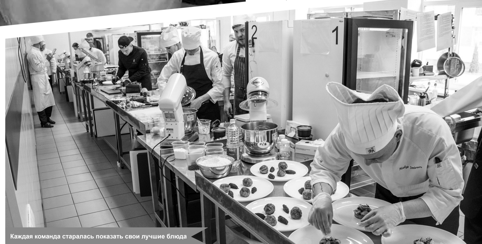
Каждая команда старалась показать свои лучшие блюда