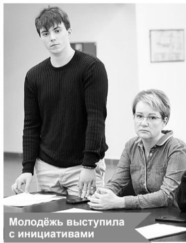
Молодёжь выступила с инициативами

Ребята рассмотрели вопросы организации районного фестиваля «Молодёжь и физкультура» и подготовки к празднованию Дня молодёжи, который пройдёт 27 июня в Шлиссельбурге.