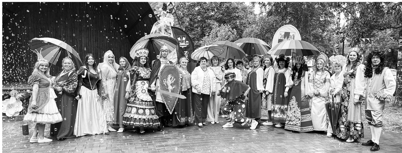
С хорошим настроением и заботой о детях