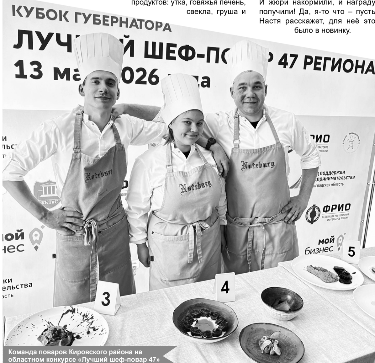
Команда повара Кировского района на областном конкурсе «Лучший шеф-повар 47»