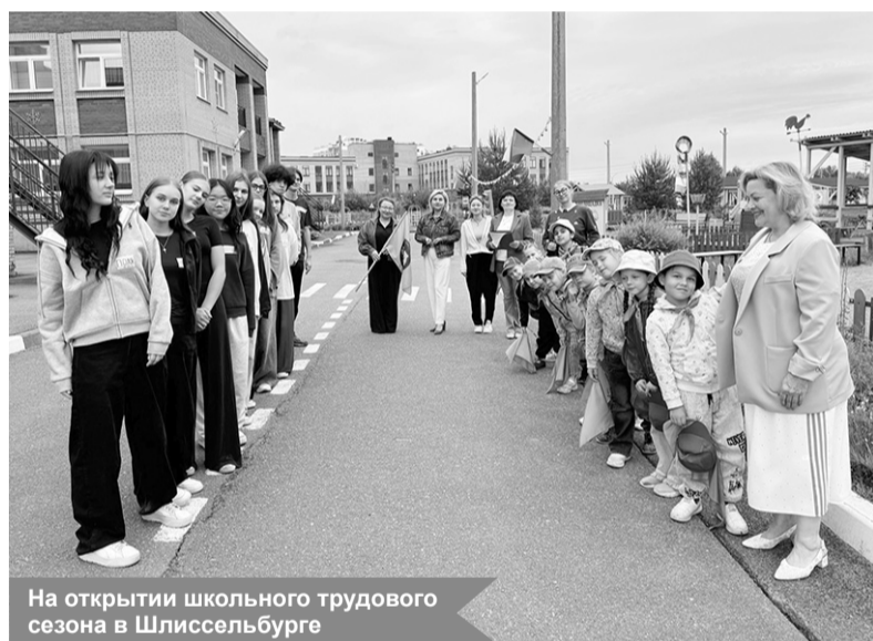
На открытии школьного трудового сезона в Шлиссельбурге