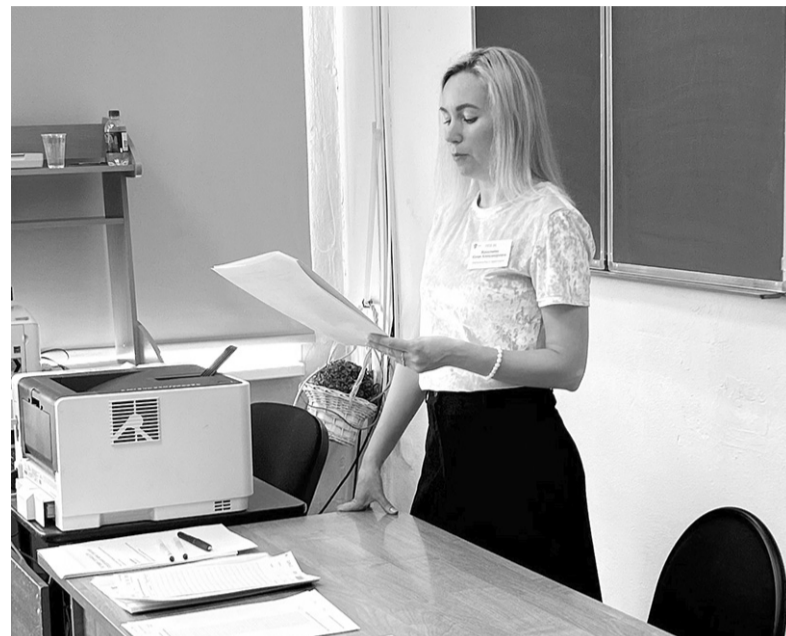
ЕГЭ по русскому языку в Кировской школе № 1

По материалам комитета образования администрации КМР ЛО