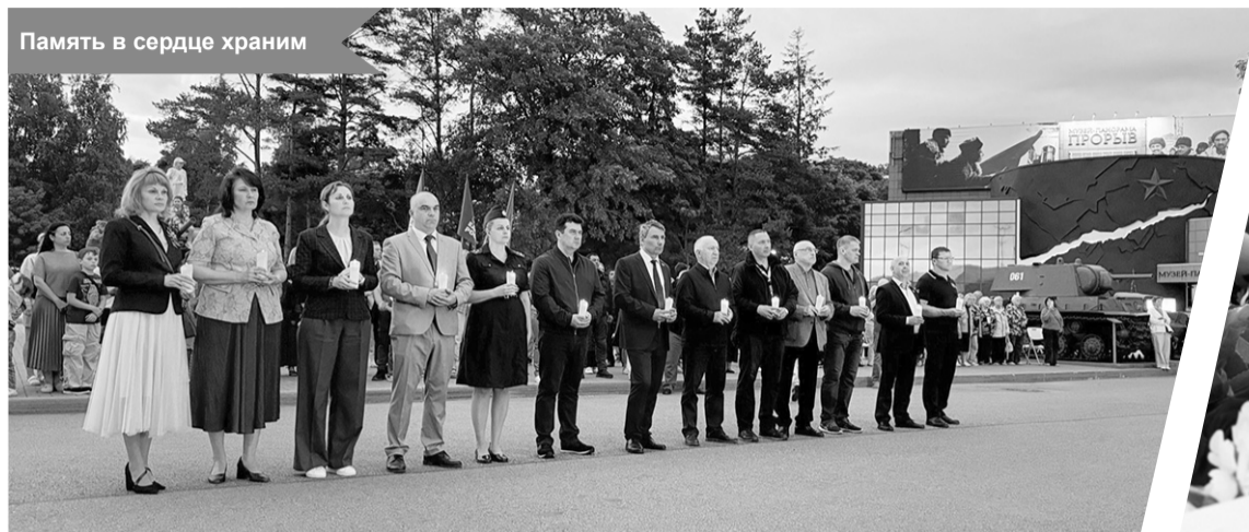
Память в сердце храним

20 июня на территории музея-заповедника «Прорыв блокады Ленинграда» состоялось памятное мероприятие «Неоконченный вальс сорок первого года», посвящённое Дню памяти и скорби.