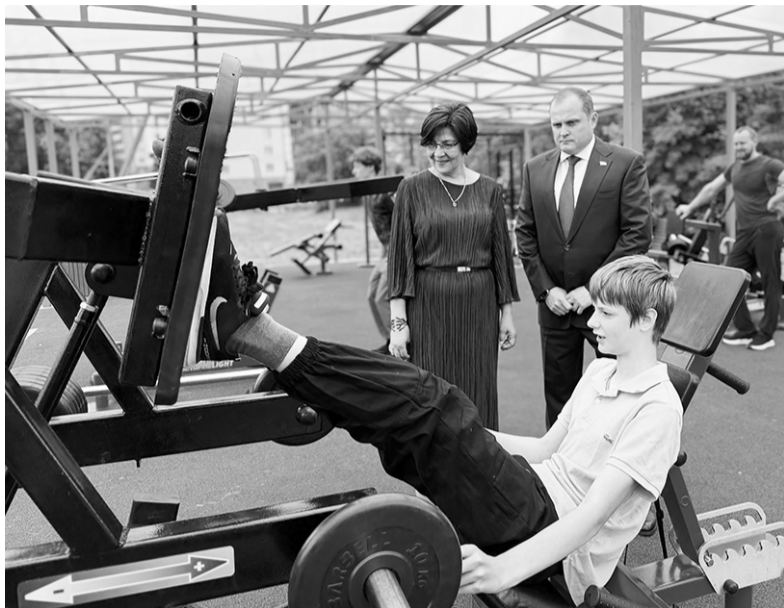
Новая спортивная площадка в «Месте встречи закатов»