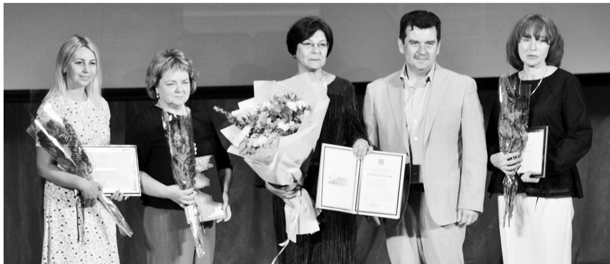
На церемонии вручения наград в ДК

11 июня в Кировске стартовала череда юбилейных торжеств. В преддверии 95-летия города во Дворце культуры прошло главное праздничное мероприятие, а жители получили два замечательных подарка – обновлённый фонтан в Театральном сквере и новую спортивную площадку в общественном пространстве «Место встречи закатов». А 12 июня Кировск отметил двойной праздник – День России и 95-летие родного города.