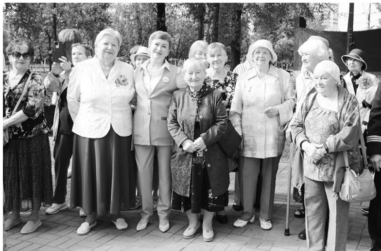
Гости городского праздника у ДК