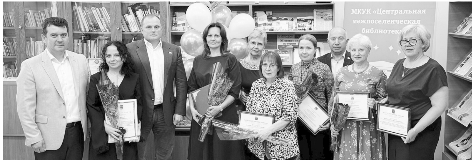
● Коллектив Кировской центральной библиотеки принимает поздравления от представителей власти

95 лет истории, мудрости, добрых традиций и преданности своему делу – Кировская центральная библиотека отметила свой юбилей.