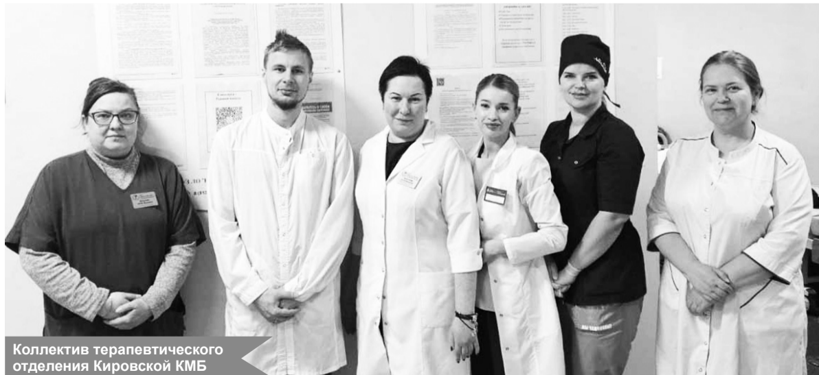
Коллектив терапевтического отделения Кировской КМБ

Люди, прошедшие лечение, не забывают сказать спасибо тем, кто ежедневно дарит им заботу и возвращает здоровье. И сегодня мы с удовольствием публикуем очередную благодарность – в адрес сотрудников Кировской клинической межрайонной больницы.