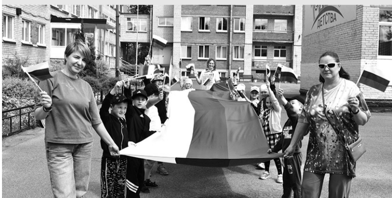
Праздник российского флага в «Логосе»