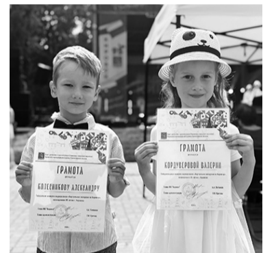
Юные герои города

Подготовила Юлия ТЕТАРСКАЯ, (по материалам пресс-службы КМР ЛО, администрации МО «Кировск» и Дворца культуры г. Кировска)