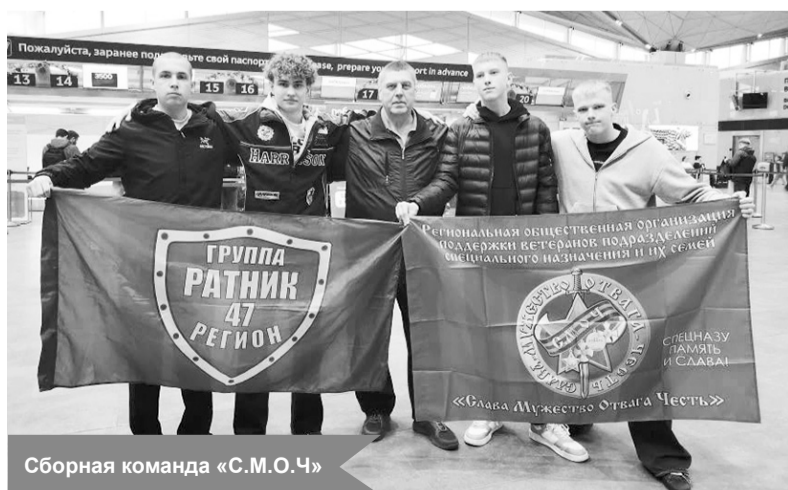
Сборная команда «С.М.О.Ч.»