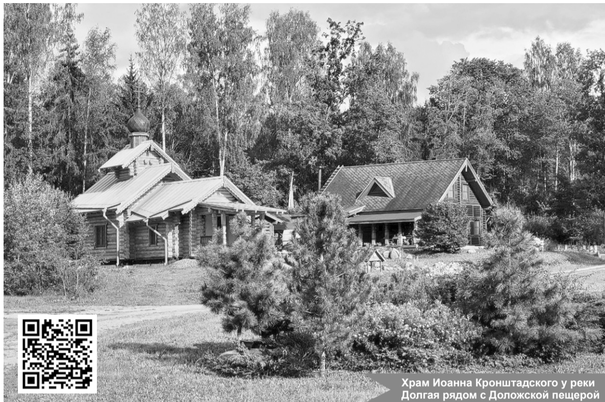
Храм Иоанна Кронштадского у реки Долгая рядом с Доложской пещерой

Продолжить знакомство с культурой, историей, бытом и природой региона предлагает Сланцевский историко-краеведческий музей, открывшийся в 2025 году после реконструкции