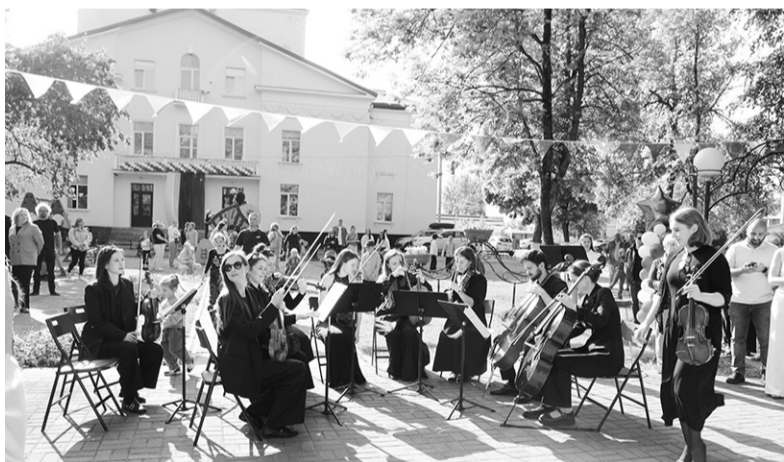
Выступление ансамбля солистов Ленинградской областной государственной филармонии