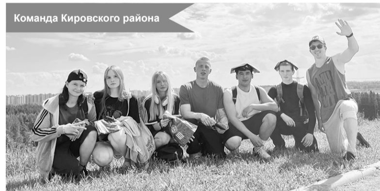
Команда Кировского района

По материалам Кировского политехнического техникума