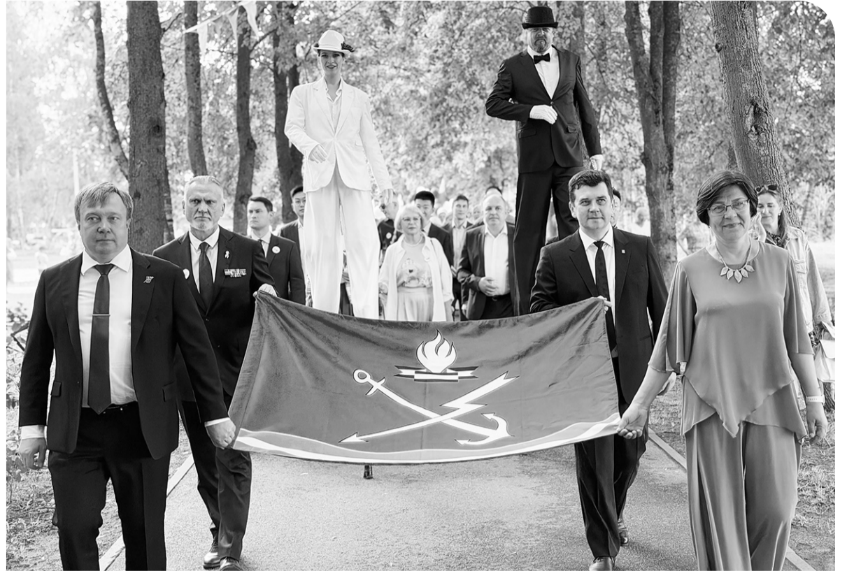
Руководители Кировска – во главе шествия

12 июня Кировск отметил сразу два важных события – День России и 95-летний юби-