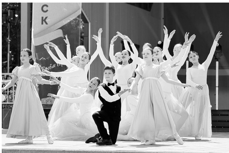
Творческое поздравление для кировчан от юных танцоров