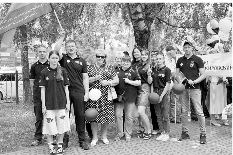
На праздник пришли целыми коллективами