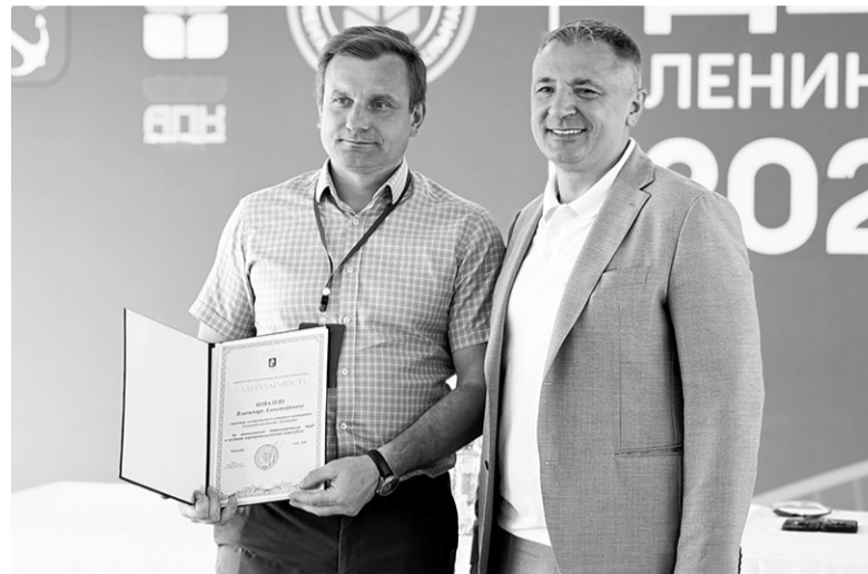
На областном мероприятии «День поля – 2026»

«День поля» традиционно остаётся важной площадкой для профессионального диалога, обмена опытом и знакомства с инновационными разработками.