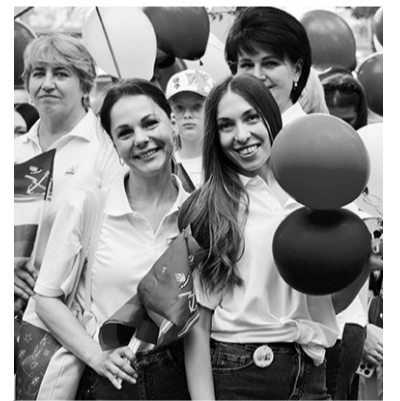
Кировчане рады празднику!