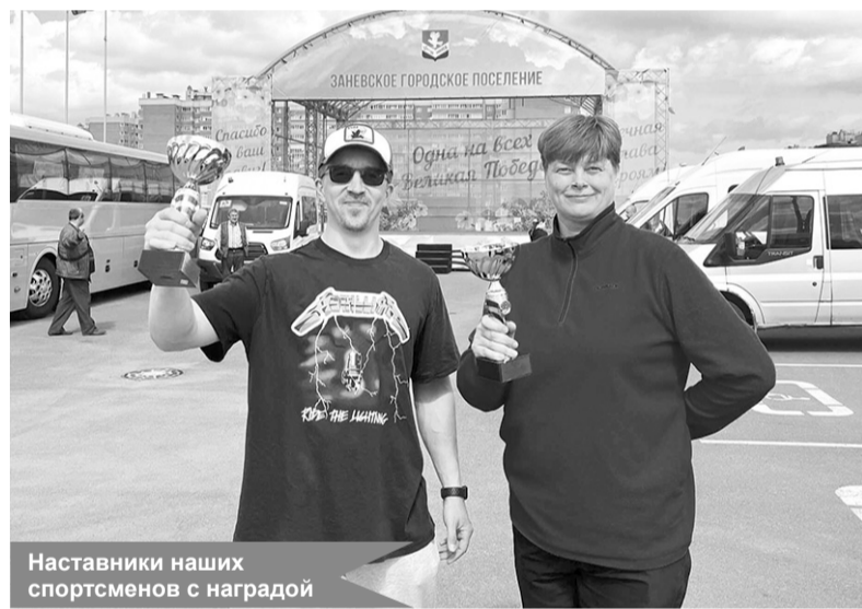
Наставники наших спортсменов с наградой

Мы гордимся нашими спортсменами и их тренерами! Так держать!