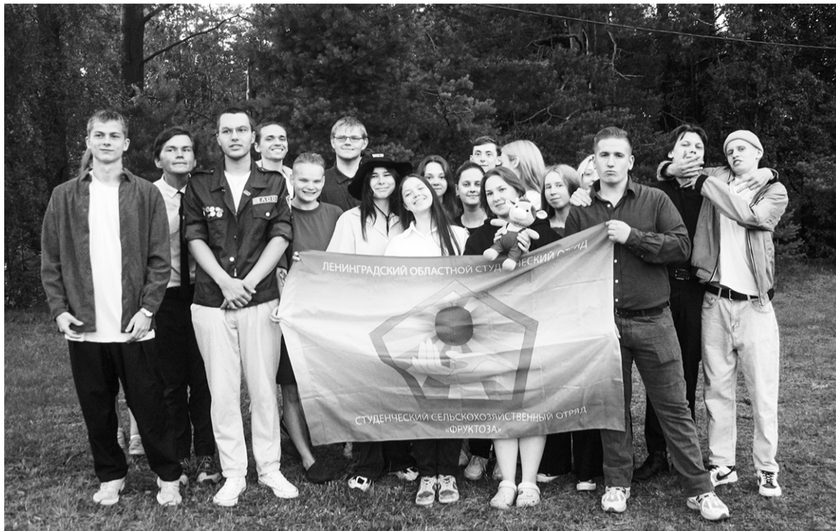
Трудовой десант Ленинградской области готов приносить пользу региону!

По материалам Ленинградского областного регионального отделения РСО