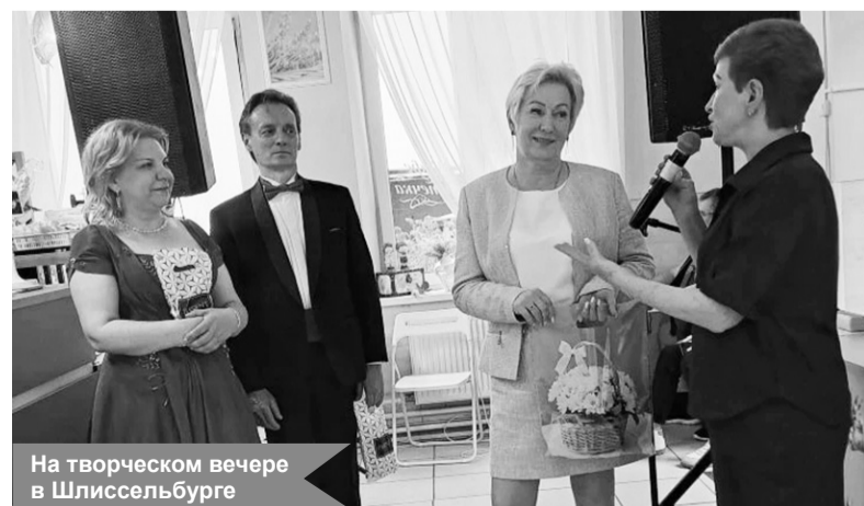
На творческом вечере в Шлиссельбурге

По материалам совета ветеранов МО «Кировск»