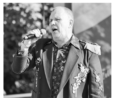
И песни, и танцы