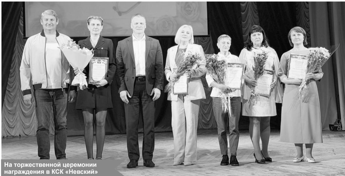
На торжественной церемонии награждения в КСК «Невский»