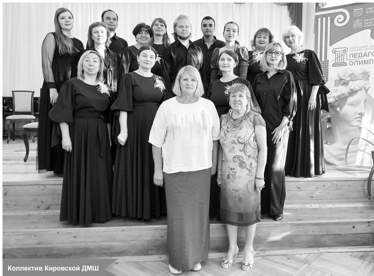
Коллектив Кировской ДМШ