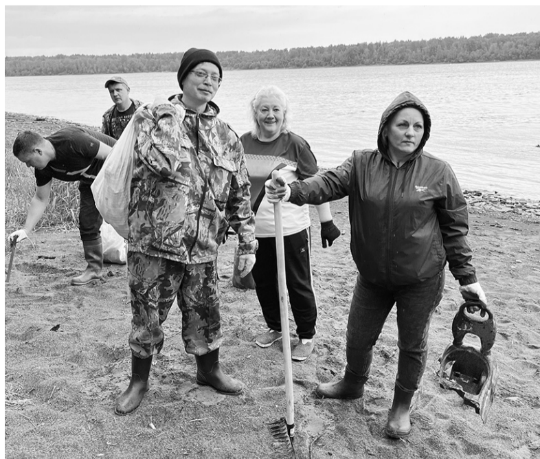
Сотрудники ДК п. Павлово на субботнике

Всероссийская акция «Вода России» проходит по инициативе Минприроды РФ в рамках федерального проекта «Сохранение уникальных водных объектов» национального проекта «Экологическое благополучие». Этот нацпроект, реализуемый по решению президента РФ с 2025 года, заботится об окружающей среде, включая расчистку водоёмов и ликвидацию свалок на их берегах.