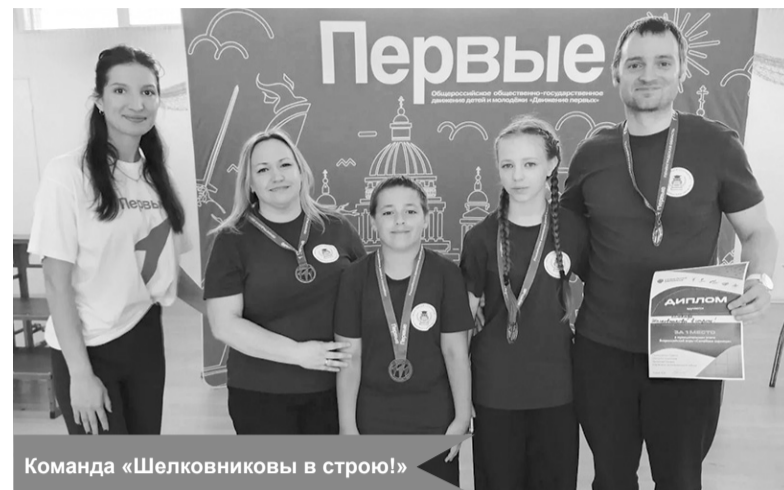
Команда «Шелковниковы в строю!»

Организаторы выражают благодарность судейской бригаде за принципиальность, а также волонтерам Кировского рай-