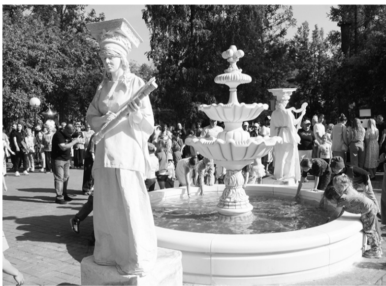
Обновлённый фонтан в Театральном сквере