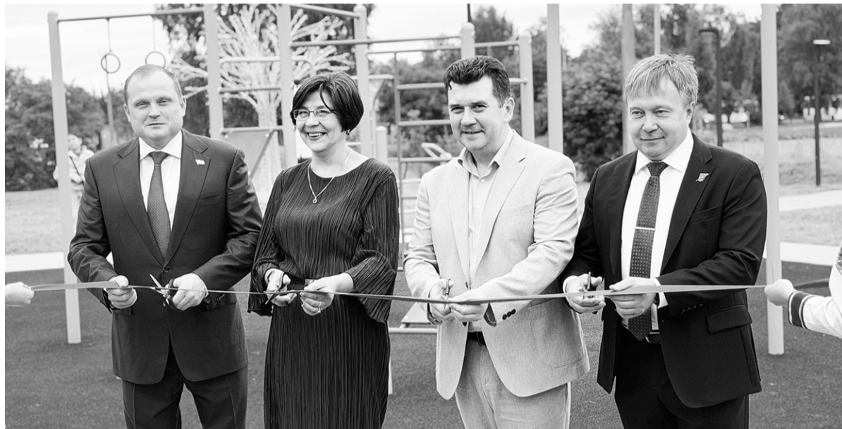
На открытии нового общественного пространства в Кировске