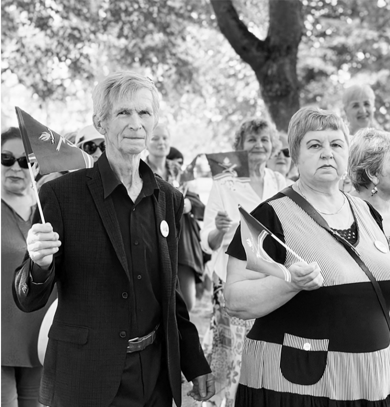
Шествие колонн предприятий, учреждений и организаций

время. Зрители увидели яркий пролог об истории города, видеоролики о его становлении и развитии, вспомнили героические страницы военного прошлого и достижения современных поколений кировчан. Особое место заняли страницы, рассказывающие о трудовом подвиге жителей, восстановлении города после Великой Отечественной войны и его сегодняшнем развитии.