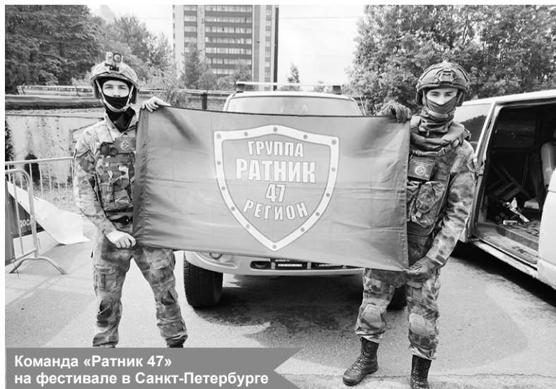
Команда «Ратник 47» на фестивале в Санкт-Петербурге

На минувшей неделе в Санкт-Петербурге прошёл фестиваль «Страйкфест», организованный ДОСААФ России по Санкт-Петербургу и Ленинградской области.