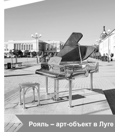
Рояль – арт-объект в Луге

Барышево Выборгского района на 30 лодок. Он расположился в живописнейшем месте на берегу реки Вуоксы.