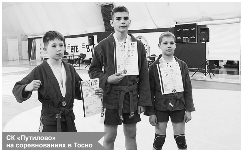
СК «Путиловец» на соревнованиях в Тосно

30 мая в городе Тосно Ленинградской области прошли областные соревнования по самбо среди юношей «День защиты детей». Турнир собрал 150 спортсменов из Санкт-Петербурга и Ленинградской области.