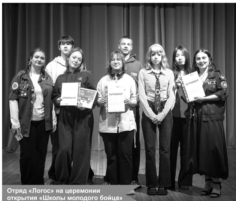
Отряд «Логос» на церемонии открытия «Школы молодого бойца»