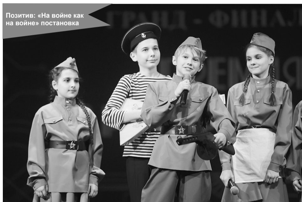
Позитив: «На войне как на войне» постановка