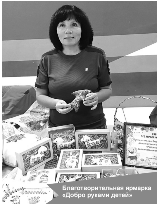
Благотворительная ярмарка «Добро руками детей»