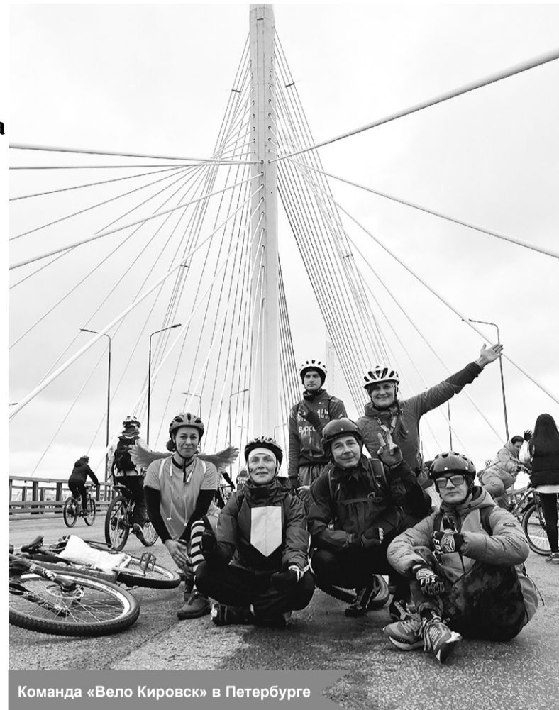
Команда «Вело Кировск» в Петербурге

По материалам сообщества «Вело Кировск» и открытых источников