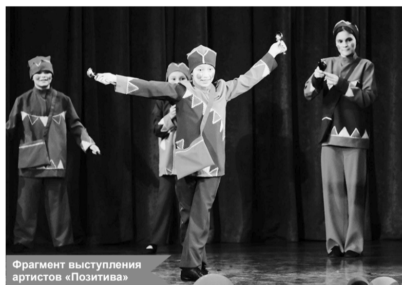
Фрагмент выступления артистов «Позитива»