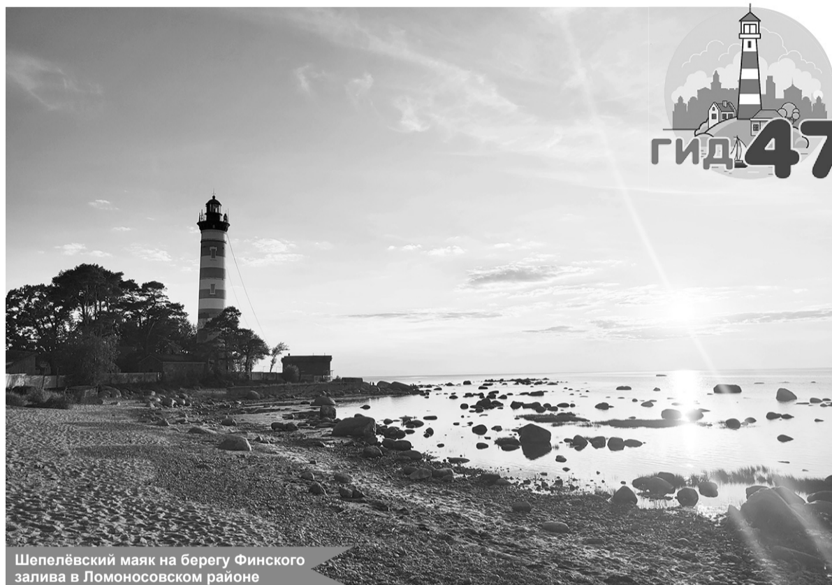
Шепелёвский маяк на берегу Финского залива в Ломоносовском районе

Новинкой 2026 года стал региональный проект «Крутая локация», который предлагает путешественникам, интересующимся промышленным туризмом, побывать на производствах Ленинградской области. На данный момент к этой теме подключились Выборгский, Ломоносовский, Кингисеппский, Тихвинский, Всеволожский, Гатчинский, Тосненский районы,