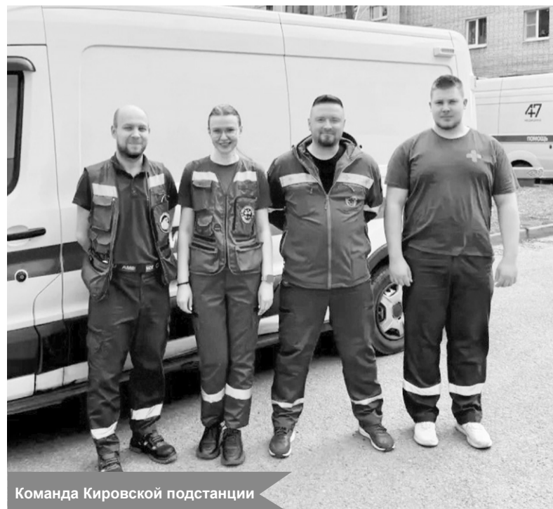
Команда Кировской подстанции

По материалам Станции скорой медицинской помощи