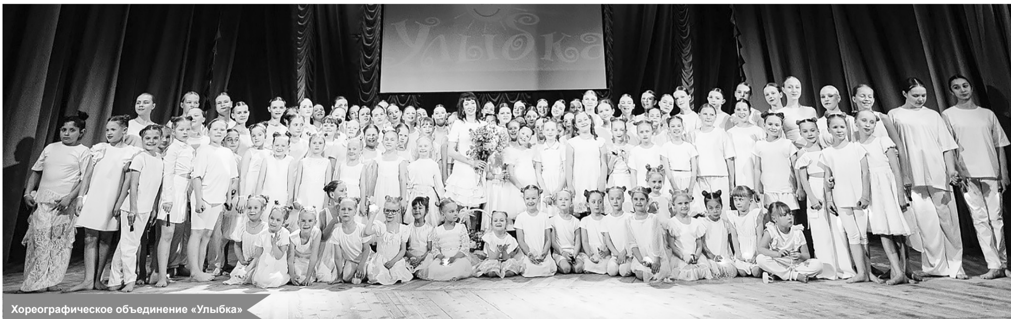
Хореографическое объединение «Улыбка»