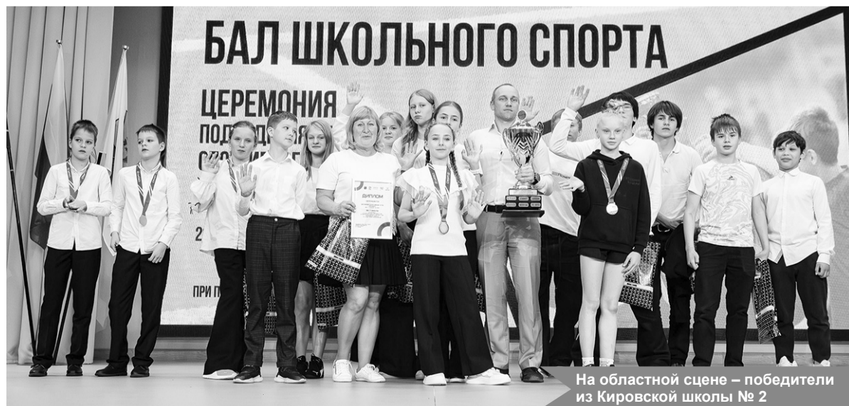
На областной сцене – победители из Кировской школы № 2