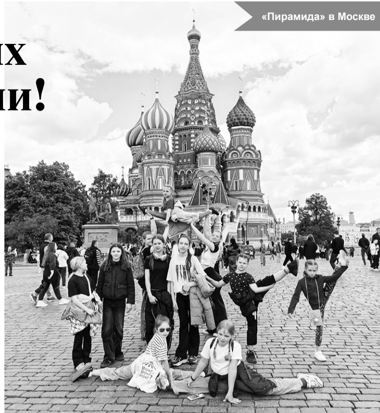
«Пирамида» в Москве