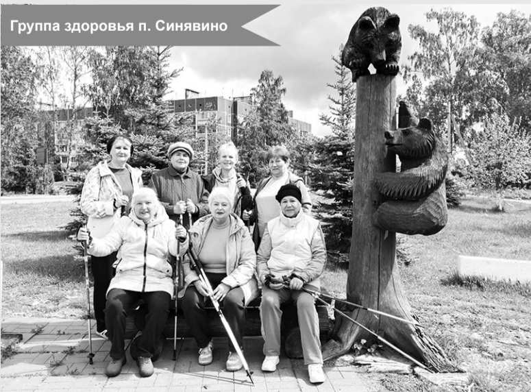
Группа здоровья п. Синявино