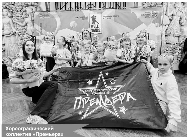
Хореографический коллектив «Премьера»