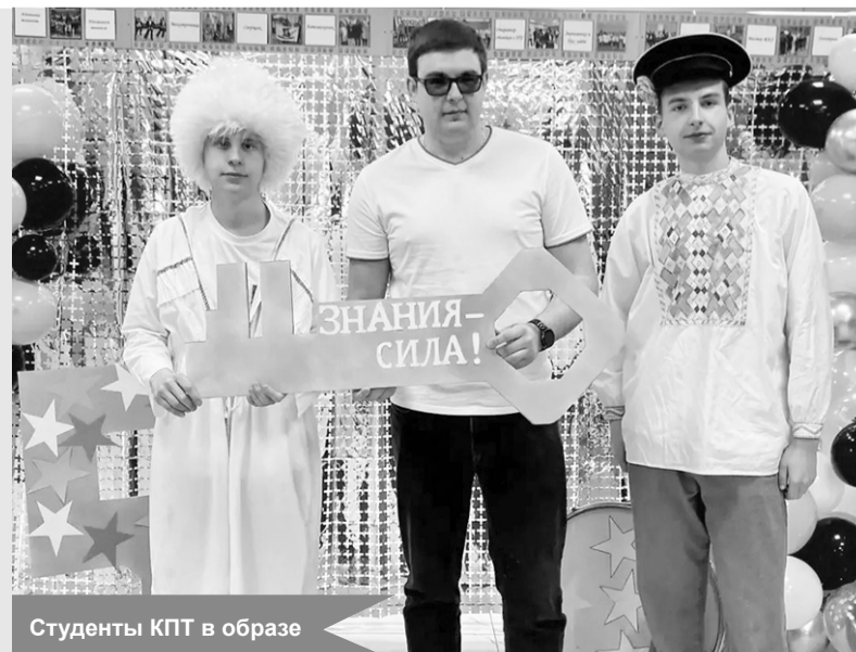
Студенты КПТ в образе