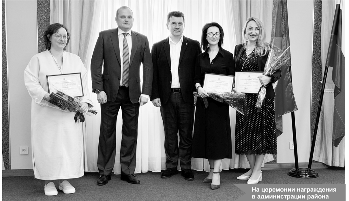
На церемонии награждения в администрации района

В торжественной обстановке сотрудникам отрасли вручили дипломы, почётные грамоты, благодарности и благодарственные письма Законодательного собрания Ленинградской области и администрации Кировского муниципального района за добросовестный труд, высокий профессионализм и преданность своему делу. Кроме того, отличившиеся специалисты были отмечены наградами депутата Государственной