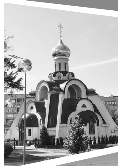
Собор иконы Божией Матери «Неопалимая Купина» в Сосновом Бору

Вот несколько новинок к сезону 2026 года. В рамках национального проекта «Туризм и гостеприимство» построен причал для каяков и сапбордов на реке Оредеж недалеко от объекта культурного наследия «Усадьба Елисеева». Он даст возможность безопасно заниматься активным отдыхом на воде с видом на прекрасные пейзажи Ленинградской области. Завершено строительство большого речного причала для маломерных судов в посёлке