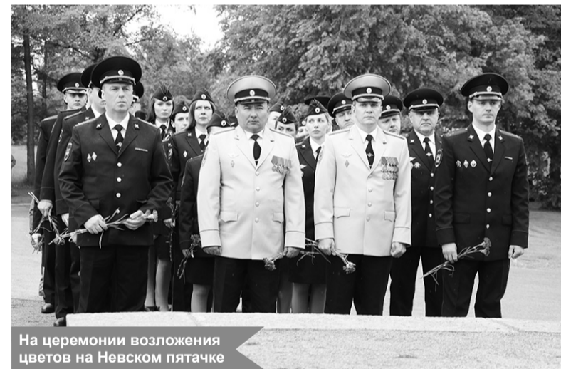
На церемонии возложения цветов на Невском пятачке