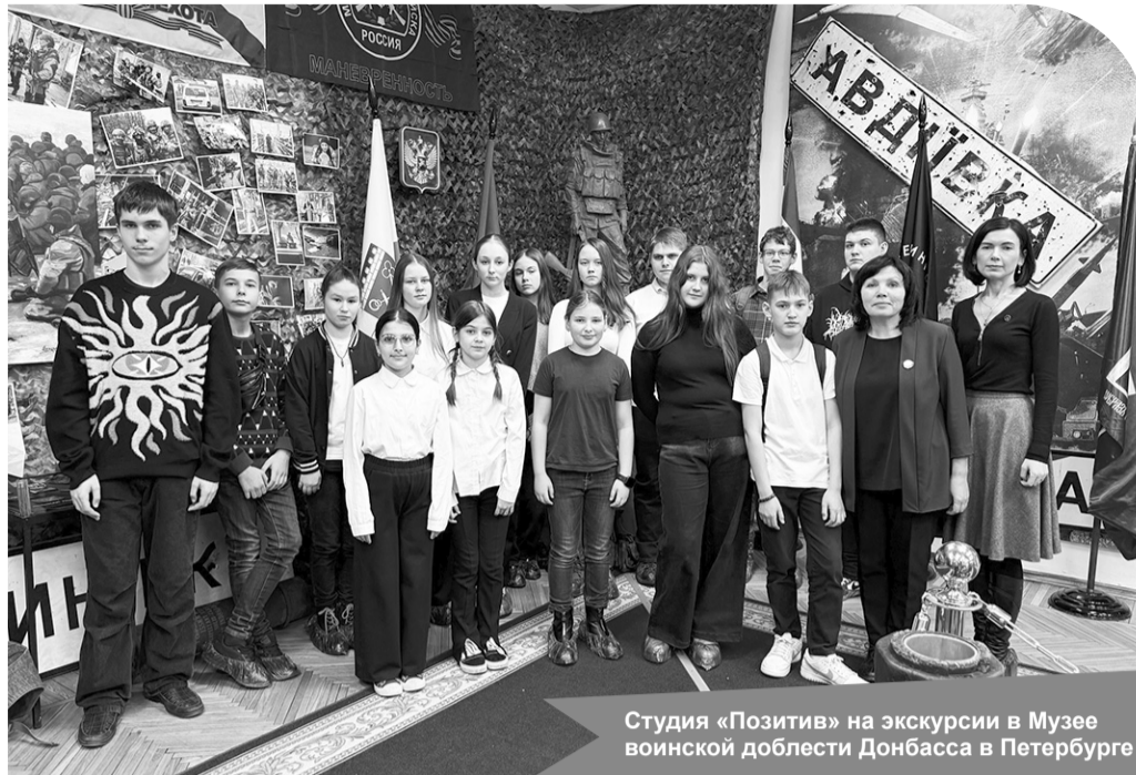
Студия «Позитив» на экскурсии в Музее воинской доблести Донбасса в Петербурге