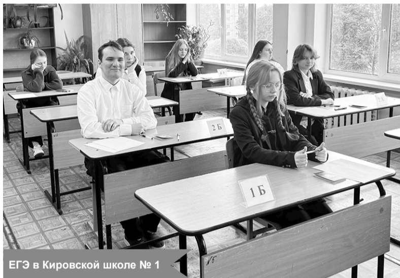
ЕГЭ в Кировской школе № 1

По материалам комитета образования КМР ЛО