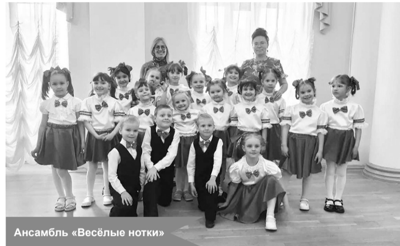
Ансамбль «Весёлые нотки»