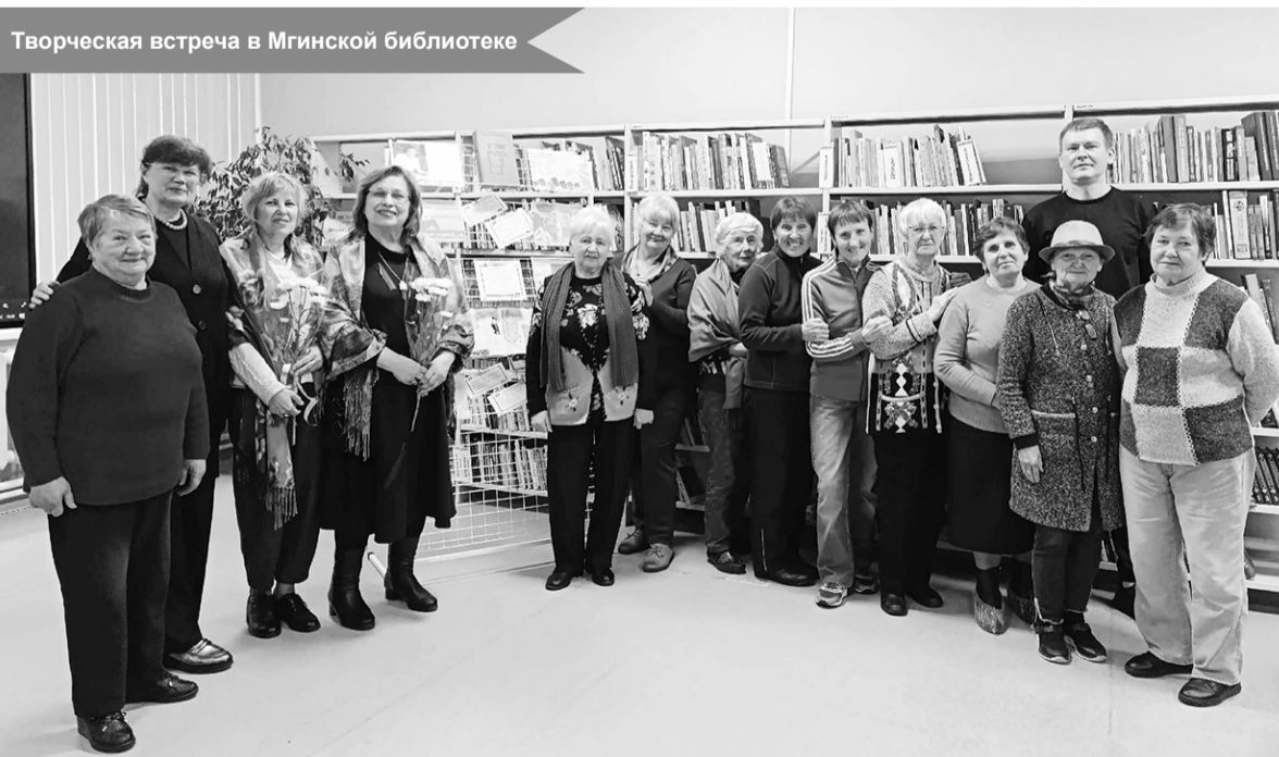
Творческая встреча в Мгинской библиотеке

Финалом встречи стало приятное известие: принято решение установить памятник Юрию Слепухину. Проект уже готов, причём окончательный вариант скульптор создал именно после прочтения «аргентинской диллогии». Завершилось мероприятие общим фото на память.