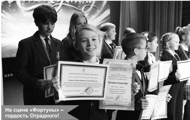
На сцене «Фортуны» – гордость Отрадного!

29 мая в «Фортуне» прошла торжественная церемония «Шаг к успеху» – праздник талантливых и целеустремлённых представителей молодёжи Отрадного.