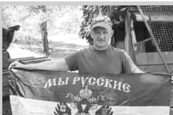
Памяти Героя СВО ..... → стр. 6-7