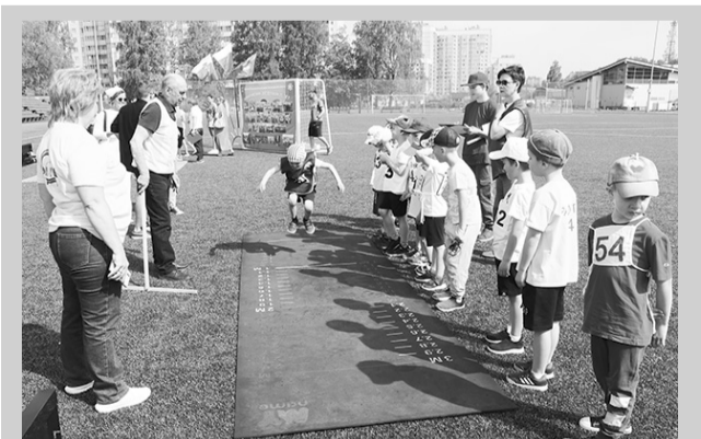
«Олимпийские звёздочки» зажигают ..... → стр. 11