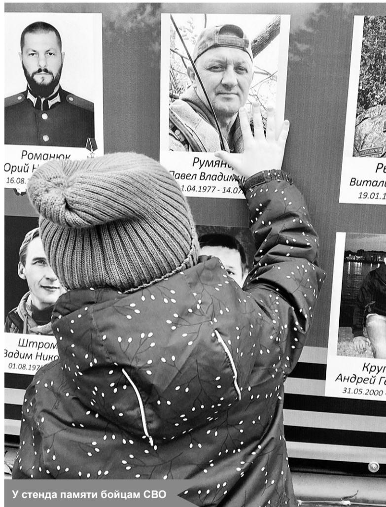
У стенда памяти бойцам СВО