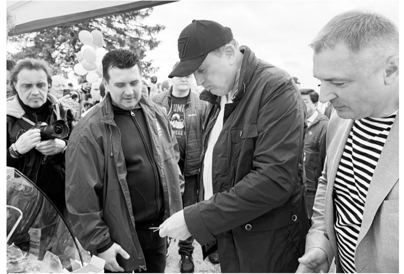
Символ Ленинградской области по вкусу каждому

– Корюшка – это не просто гастрономический символ Ленинградской области, а часть нашей истории, культуры и гостеприимства. Такие фестивали объединяют людей, поддерживают местных производителей и помогают развивать туристическую привлекательность региона, – отметил