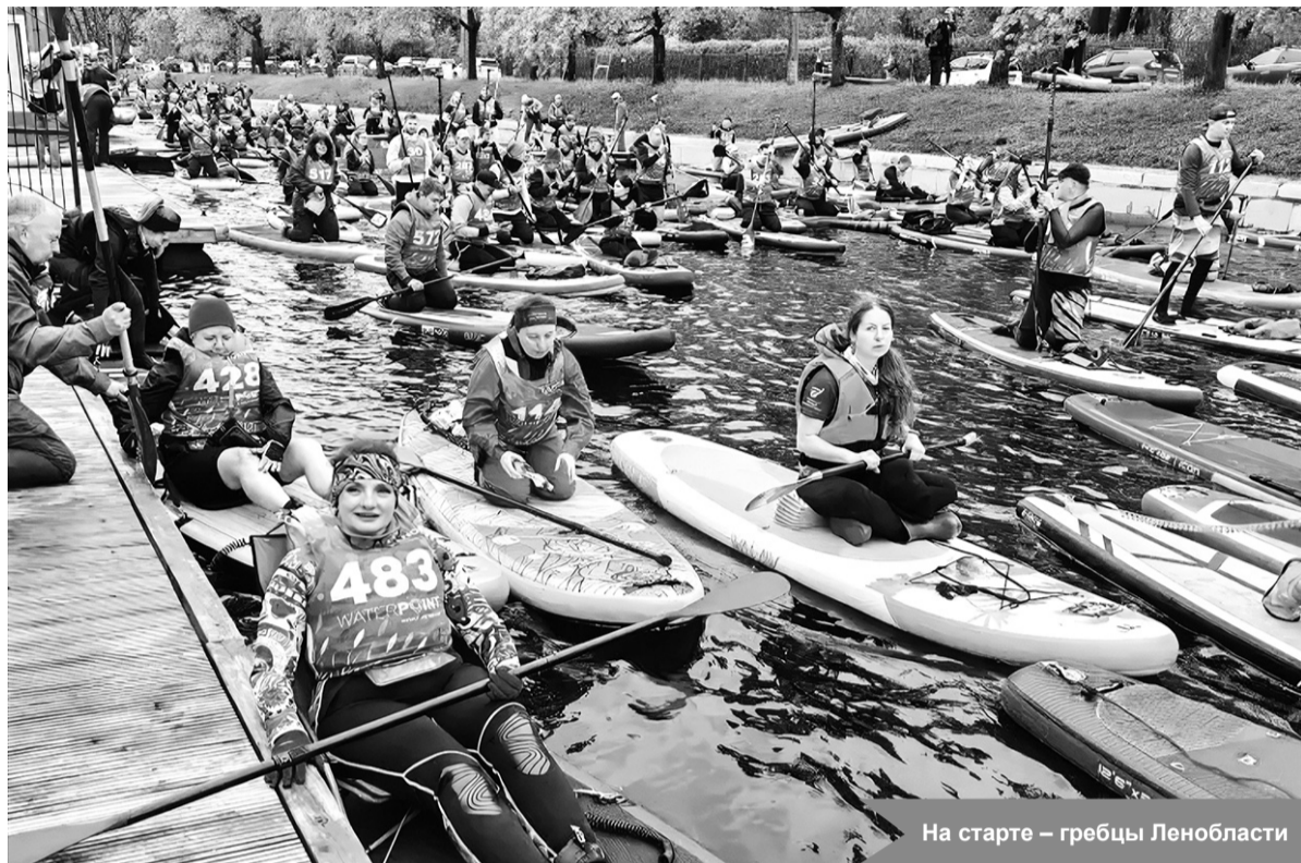
На старте – гребцы Ленобласти