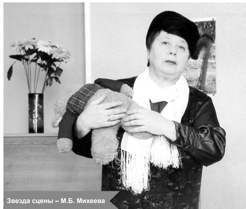
Звезда сцены – М.Б. Михеева