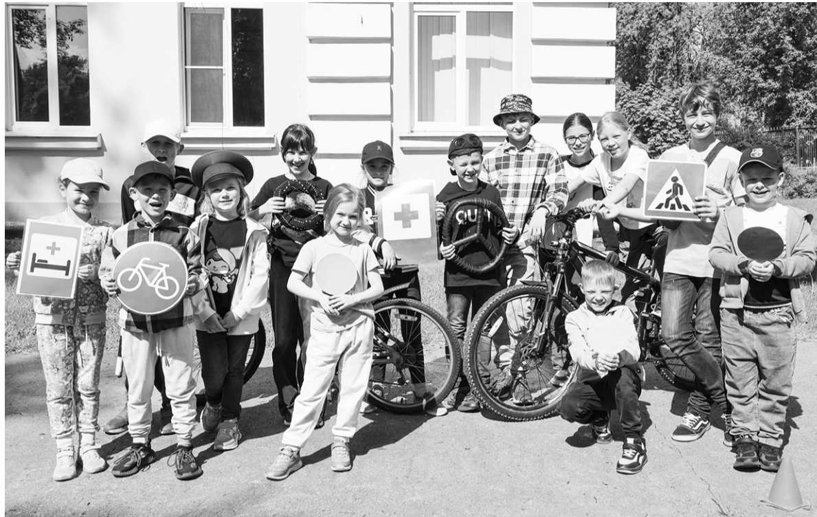
Безопасность детей – в руках родителей!

тире: малыш может проснуться и полезть к открытому окну;