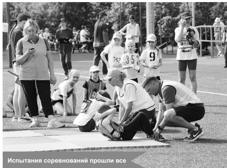
Испытания соревнований прошли все