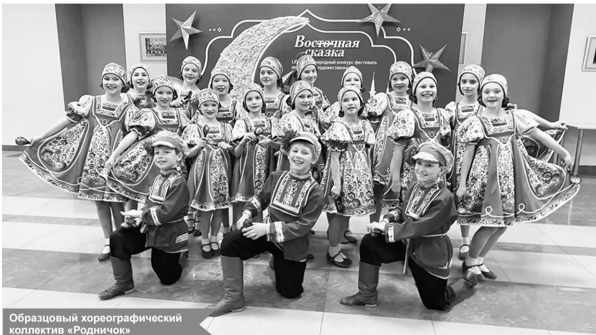
Образцовый хореографический коллектив «Родничок»

– Эта победа – результат огромного труда, преданности искусству, таланта юных артистов и профессионализма наставников. Коллектив «Родничок» вновь подтвердил высокий уровень хореографического искусства и достойно