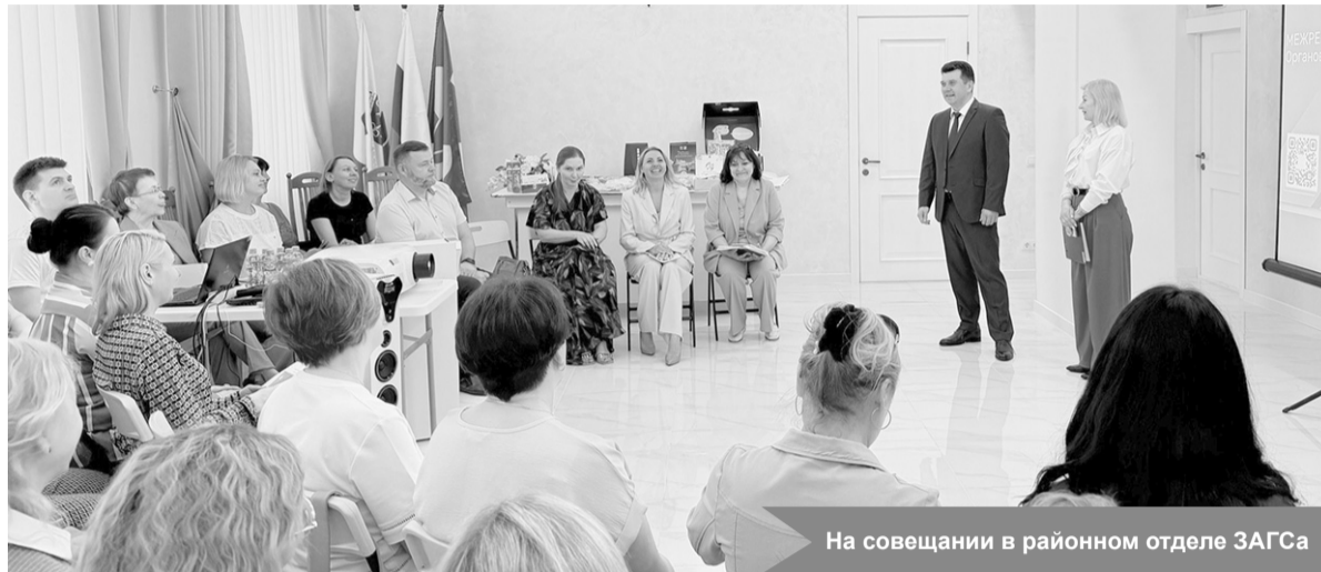
На совещании в районном отделе ЗАГС

Отдельной темой встречи стали вопросы речевой культуры и профессиональной коммуникации работников органов ЗАГС. Обсуждалась важность грамотного, корректного и тактичного взаимодействия с гражданами, а также особенности делового общения в сфере оказания госу-