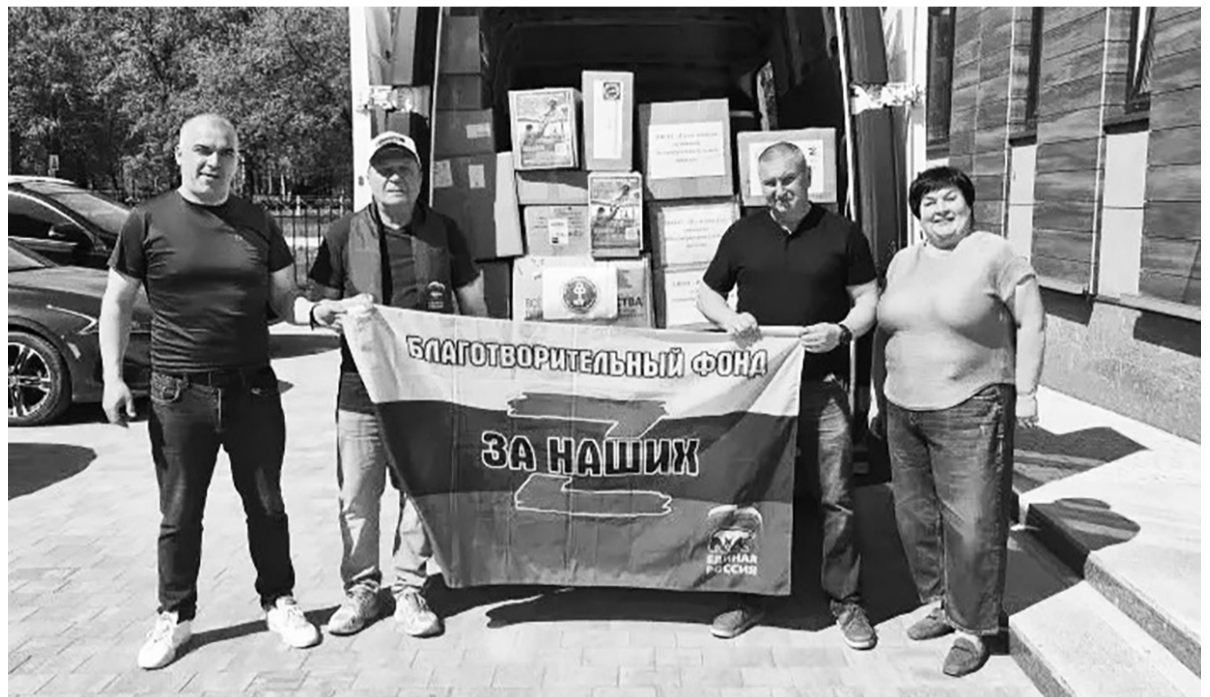
Очередной груз помощи отправлен за ленточку

В состав партии гуманитарной помощи вошли самые востребованные предметы первой необходимости для военнослужащих, а также трогательные письма и поздравительные открытки с