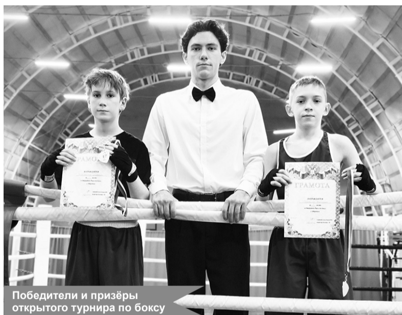
Победители и призёры открытого турнира по боксу

По материалам отделения бокса Кировской СШ (филиал в Отрадном)