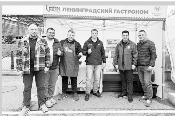
«Корюшка идёт!»: наши на празднике ..... → стр. 2