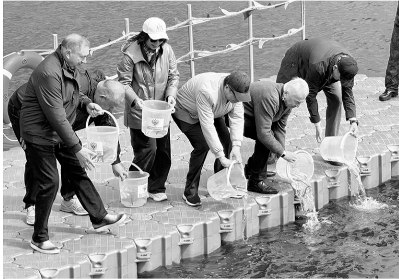
Экологическая акция «Зарыбление» на реке Волхов

Ленинградская область в восьмой раз окунулась в атмосферу одного из самых ярких гастрономических событий региона – фестиваля «Корюшка идёт!»