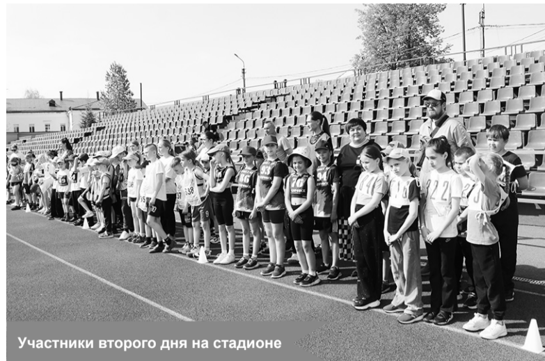
Участники второго дня на стадионе