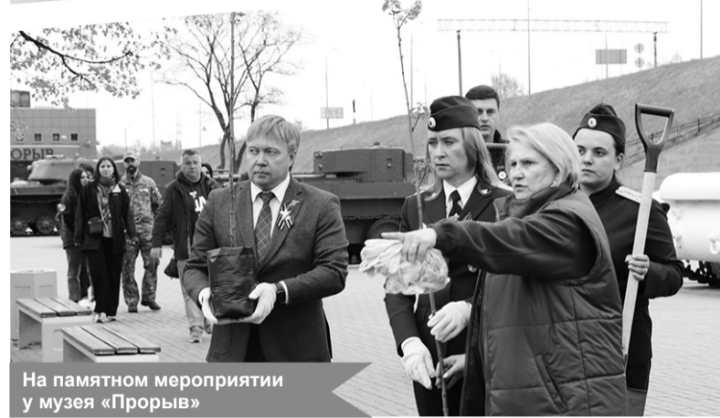
На памятном мероприятии у музея «Прорыв»