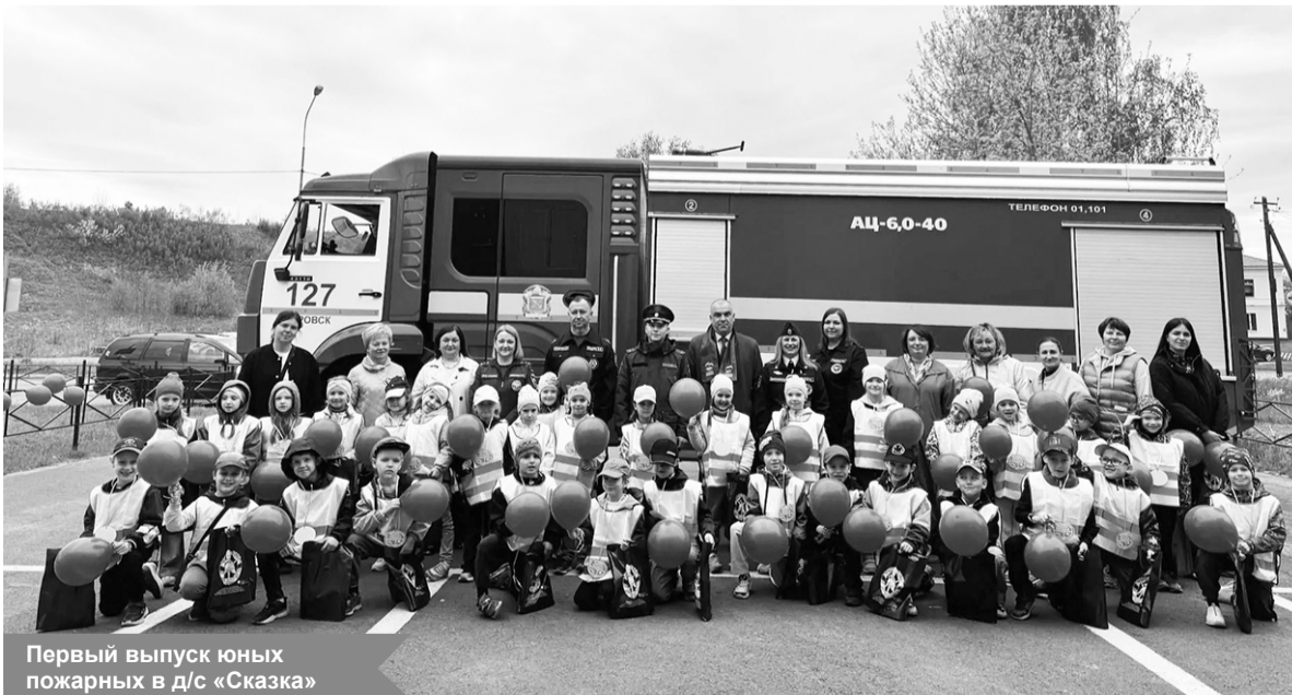
Первый выпуск юных пожарных в д/с «Сказка»