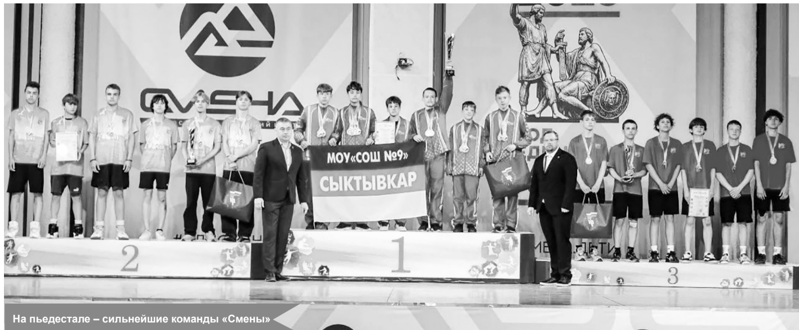
На пьедестале – сильнейшие команды «Смены»