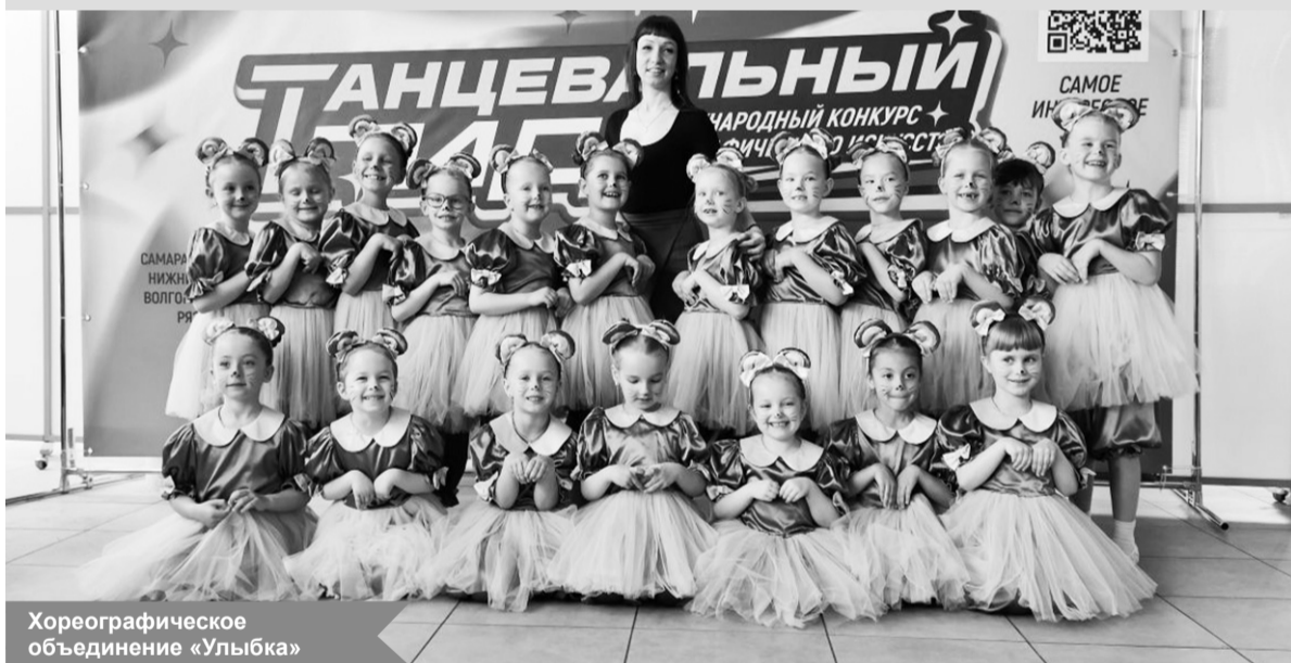
Хореографическое объединение «Улыбка»

17 мая юные танцоры из хореографического объединения «Улыбка» Районного Центра дополнительного образования блистали на сцене Дома молодёжи в Санкт-Петербурге – многочисленным составом они принимали участие в Международном конкурсе хореографического искусства «Танцевальный гид».