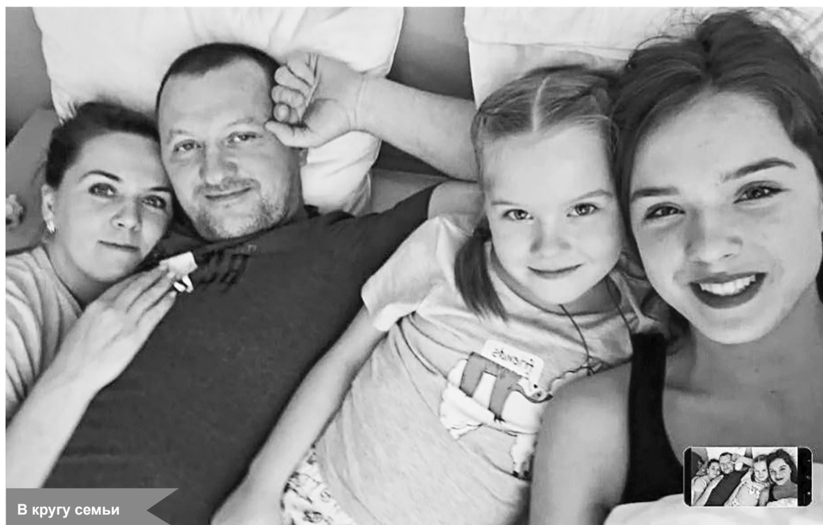
В кругу семьи

стремился их решить. Очень любил животных, испытывал к ним особые чувства – никогда не мог пройти мимо бездомных котят или собак. Всех нёс домой спасать. Спорить с ним было бесполезно: разве с добром спорят? Все его решения были основаны на созидании. В школе не блистал, но учился хорошо. Получил профессию повара в техникуме водного транспорта в Шлиссельбурге. Ходил с отцом в плавания, готовил на команду – работа ему нравилась. В дальнейшем он принял решение освоить сферу перевозок. Смена профессии далась ему легко и это стало делом его жизни.