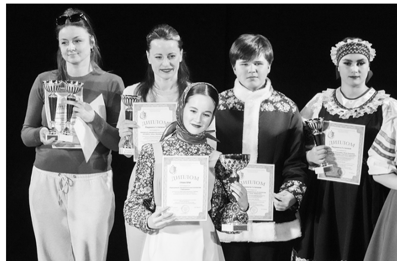
Победители и призёры районного конкурса