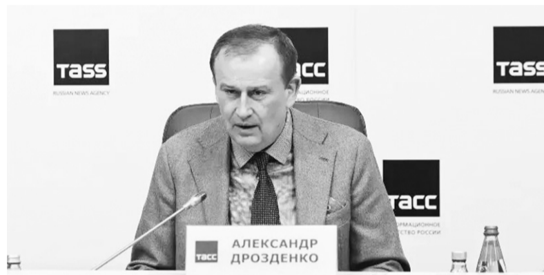
Глава 47-го региона Александр Дрозденко в пресс-центре ТАСС

По материалам пресс-службы губернатора и правительства ЛО