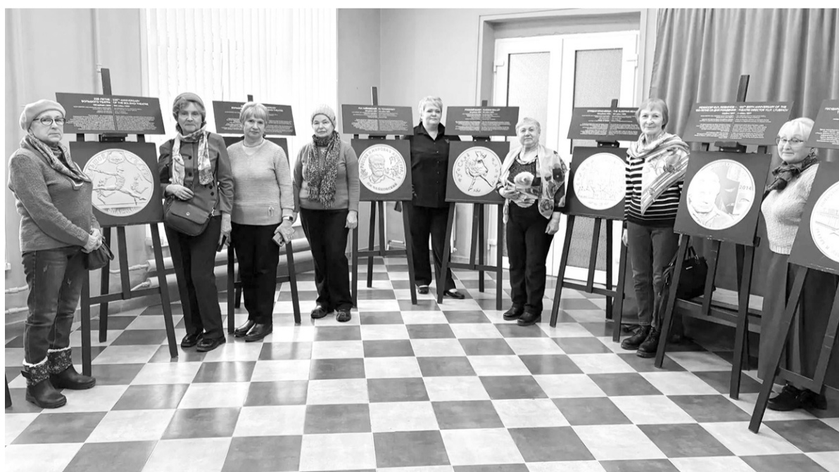
Выставка детской коллекции Банка России в ЦВР г. Отрадное

По материалам Центра внешкольной работы г. Отрадное