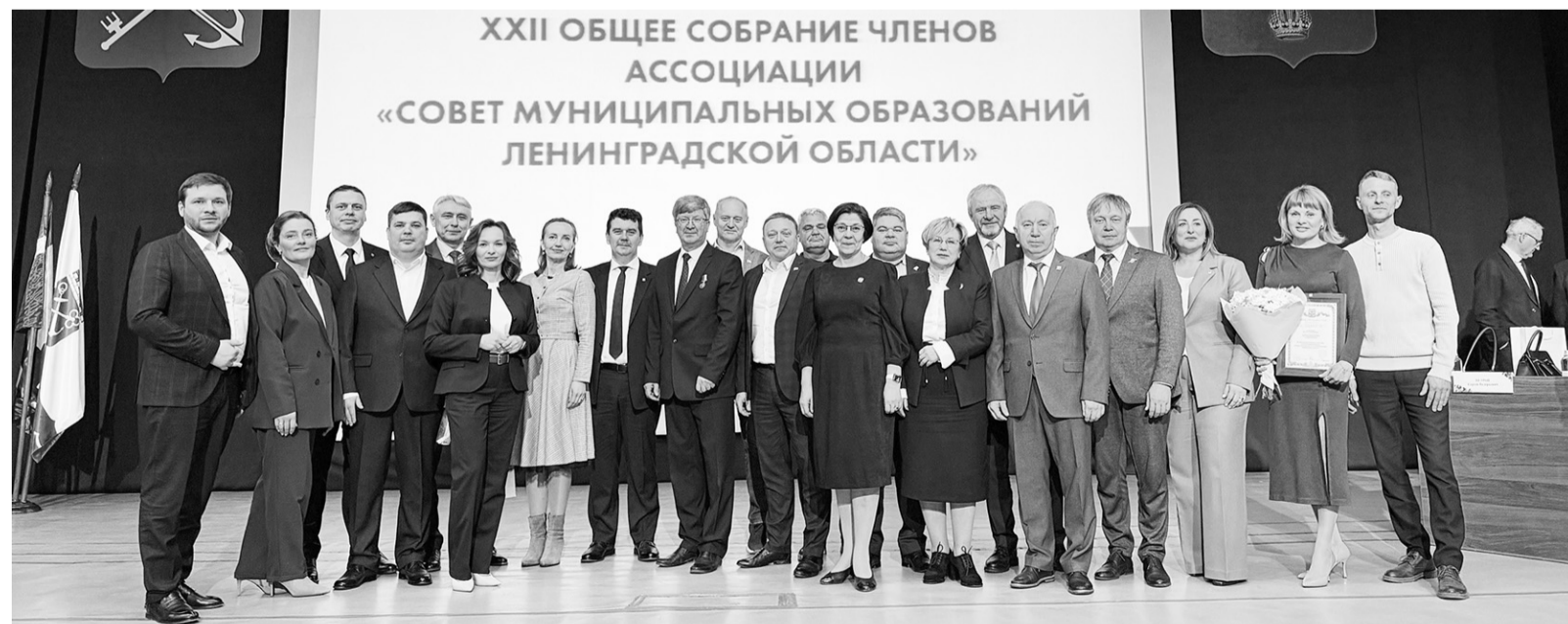
Делегация Кировского района Ленинградской области в Тихвине