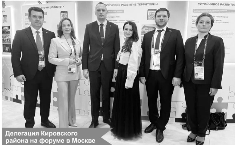
Делегация Кировского района на форуме в Москве

В День местного самоуправления президент России Владимир Путин встретился с представителями муниципалитетов всех субъектов нашей страны на третьем Всероссийском муниципальном форуме «Малая родина – сила России».