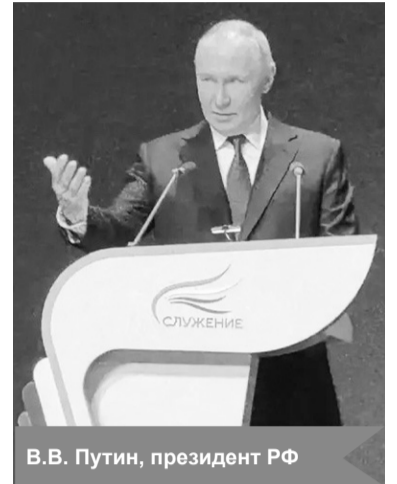
В.В. Путин, президент РФ

Ключевым событием стала церемония награждения Всероссийской муниципальной премии «Служение», которая по праву считается главной муниципальной наградой страны. Президент Российской Федерации Владимир Путин отметил вклад всех, кто ежедневно работает над тем, чтобы жизнь людей становилась комфортнее, а муниципалитеты – сильнее и эффективнее, и вручил награды победителям.