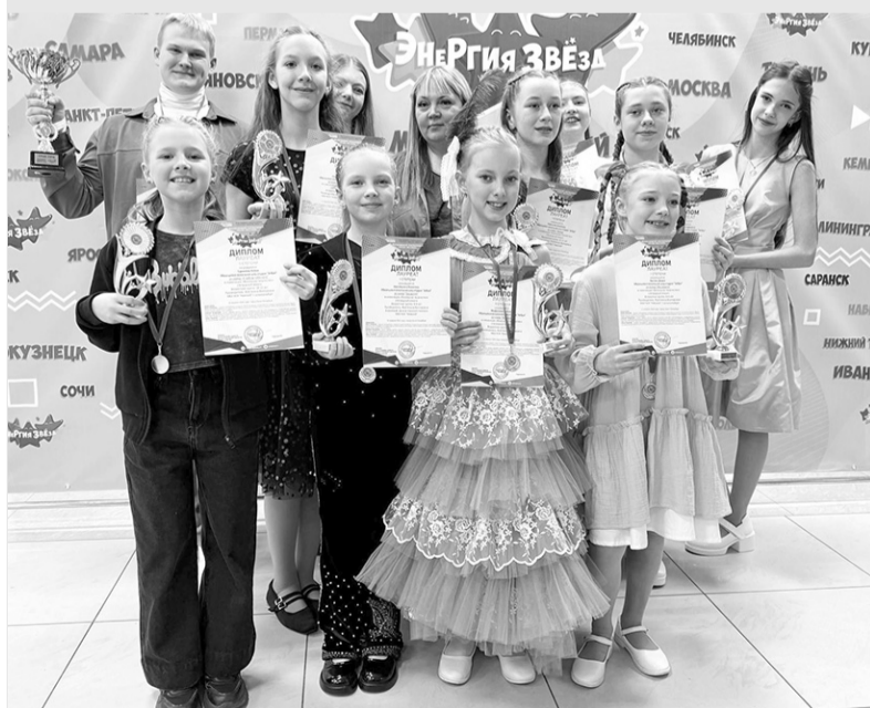
Вокальная шоу-студия «Зебра»