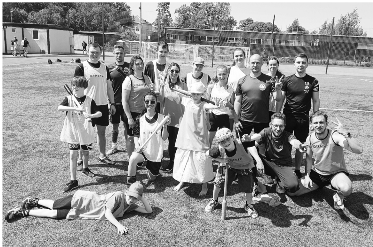
Тренировка по лапте отрядной команды «Дикие лоси»