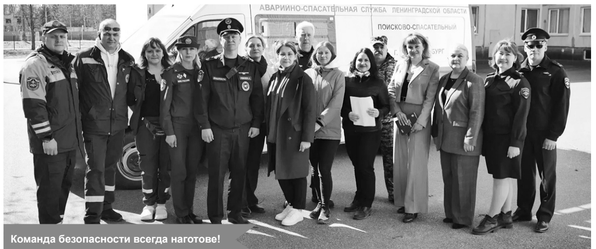
Команда безопасности всегда наготове!

По материалам комитета образования КМР ЛО