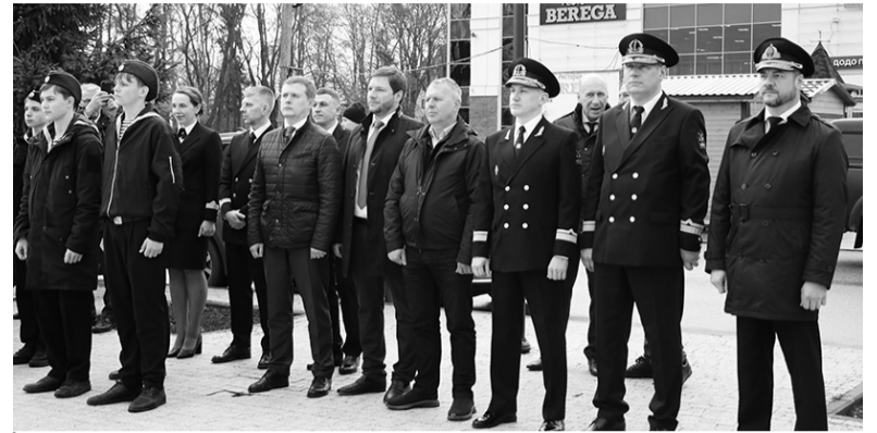
На торжественном открытии навигации в Шлиссельбурге

Староладожский канал остаётся одним из самых масштабных строительных проектов эпохи Петра Великого. Он обеспечивал связь «глубинки» и Петербурга, и заметно повлиял на развитие и образ жизни Шлиссельбурга, Новой Ладоги и других поселений на его трассе.