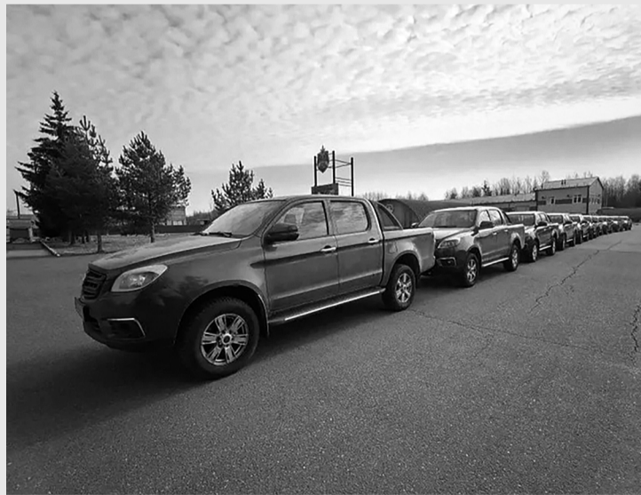
В Ленобласти мобильные огневые группы получили новую технику. КУГИ ЛО передал 10 автомобилей «Соллерс СТ6»

6-й гвардейской армии ВВС и ПВО, дислоцированной на территории Ленинградской области, будет оказана дополнительная материальная и техническая помощь.