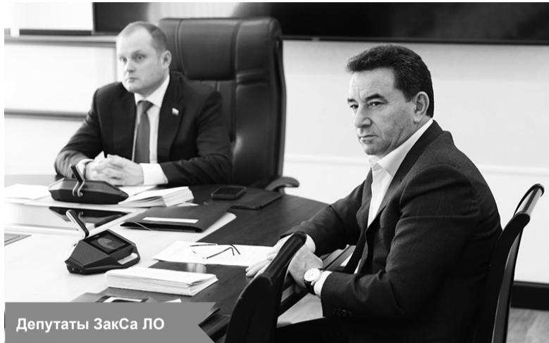
Депутаты ЗакСа ЛО

– Согласно ранее принятому Законодательным собранием областному закону, одним из критериев предоставления