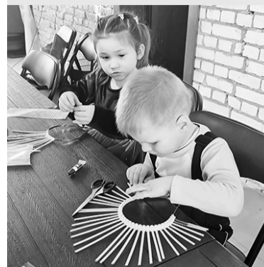
Мастер-класс в «Кредо»