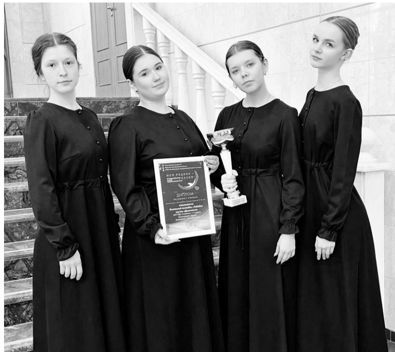
Вокальный ансамбль «ЗаБаВа» КДЦ «Синявино»