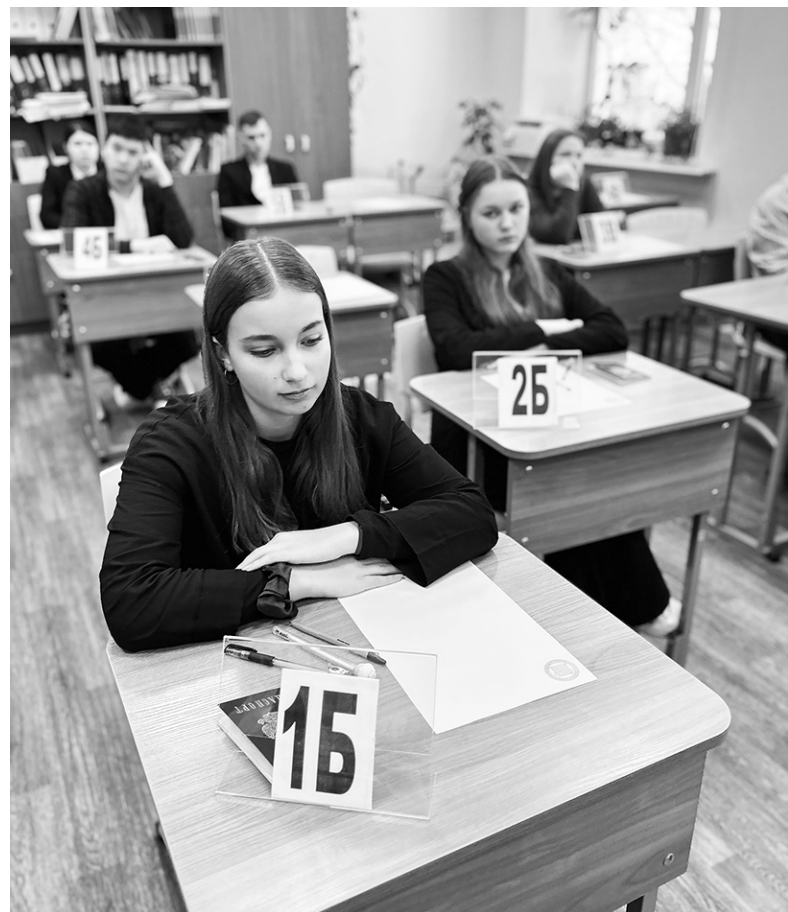
На пробном ЕГЭ по русскому языку

По материалам комитета образования КМР ЛО