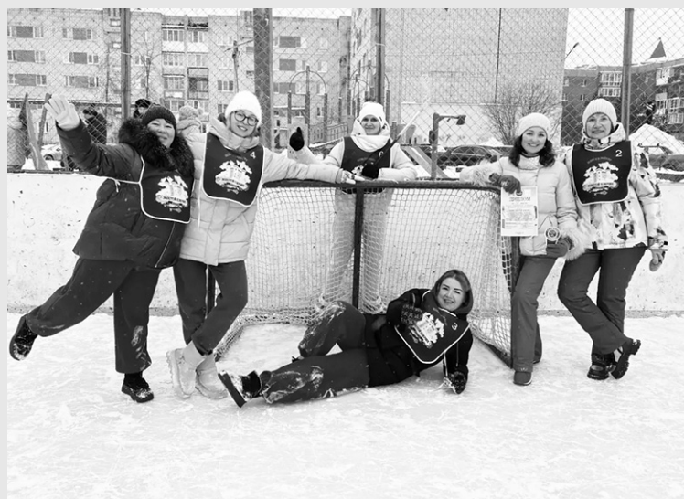
«Дайте нам клюшки в руки — покажем класс!»