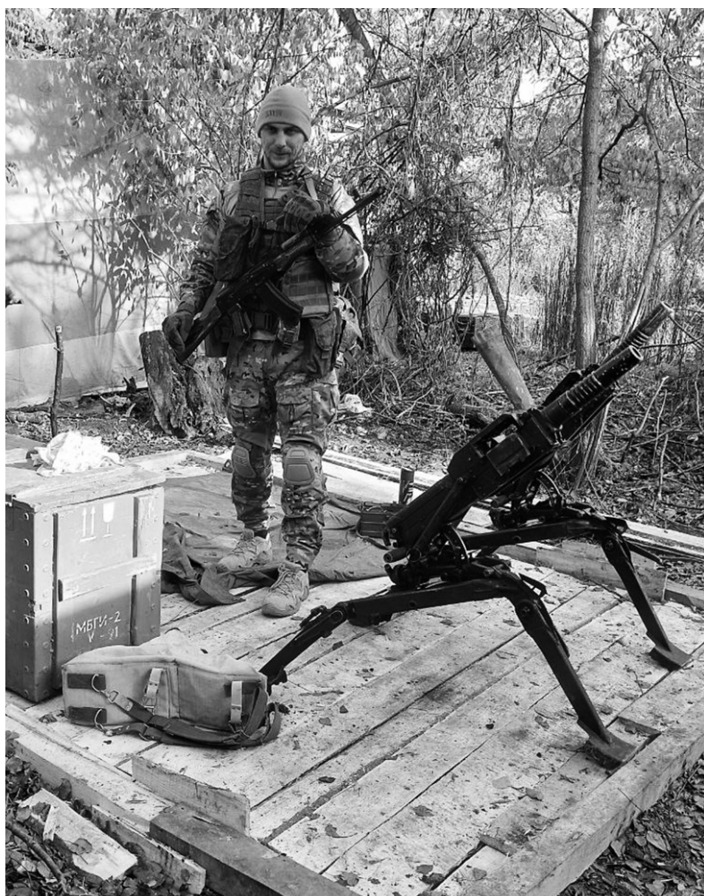
На боевом задании