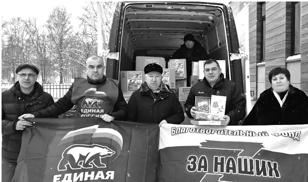
«Посылки загрузили, отправили – ждите!»

В состав отправленной гумпомощи вошли предметы первой необходимости, такие как средства личной гигиены, а также сладкие подарки, трогательные письма и поздравительные открытки, созданные детьми, и окопные свечи, изготовленные с особым усердием.