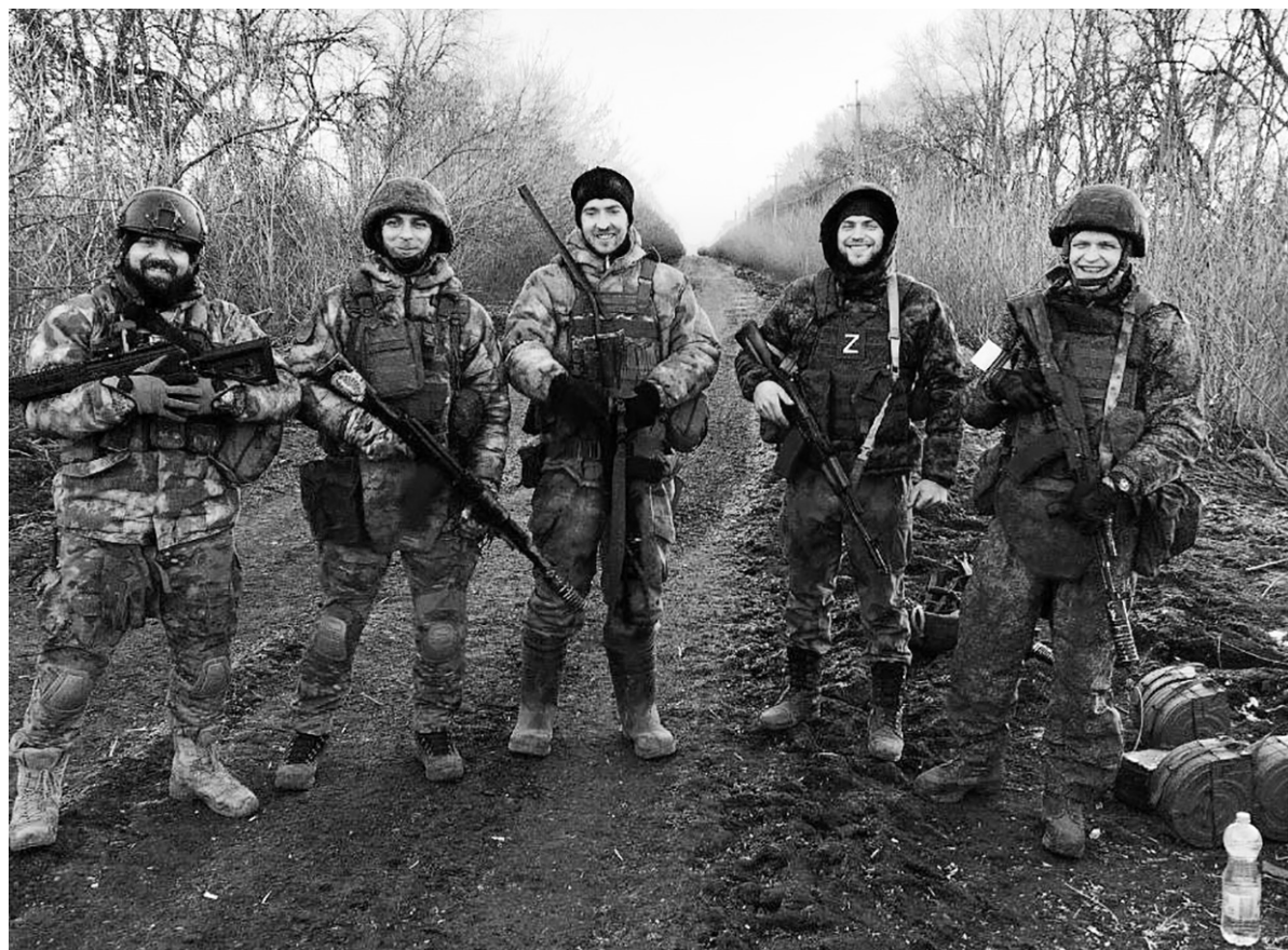
Плечом к плечу за победу

сительного отдыха. Отряд был дружным, бойцы всегда помогали друг другу. Мы со своей стороны тоже старались оказывать посильную помощь. Жители Шлиссельбурга отправляли посылки через общественное объединение, обращались мы и в благотворительный фонд Кировского района «За наших». Никто не отказывал, все старались сделать всё возможное и невозможное для ребят.