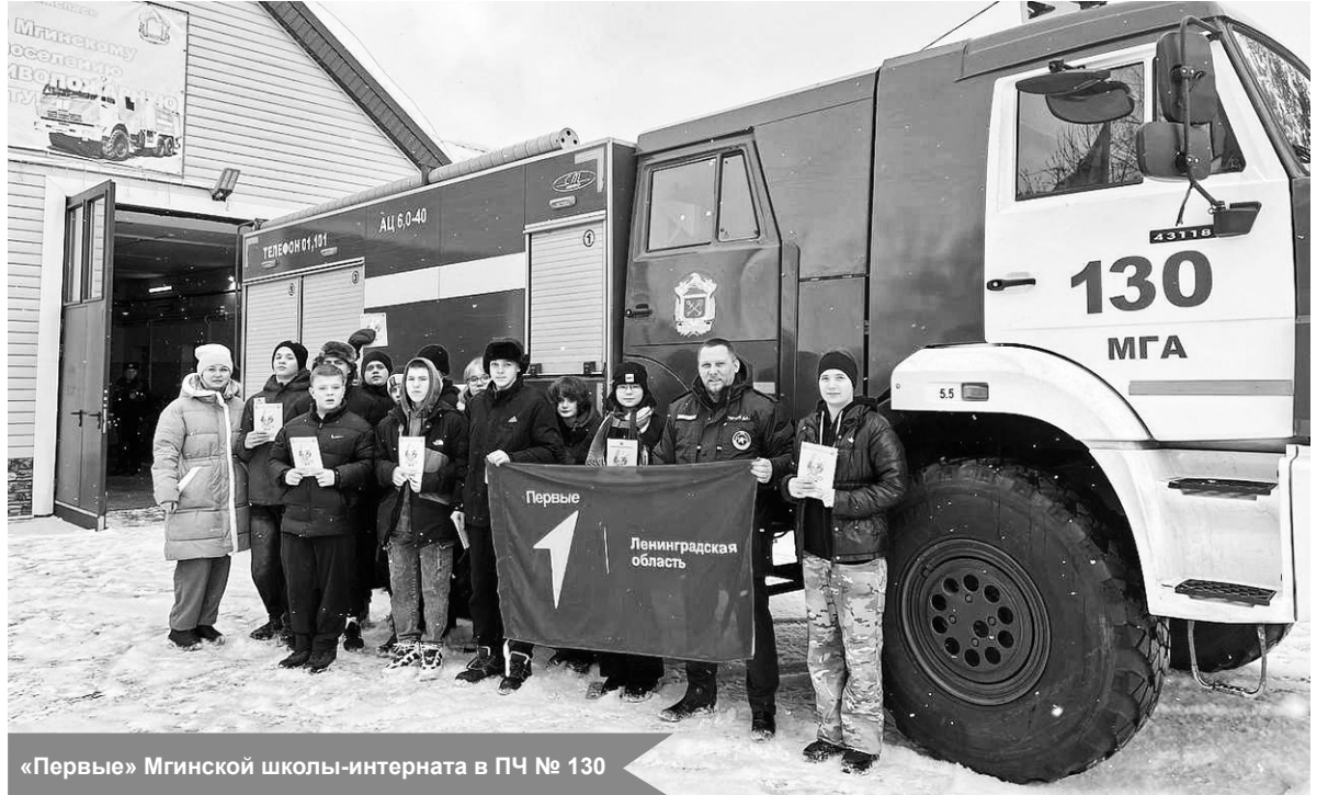
«Первые» Мгинской школы-интерната в ПЧ № 130

Экскурсия прошла интересно и познавательно. Ребята получили много полезной информации и заряд положительных эмоций. Они научились распознавать причины возникновения пожаров и правильным действиям в экстренных ситуациях.