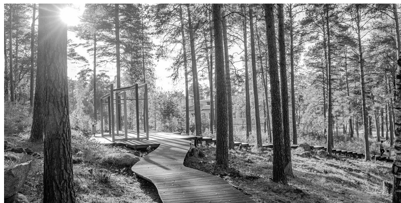
Парк «Грачиная гора» в посёлке Петровское Приозерского района