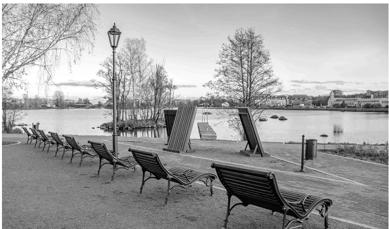
Благоустройство участка Петровской набережной в Выборге

Во всех районах Ленобласти продолжается голосование по выбору общественных территорий для благоустройства в 2027 году. Отдать свой голос за позитивные изменения в родном городе или посёлке можно до 19 февраля.