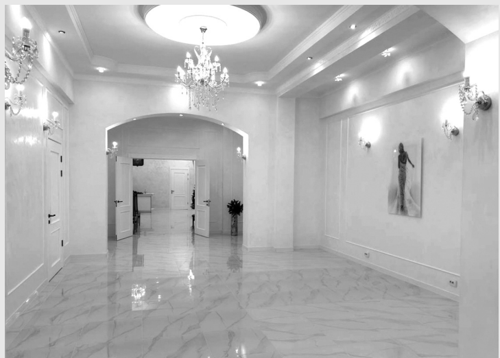
На прошлой неделе губернатор Ленобласти Александр Дрозденко посетил отремонтированное здание отдела ЗАГСа Кировского района ЛО

В 2025 ГОДУ В ЛЕНИНГРАДСКОЙ ОБЛАСТИ КОЛИЧЕСТВО БРАКОВ УВЕЛИЧИЛОСЬ НА 4 %, А ЧИСЛО РАЗВОДОВ СНИЗИЛОСЬ НА 21 %