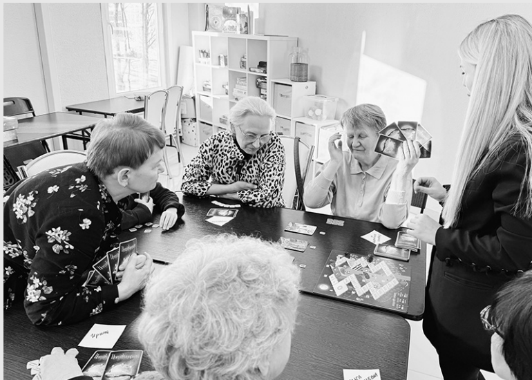
«Теперь скучно не будет!»