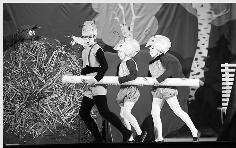
Фрагмент спектакля в исполнении детского театра «Бабушкин сундучок»