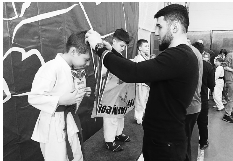
На пьедестале почёта наши рукопашники

Организаторами масштабных соревнований выступили комитет по физической культуре и спорту