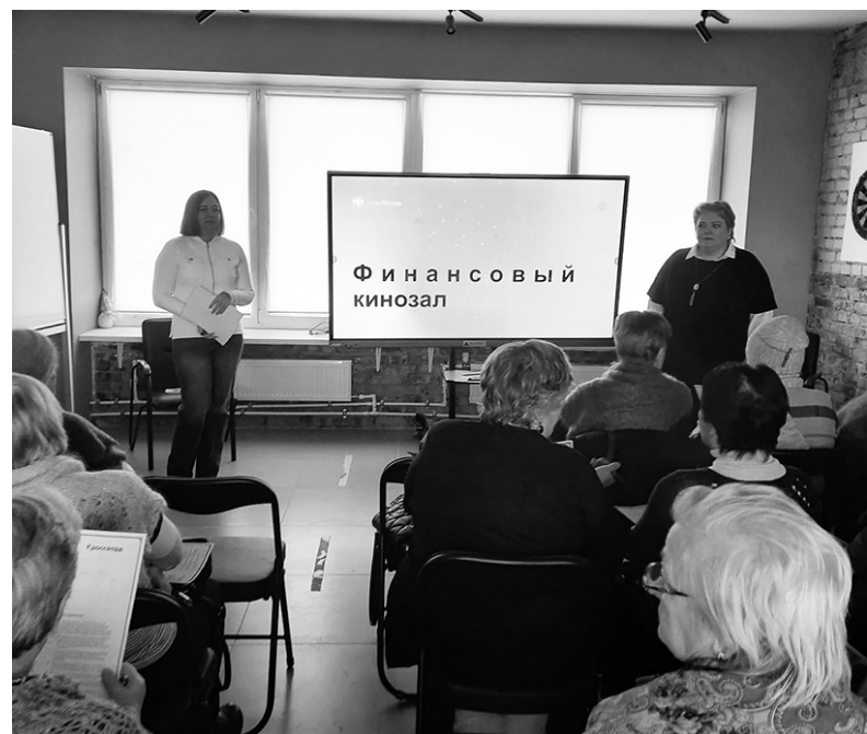
Во время интерактивной лекции в «Кредо»

По материалам сообщества ВК «Основы финансовой грамотности»