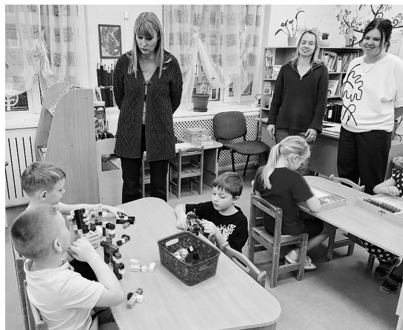
Светлана Журова знакомится с воспитанниками д/с «Сказка»