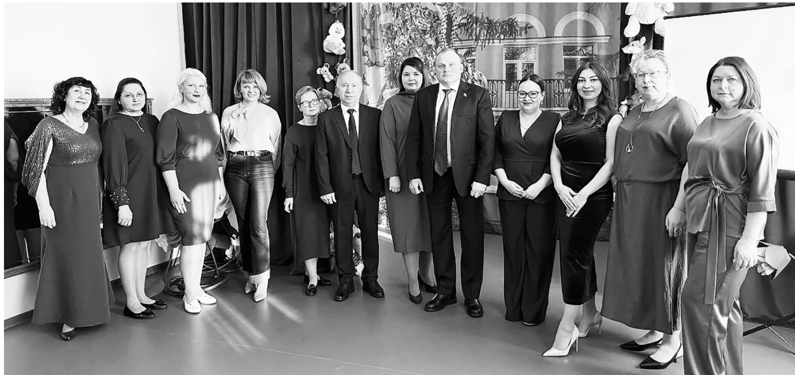
Церемония награждения лучших работников детского сада «Берёзка»