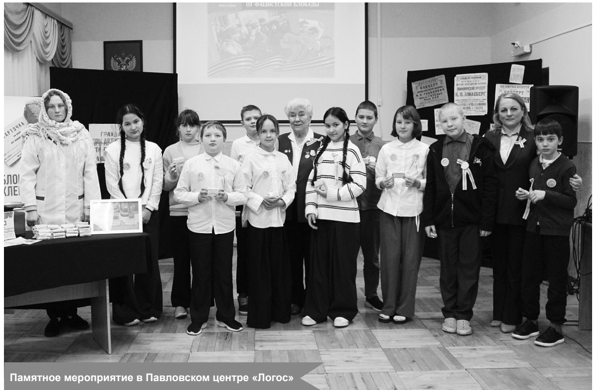
Памятное мероприятие в Павловском центре «Логос»

По материалам Дома культуры посёлка Павлово