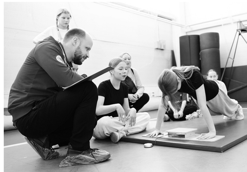
Работает Центр тестирования Кировского района

По итогам фестиваля всем участникам после обработки протоколов будут присвоены заслуженные знаки отличия – золотые, серебряные или бронзовые. Фестиваль в очередной раз показал, что ГТО объединяет, мотивирует и воспитывает в молодёжи ценности здорового и активного образа жизни.