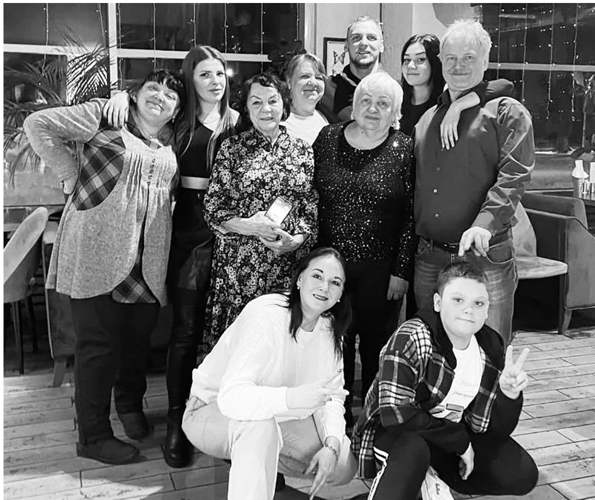
На семейном мероприятии