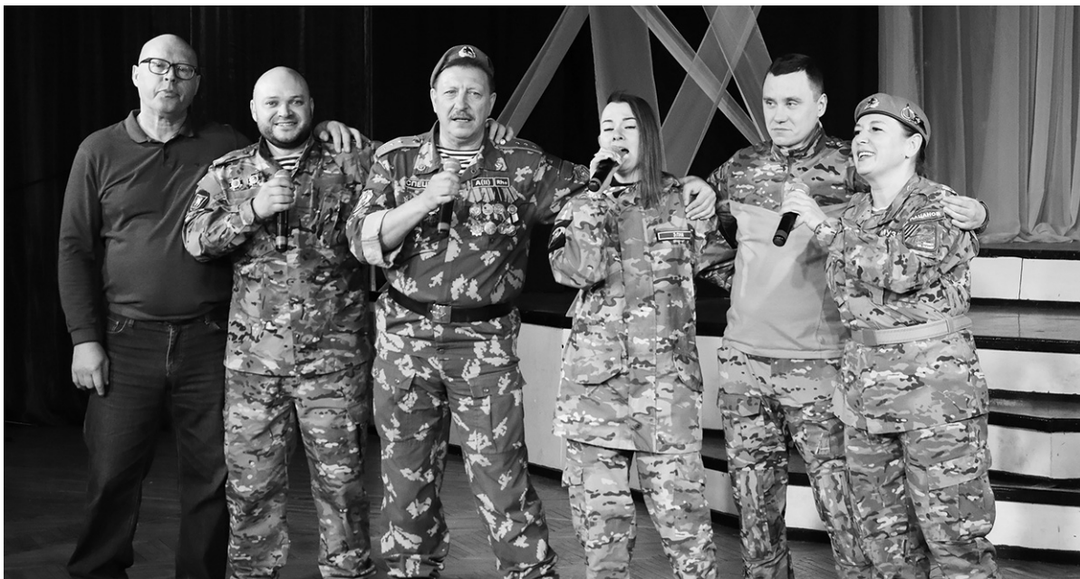
Фрагмент выступления артистов со сцены КСЦ «Назия»