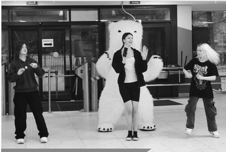
Интерактив в компании весёлого Мишки