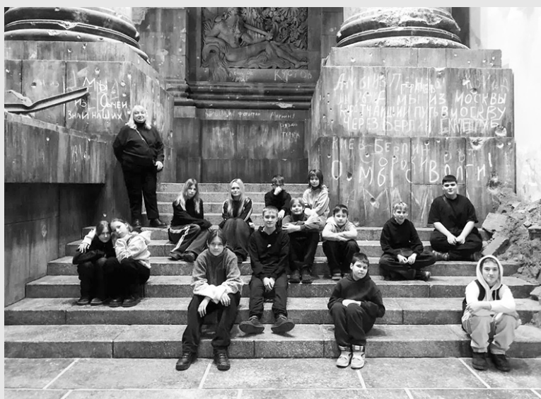
Учащиеся Кировской школы № 1