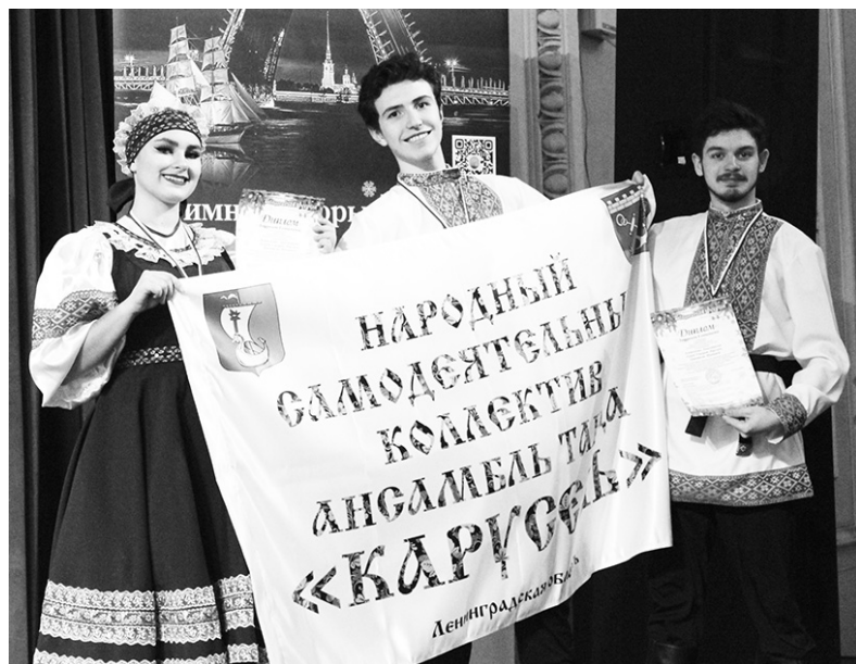
Ансамбль «Карусель» ДК п. Павлово

Народный самодеятельный коллектив – ансамбль танца «Карусель» Дома культуры посёлка Павлово – с триумфом выступил на Международном фестивале «Волшебная феерия» в Санкт-Петербурге. Наши земляки показали высший класс, завоевав все главные награды и восторженные аплодисменты столичной публики.