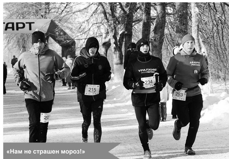
«Нам не страшен мороз!»

Все участники забега получили памятные медали, символизирующие личный вклад в сохранение исторической памяти. Призеры в своих возрастных категориях были награждены грамотами и медалями, а каж-