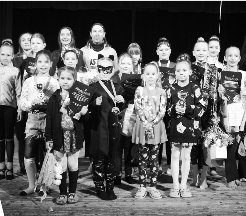
Победители и призёры конкурса акробаток на гамаках в Кировске