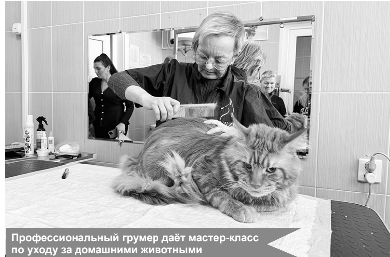
Профессиональный грумер даёт мастер-класс по уходу за домашними животными