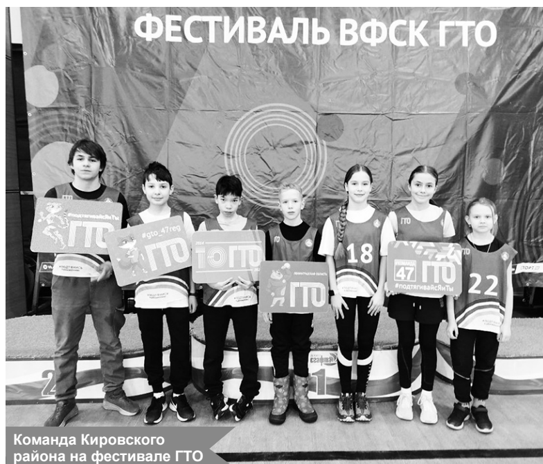
Команда Кировского района на фестивале ГТО

Команда Кировского района достойно представила муниципалитет на зимнем фестивале Всероссийского физкультурно-спортивного комплекса «Готов к труду и обороне» среди обучающихся. Соревнования прошли 27 января в посёлке Токсово.