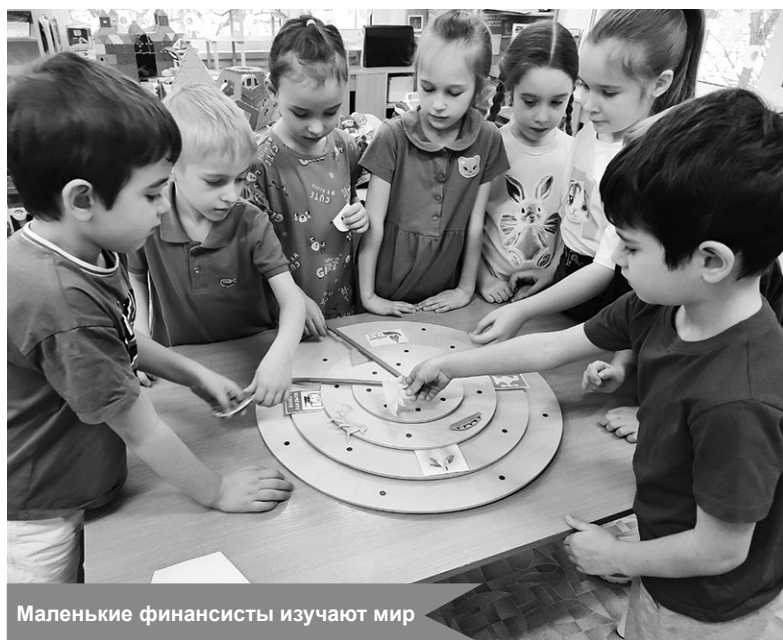
Маленькие финансисты изучают мир

По материалам детского сада № 37 «Ягодка»