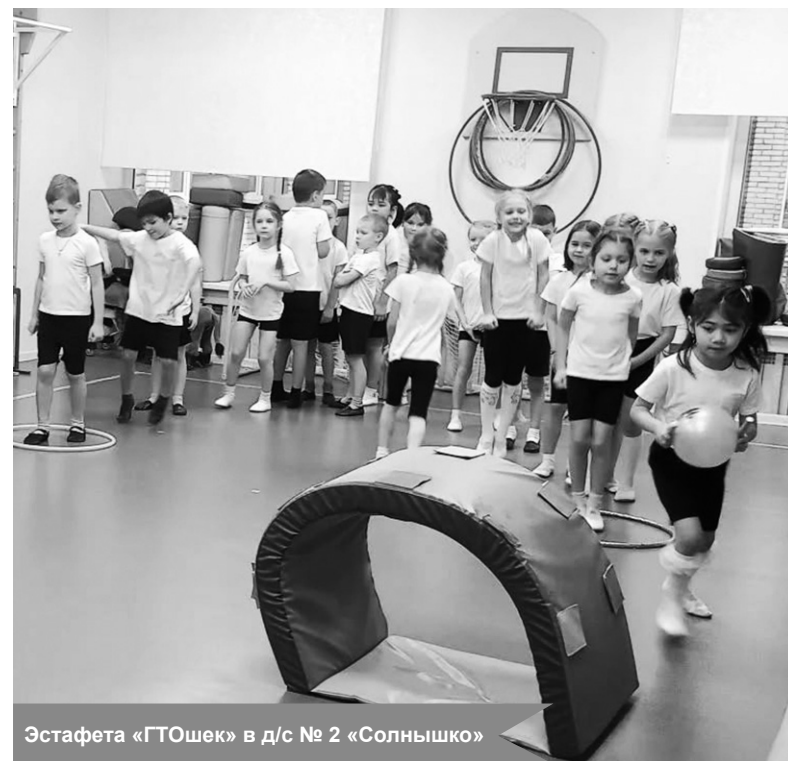
Эстафета «ГТОшек» в д/с № 2 «Солнышко»

По материалам детского сада № 2 «Солнышко»