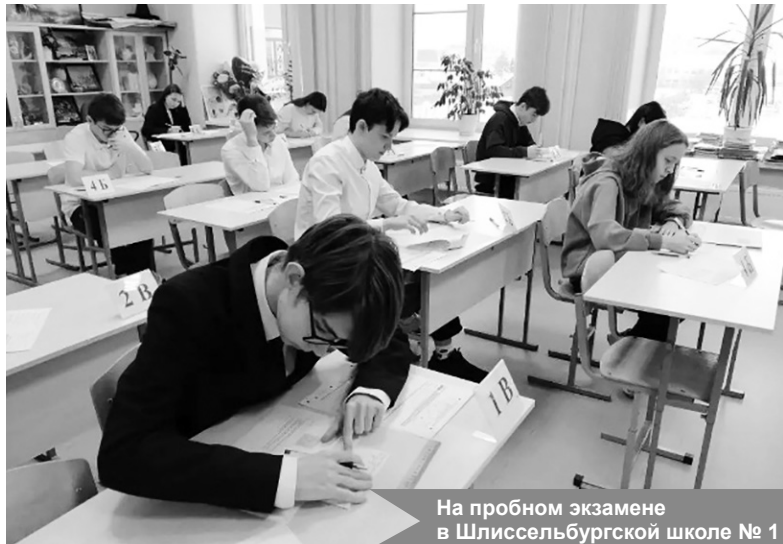
На пробном экзамене в Шлиссельбургской школе № 1

28 января для 967 учеников девятых классов из всех школ Кировского муниципального района учебный процесс сменился серьёзным испытанием. В этот день прошёл масштабный региональный репетиционный экзамен по математике, максимально приближенный к реальным условиям Основного государственного экзамена (ОГЭ).