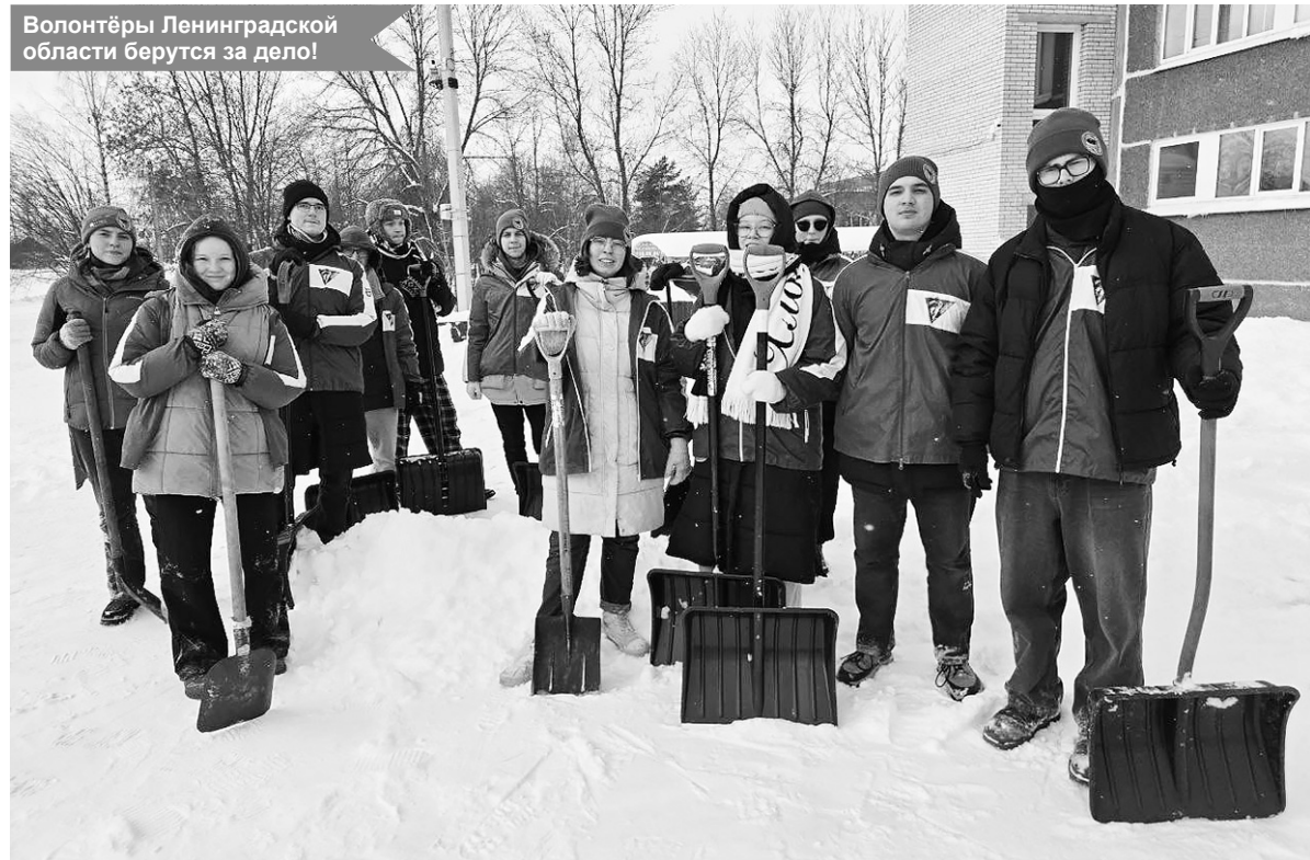
Волонтеры Ленинградской области берутся за дело!