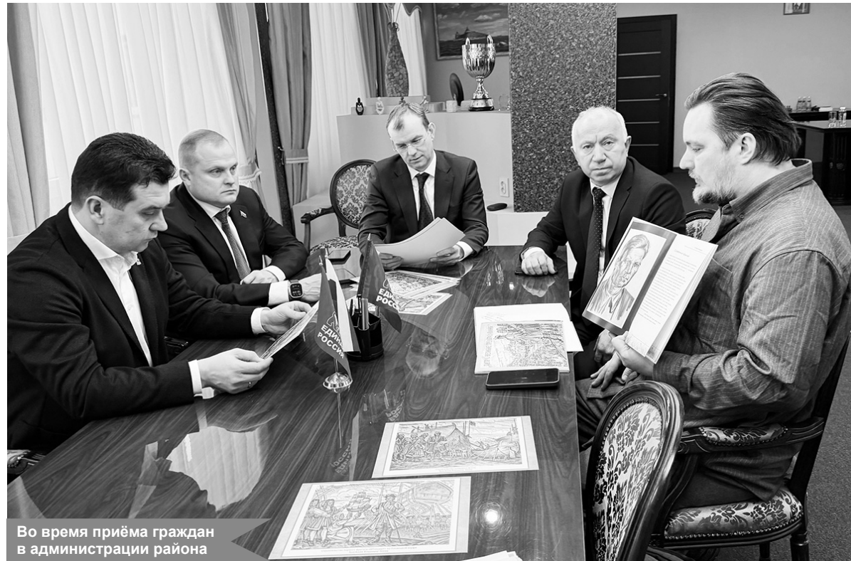
Во время приёма граждан в администрации района