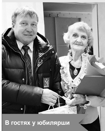
В гостях у юбилярши