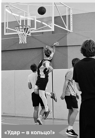
«Удар – в кольцо!»

По материалам отдела по делам молодёжи, ФКиС КМР ЛО