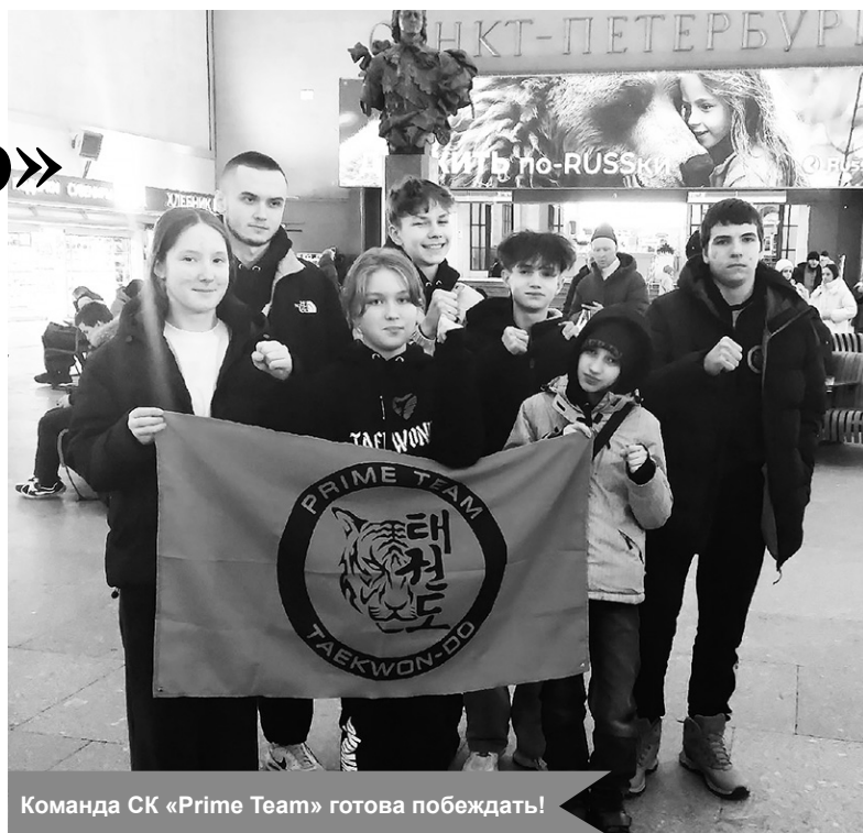
Команда СК «Prime Team» готова побеждать!