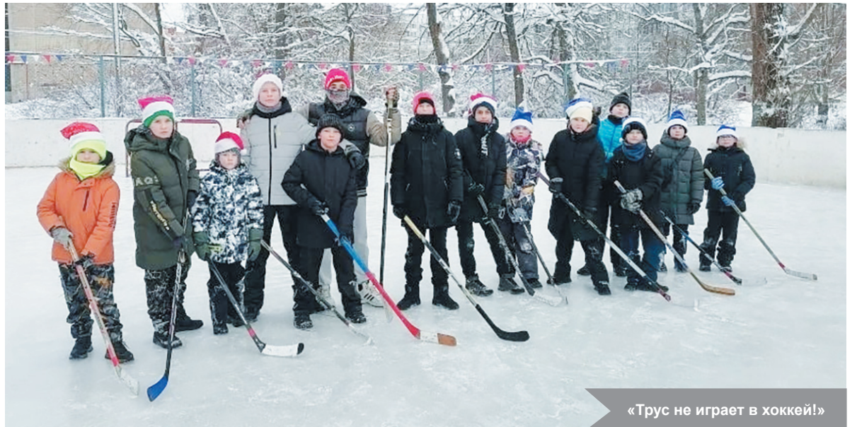
«Трус не играет в хоккей!»

Инициатива школы наглядно показывает, что для зимней активности и спортивного духа нужны лишь хорошая компания, позитивный настрой и, конечно, подходящая обувь. Остаётся пожелать юным хоккеистам не терять этот задор и продолжать открывать для себя радость движения и командной игры.