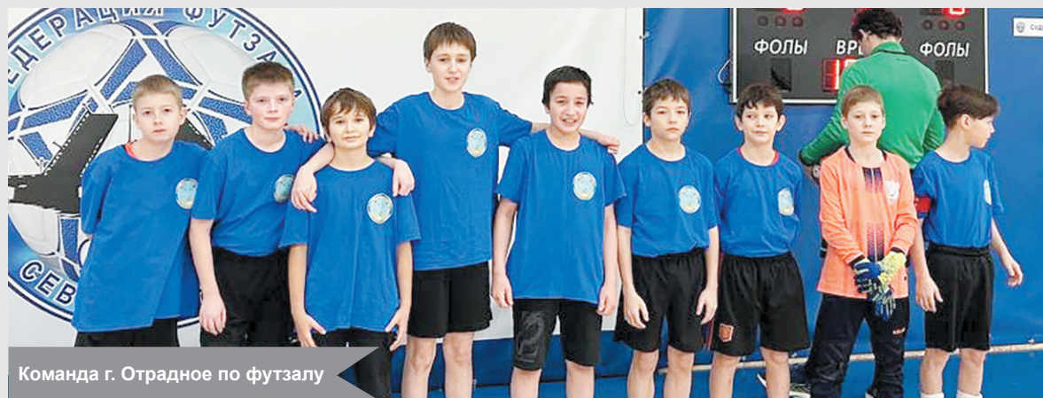
Команда г. Отрадное по футзалу

Команда Отрадненской школы № 2 одержала победу на региональном этапе всероссийских соревнований по футзалу «Кожаный мяч – Школьная футбольная лига». В зоне «Восток» наши юные спортсмены заняли первое место, продемонстрировав волю к победе и отличную подготовку.