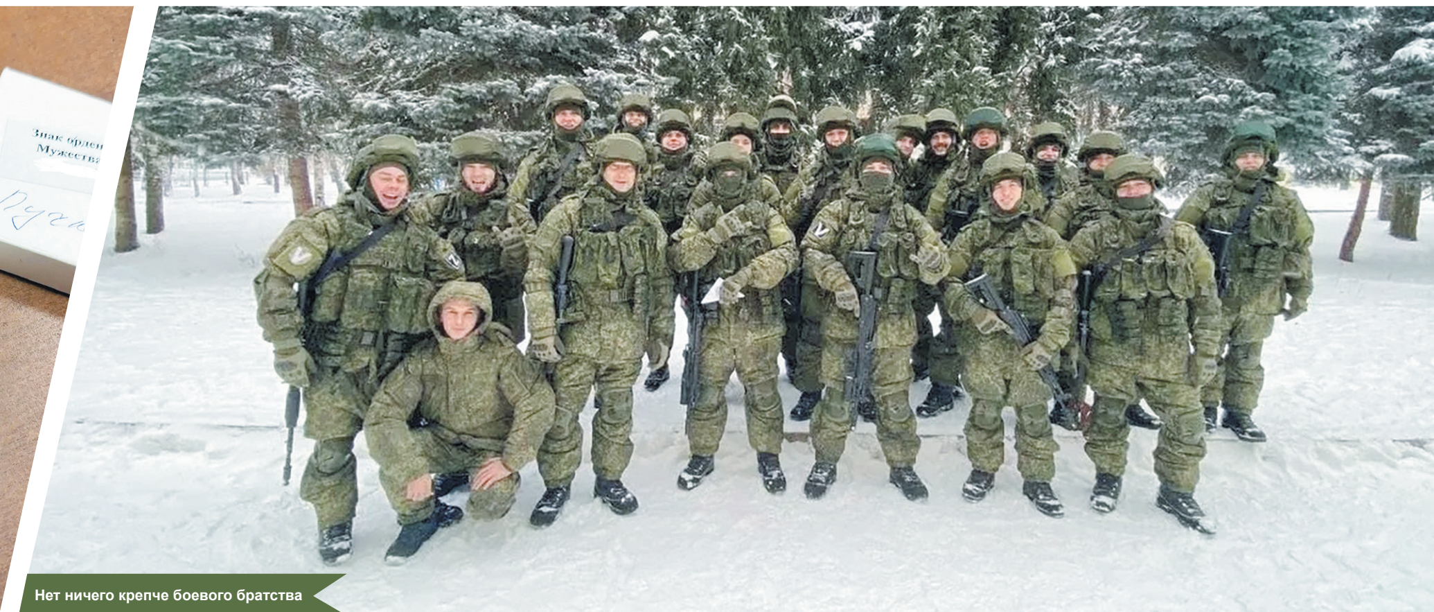
Нет ничего крепче боевого братства