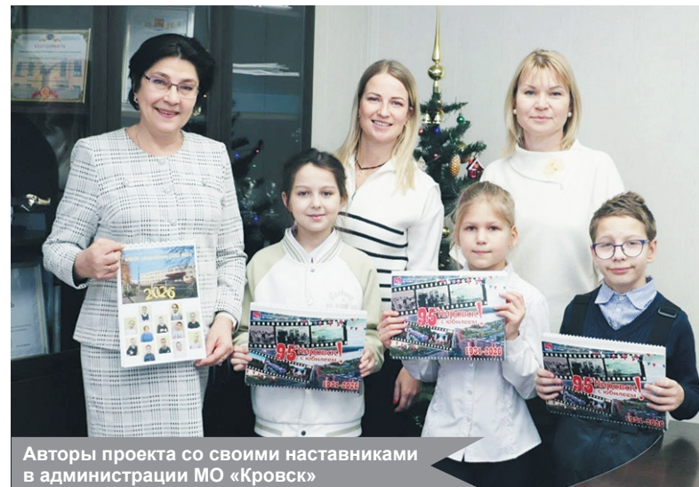
Авторы проекта со своими наставниками в администрации МО «Кировск»

Этот проект – удачный пример синтеза учебы, творчества, патриотического воспитания и социальной активности. Дети получили бесценный опыт, а их труд, оцененный уважаемыми людьми города, станет предметом законной гордости на весь предстоящий год.