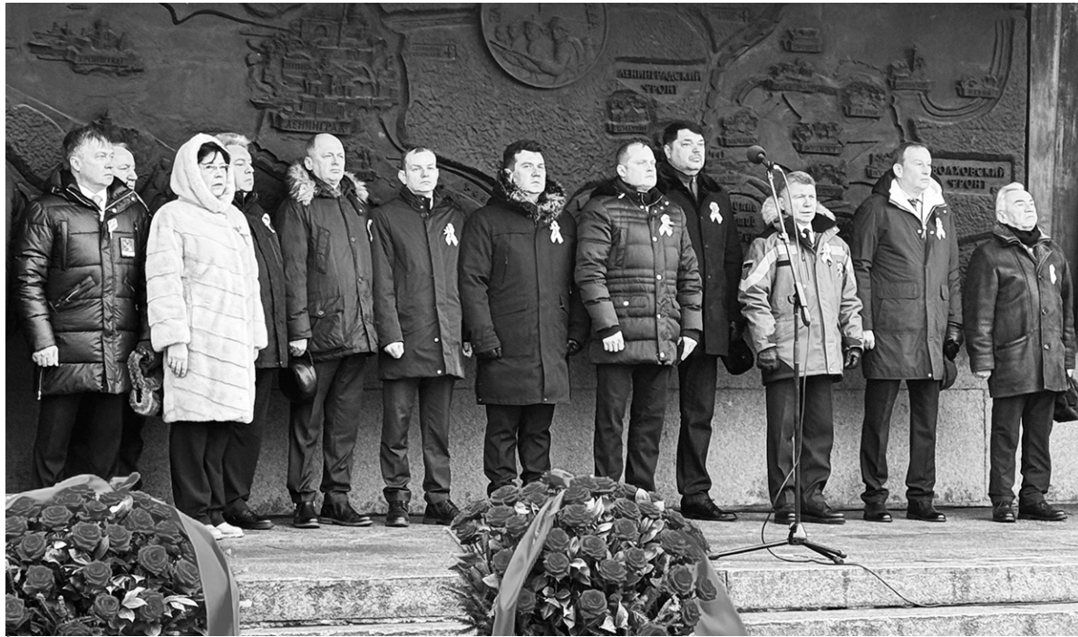
Участники торжественно-траурного митинга у стен «Прорыва»

18 января наша страна отмечает 83-ю годовщину прорыва фашистской блокады Ленинграда. В эти январские дни мы вспоминаем о людях, погибших в блокадном городе, и его защитниках, которые смогли прорвать кольцо осады.