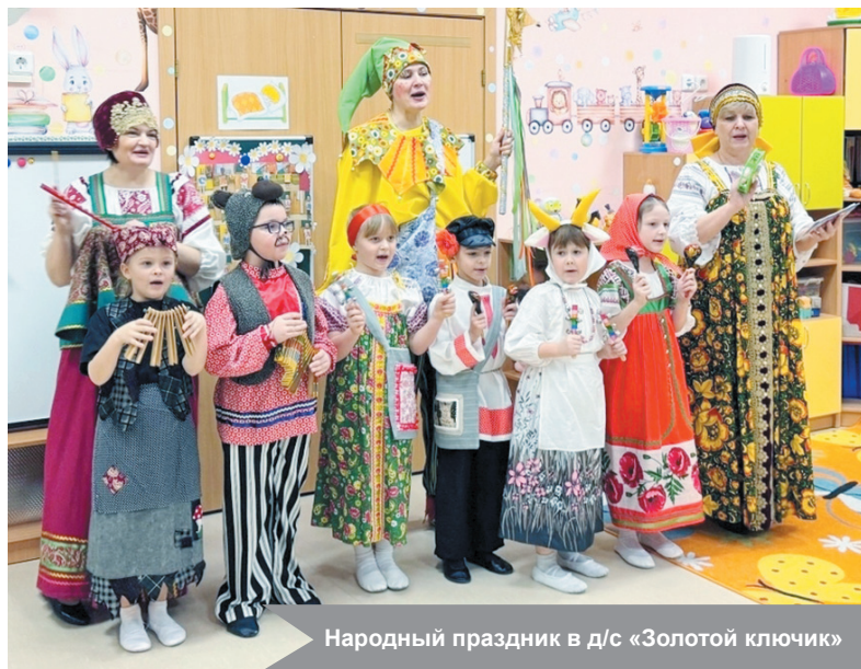
Народный праздник в д/с «Золотой ключик»

Традиционный народный праздник – рождественские колядки – с размахом отметили в детском саду «Золотой ключик». Мероприятие объединило воспитанников всех возрастов и сотрудников учреждения, подарив всем участникам яркие эмоции и погружение в старинные обычаи.