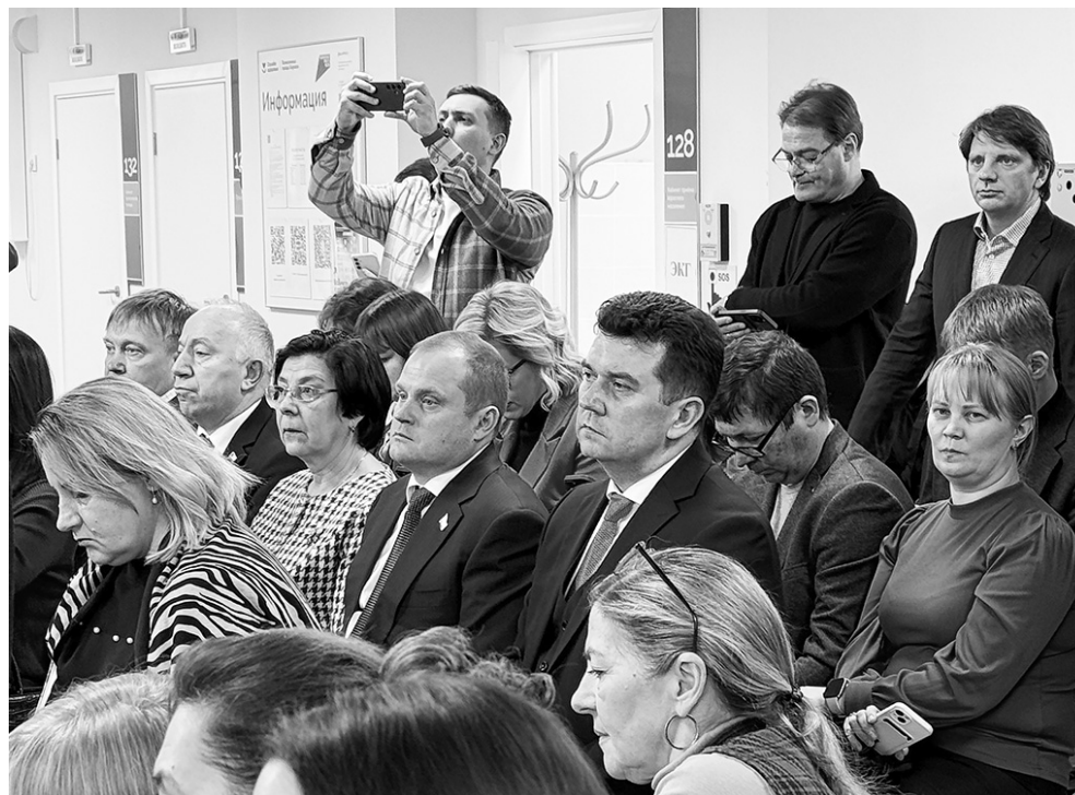
На итоговой конференции с главой 47 региона