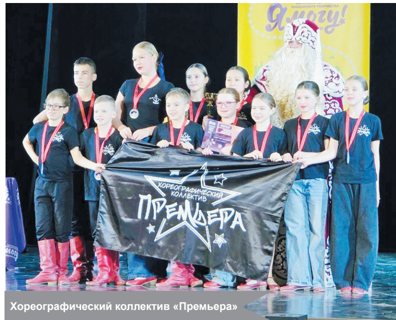
Хореографический коллектив «Премьера»

По материалам хореографического коллектива «Премьера»