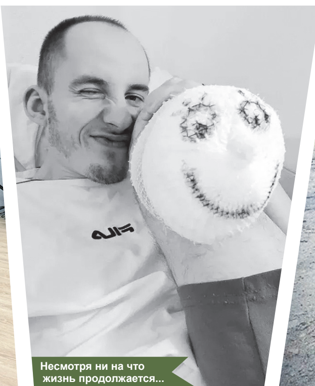
Несмотря ни на что жизнь продолжается...