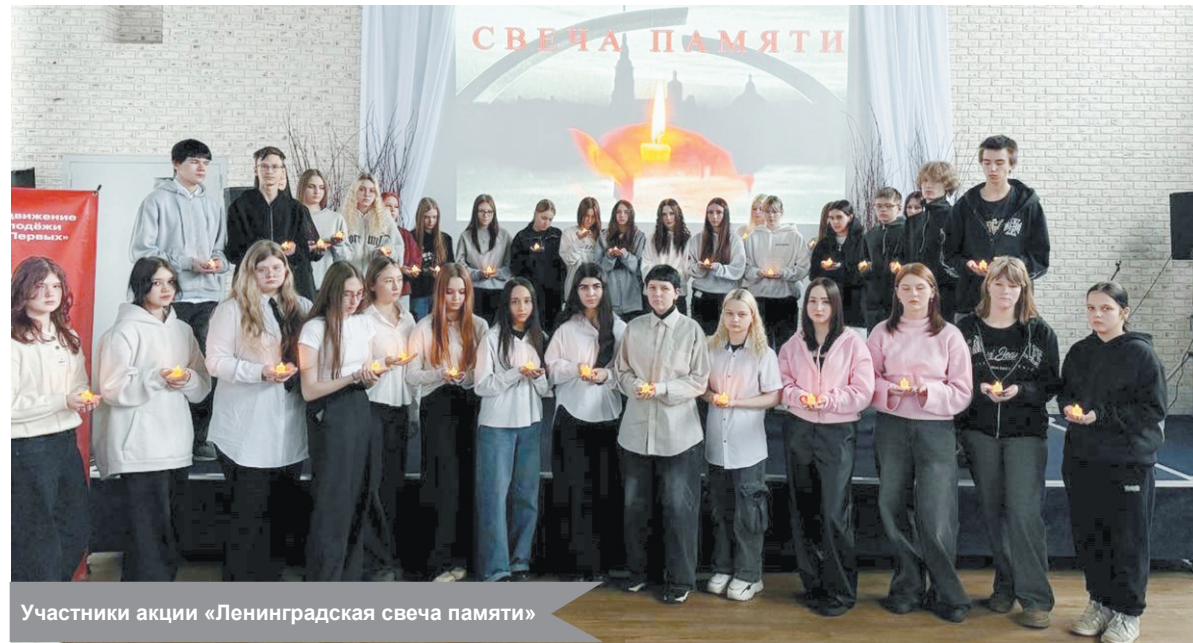
Участники акции «Ленинградская свеча памяти»

Студенты Кировского политехнического техникума присоединились к ежегодной акции «Ленинградская свеча памяти», чтобы почтить память героев и жертв Великой Отечественной войны.