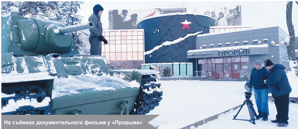
На съёмках документального фильма у «Прорыва»

По материалам музея-заповедника «Прорыв блокады Ленинграда»