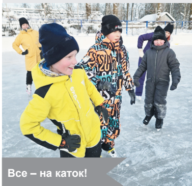
Все – на каток!