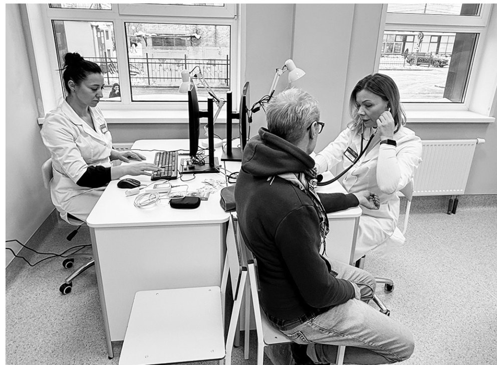
На приёме у специалистов