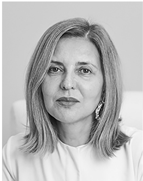
Ольга Ткачёва, профессор, член-корреспондент РАН, директор Российского геронтологического научно-клинического центра Пироговского университета

После праздников важно дать организму плавно перестроиться. Здоровье и хорошее самочувствие всегда важнее скорости на весах. Доверяйте своему организму, действуйте разумно и поддерживайте себя на пути к цели [47]