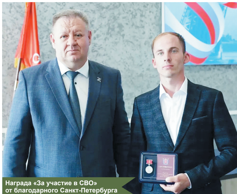
Награда «За участие в СВО» от благодарного Санкт-Петербурга

Мы прошли серьезную двухмесячную подготовку в Псковской области: изучали военное дело, практиковались, проходили бое-