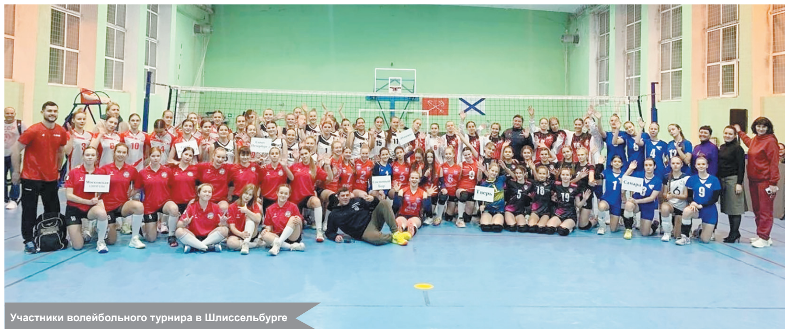
Участники волейбольного турнира в Шлиссельбурге

8 января в спортивном зале КСК «Невский» города Шлиссельбурга состоялось торжественное открытие Международного волейбольного турнира «КВАЗАР».