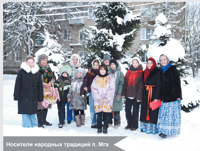
Носители народных традиций п. Мга