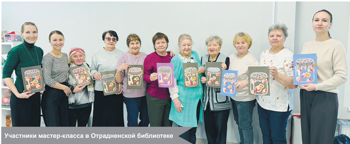
Участники мастер-класса в Отраденской библиотеке

Каждый из начинающих художников представил своё видение сюжета: работы получились