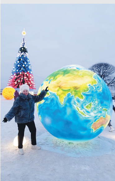
Праздничное убранство Северной столицы

14 января члены литературно-музыкального клуба «Вдохновение» из Культурно-спортивного комплекса «Невский» города Шлиссельбурга совершили яркую и познавательную поездку в Санкт-Петербург. Путешествие подарило участникам массу впечатлений и новый творческий импульс.