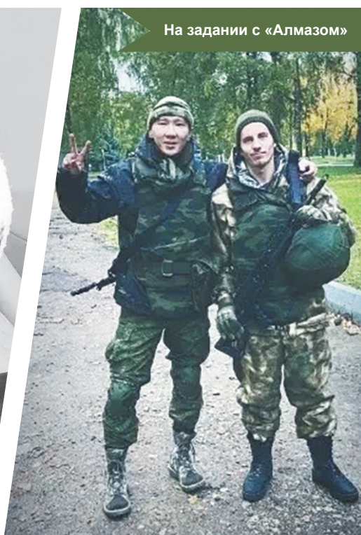
На задании с «Алмазом»