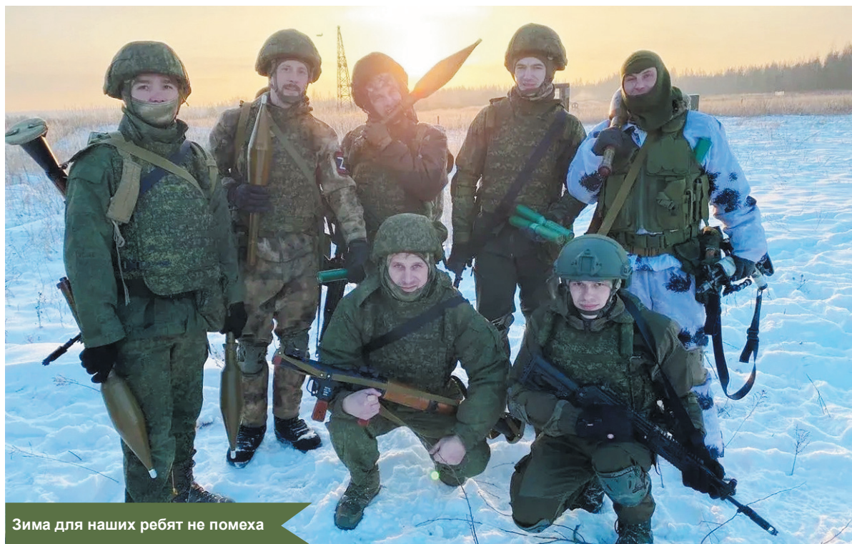
Зима для наших ребят не помеха