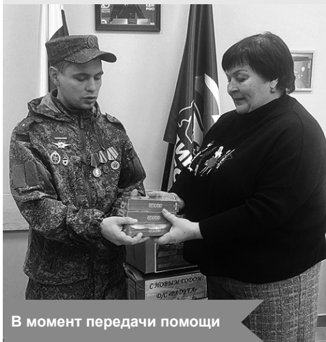
В момент передачи помощи

В общественной приёмной администрации Кировского МР ЛО проведут приём граждан по личным вопросам: