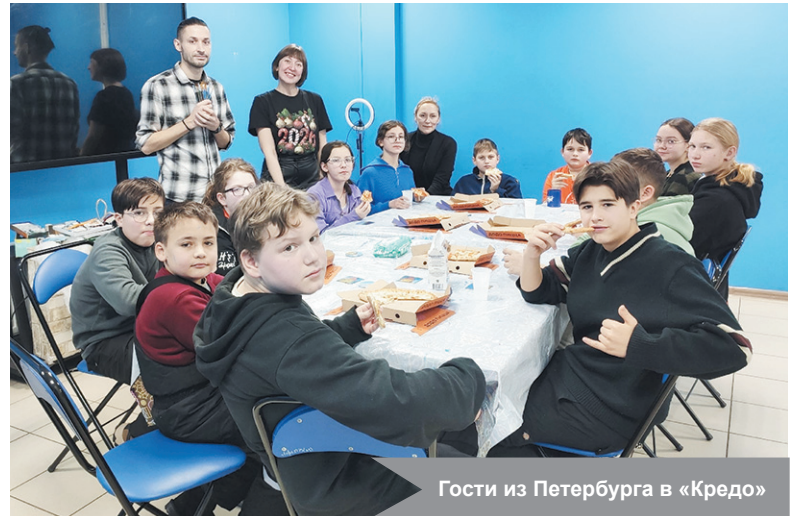
Гости из Петербурга в «Кредо»

По материалам молодёжного коворкинг-центра «Кредо»