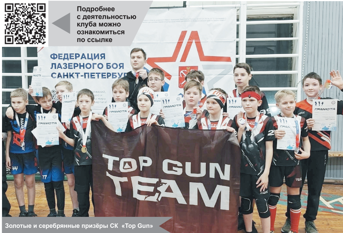
Золотые и серебряные призёры СК «Тор Гун»

Подробнее с деятельностью клуба можно ознакомиться по ссылке