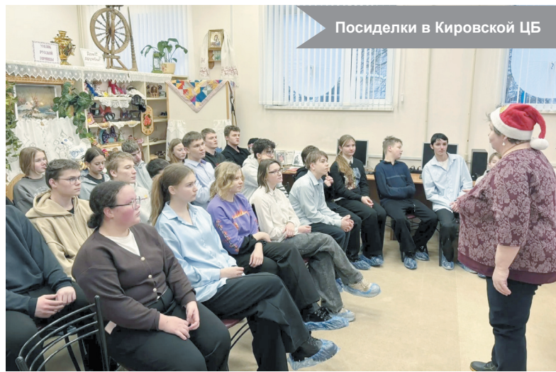
Посиделки в Кировской ЦБ

В канун старого Нового года, 13 января, в «Русской горнице» Кировской центральной библиотеки было особенно оживлённо. Здесь собрались старшеклассники Кировской школы-интерната, чтобы стать участниками тематических посиделок «Снегурочкино царство».