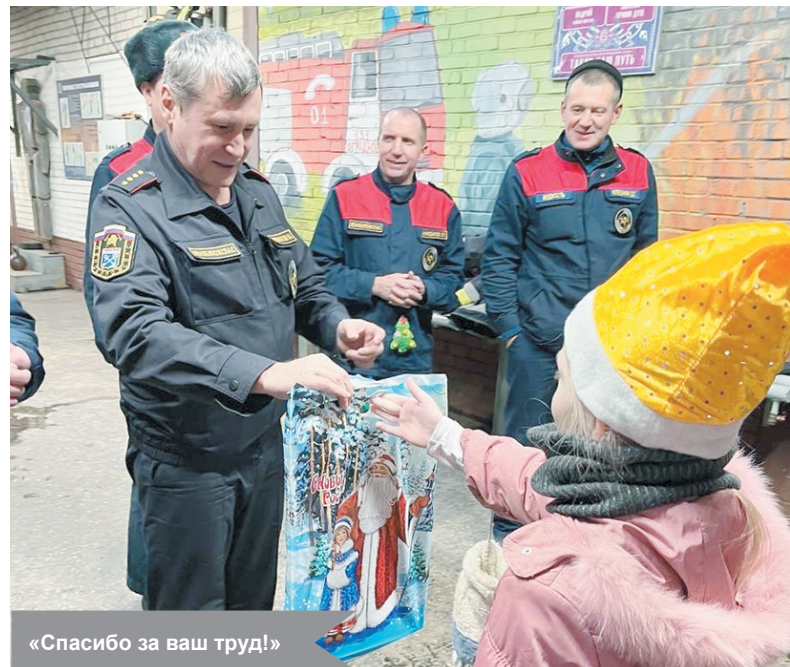
«Спасибо за ваш труд!»

5 января пожарно-спасательную часть № 131 в Отрадном посетили необычные гости – ученики лицея города Отрадное и активисты районного отделения «Движения первых».