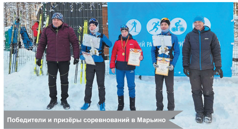
Победители и призёры соревнований в Марьино

— Соревнования прошли в праздничной атмосфере. На следующий год договорились завершить освещение лыжной