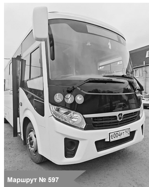
Маршрут № 597