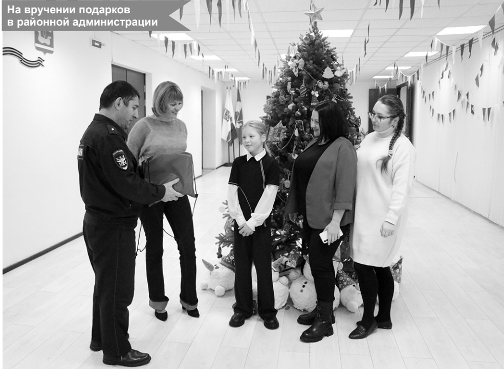
На вручении подарков в районной администрации

закон и попасть в беду. Вы не жалеете сил и личного времени, чтобы помочь детям вырасти достойными людьми.