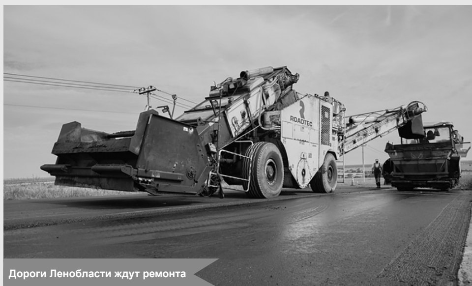
Дороги Ленобласти ждут ремонта

По материалам пресс-службы губернатора и правительства ЛО