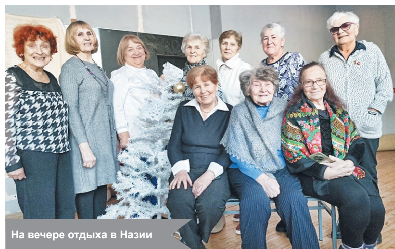
На вечере отдыха в Назии