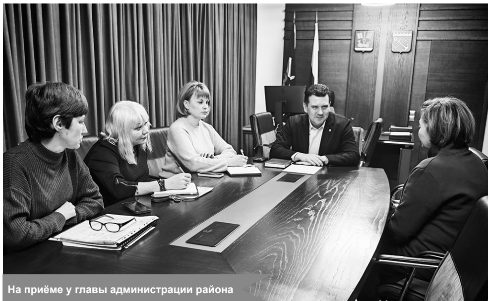
На приёме у главы администрации района

Приём граждан – один из самых открытых и удобных инструментов взаимодействия с жителями. Благодаря личным встречам удаётся получить обратную связь и найти эффективные пути решения актуальных проблем.