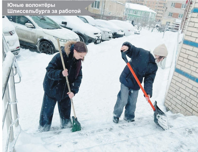
Юные волонтёры Шлиссельбурга за работой

По материалам первичного отделения «Движения Первых» Шлиссельбургской школы № 1