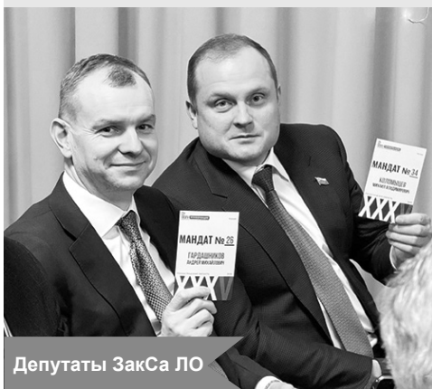
Депутаты ЗакСа ЛО