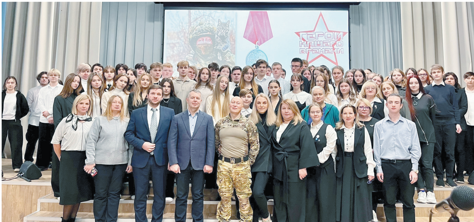
На встрече с учащимися Шлиссельбургской школы № 1

показали себя настоящими мужчинами. Бытует мнение в обществе, или даже страх, что такие бойцы на свободу возвращаться не должны. Но знаете, я хочу сказать, что там, на СВО, они действительно искупили свою вину. Они воюют на сложных направлениях, защищают Родину, проливают кровь. Спасают товарищей и мирных жителей. Именно такие условия раскрывают человека. И, как мне кажется, каждый, кто отстаивал свободу