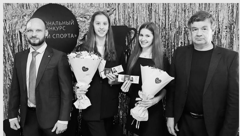
На церемонии награждения в Тихвине