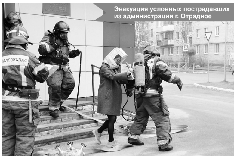
Эвакуация условных пострадавших из администрации г. Отрадное

По материалам администрации МО «Город Отрадное»