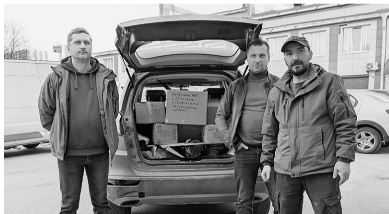
По материалам администрации МО «Город Отрадное»

Спасибо каждому, кто принял участие в сборе гуманитарного груза – вашими стараниями жизнь приграничных областей станет чуточку легче!