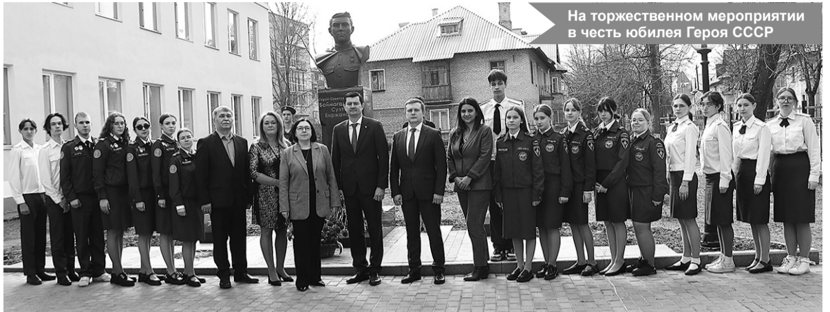
На торжественном мероприятии в честь юбилея Героя СССР

В годы Великой Отечественной войны Султан Баймагамбетов отважно сражался в составе 147-го стрелкового полка Ленинградского фронта. Он командовал пулемётным отделением и участвовал в ожесточённых боях за Синявинские высоты, а также в Мгинской наступательной операции. Его подвиг навсегда вошёл в историю: 25 июля 1943 года, когда наступление советских войск было остановлено вражеским пулемётным дзотом, Султан Баймагамбетов закрыл амбразуру своим телом, обеспечив продвижение своих товарищей. Герой погиб, но его имя стало символом мужества и самопожертвования. Султан Баймагамбетов похоронен в братской могиле на воинском мемориале «Синявинские высоты».