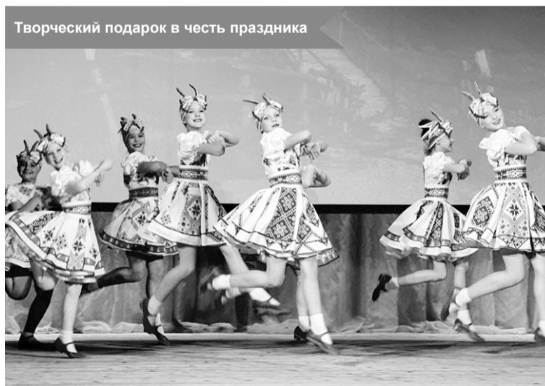
Творческий подарок в честь праздника