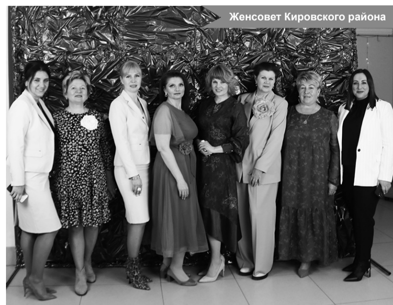
Женсовет Кировского района