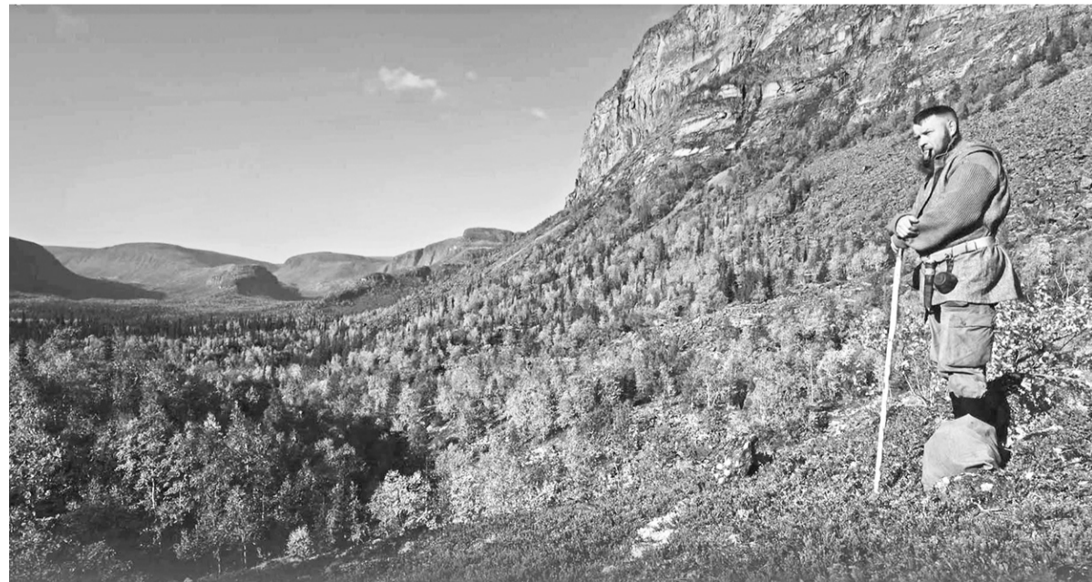
• Фильм «Ушедшие в метель» посвящён теме Великой Отечественной войны (тизер)