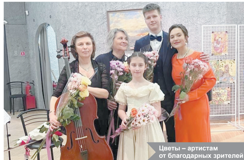
Цветы – артистам от благодарных зрителей

Публика осталась в восторге от концерта, который стал настоящим праздником музыки и таланта.