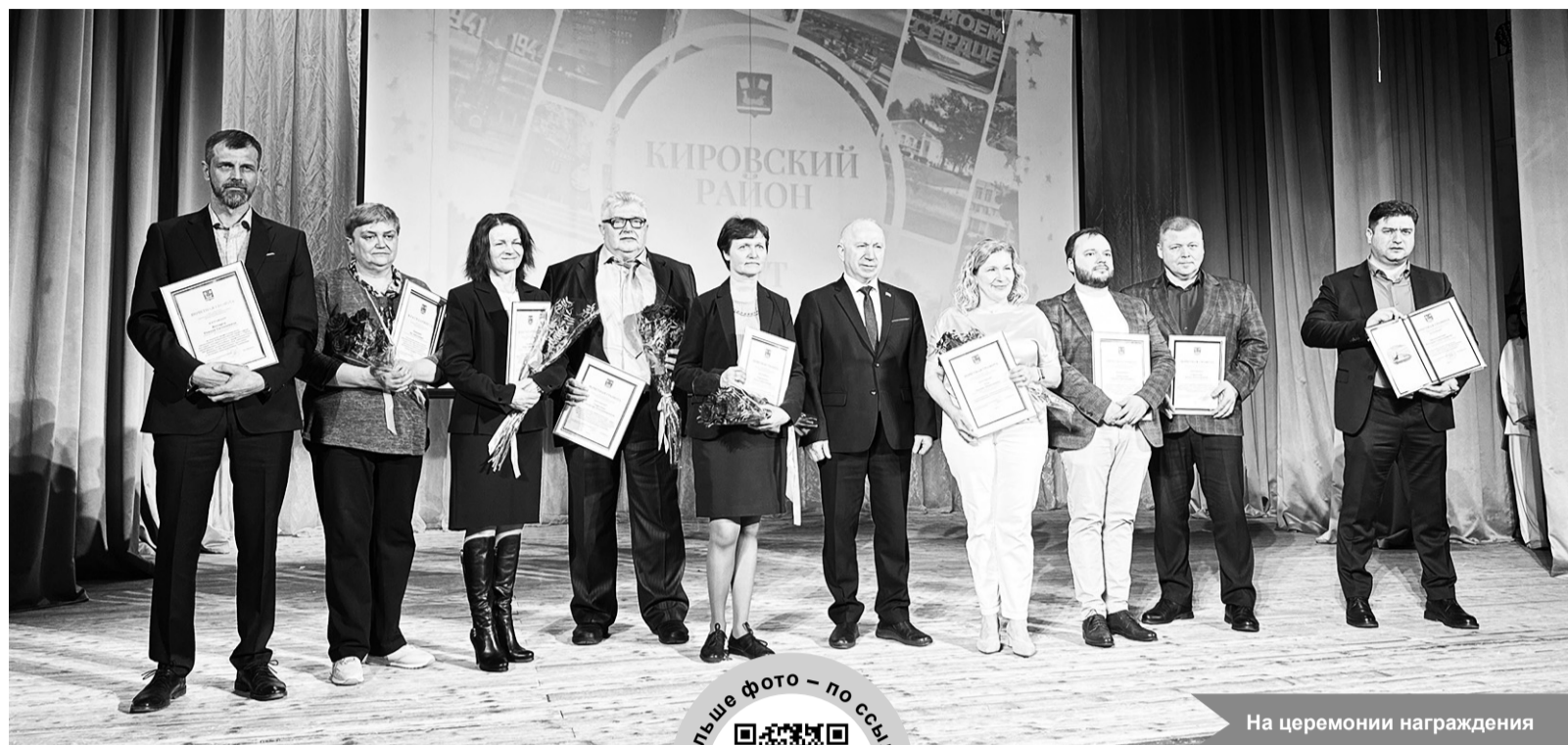
На церемонии награждения