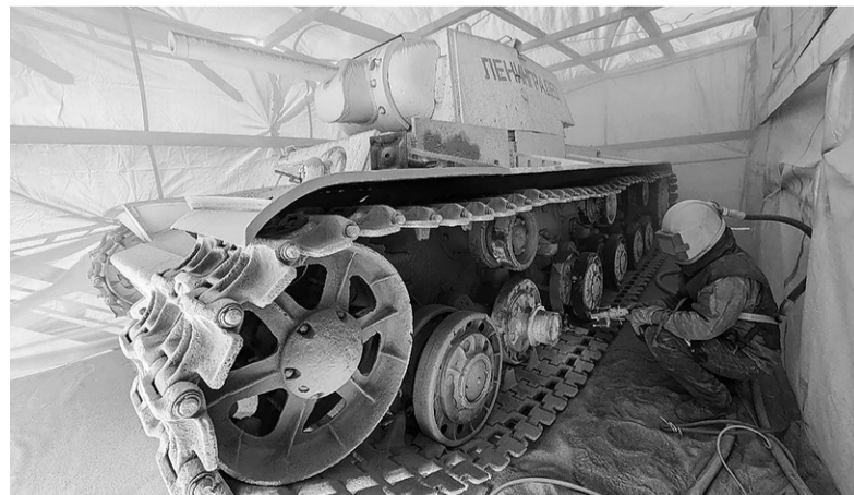
Работы по покраске танков – в самом разгаре

Боевые машины времён Великой Отечественной войны, которые участвовали в боях за Ленинград, обретут обновлённый вид, достойный великого праздника. Это не просто реставрация – это дань уважения героям, сражавшимся за нашу свободу.