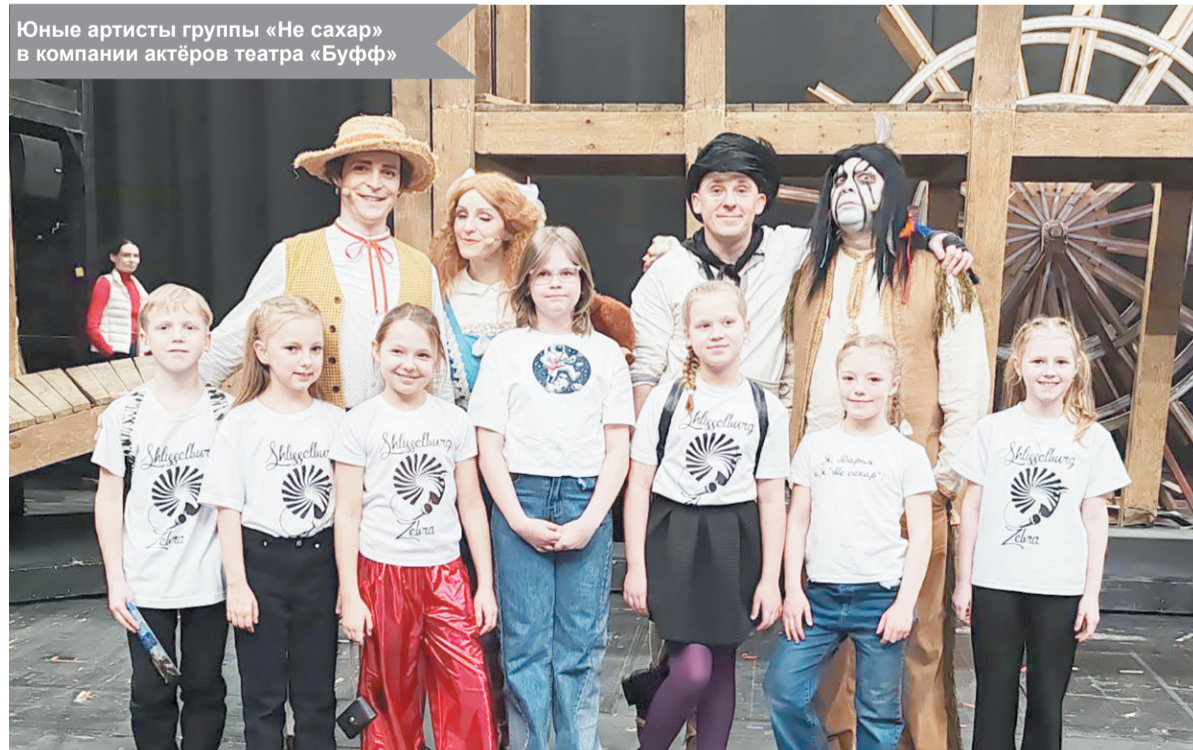
Юные артисты группы «Не сахар» в компании актёров театра «Буфф»