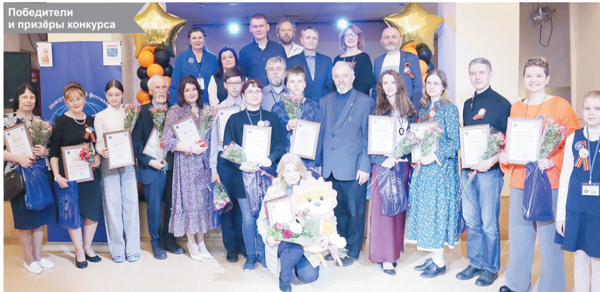
Победители и призёры конкурса