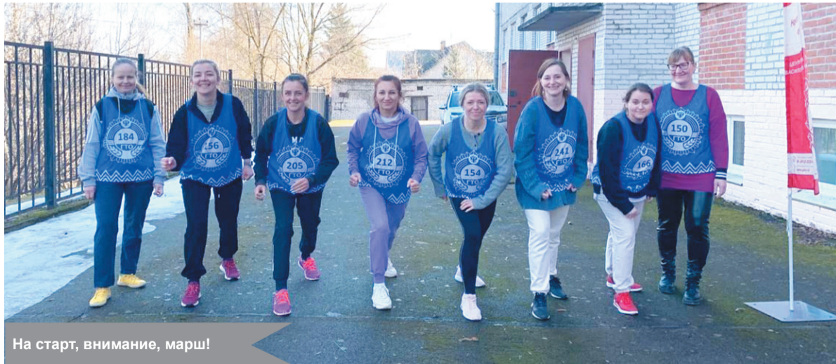
На старт, внимание, марш!

Спорту в «Логосе» уделяют особое внимание: два современных спортзала, площадка с уличными тренажёрами и регулярные мероприятия – от «Зарницы» до семейных стартов «Папа, мама, я – спортивная семья!» – стали частью жизни центра. Второй год подряд организационную поддержку оказы-