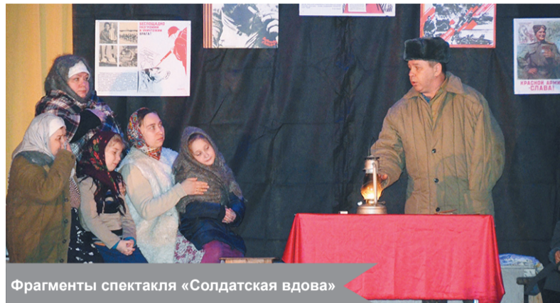
Фрагменты спектакля «Солдатская вдова»