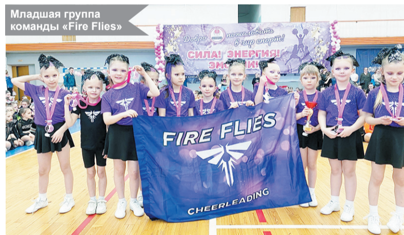
Младшая группа команды «Fire Flies»