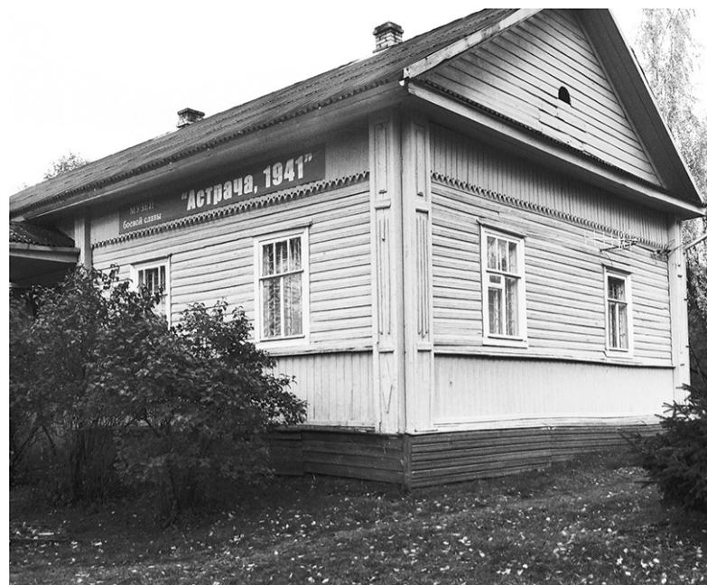
Здание музея «Астрача, 1941»

Впервые в основу музейной композиции положена история двух ребят, которые стали символами всех детей, в чью жизнь вторглась война, полная горя и испытаний.