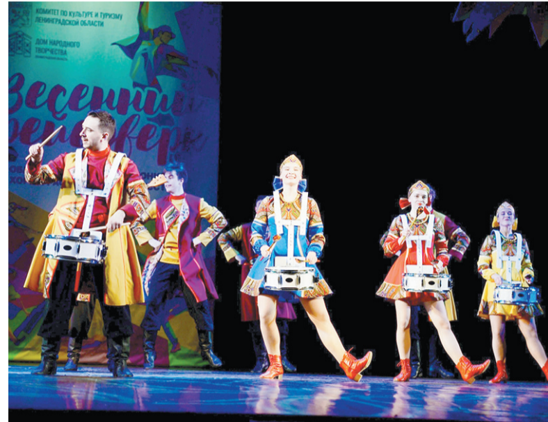
НСК Ансамбль танца «Фейерверк» ДК г. Кировска

По материалам Дворца культуры г. Кировска