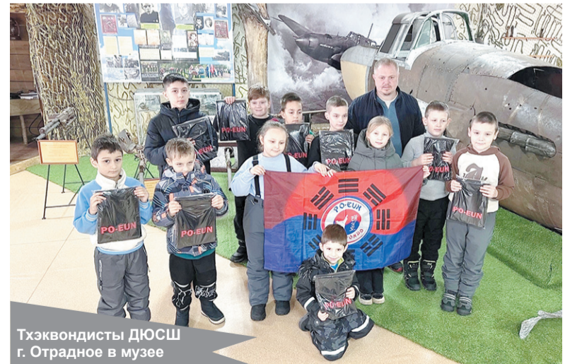
Тхэквондисты ДЮСШ г. Отрадное в музее

Благодарим организатора экскурсии и тренера команды