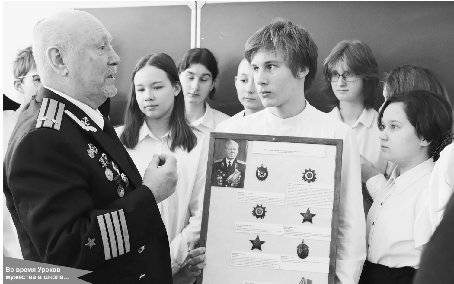
Во время Уроков мужества в школе...

На районное мероприятие, организованное в посёлке Приладожский, при-