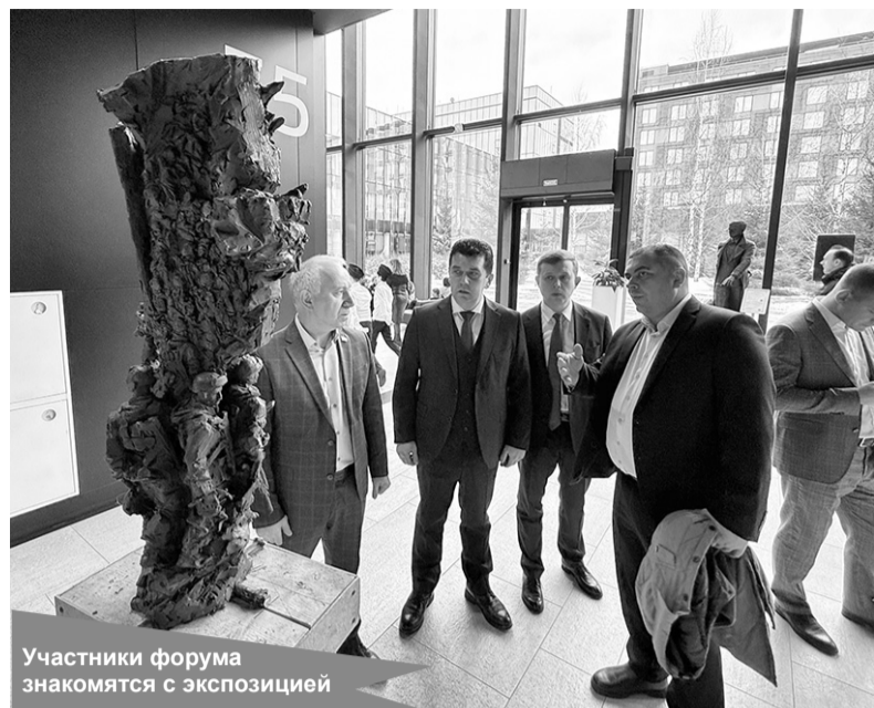
Участники форума знакомятся с экспозицией