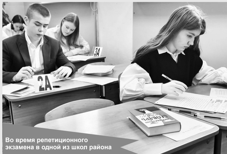
Во время репетиционного экзамена в одной из школ района

25 февраля у обучающихся 9-х классов образовательных организаций Кировского муниципального района состоялся репетиционный экзамен по русскому языку. В пробном госэкзамене приняли участие более тысячи человек.