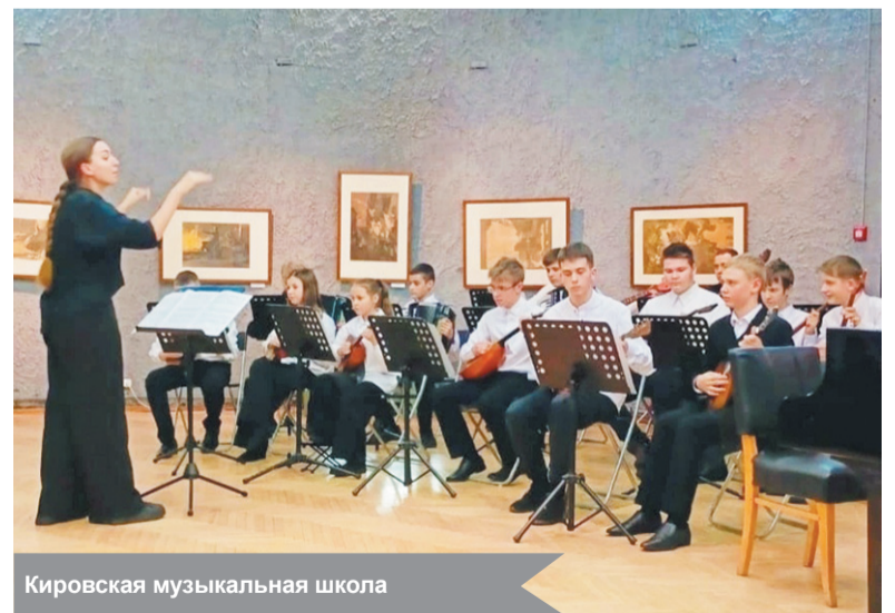
Кировская музыкальная школа

— Такие концерты – не просто праздник для детей и родителей. Это возможность через музыку передать память о подвигах защитников Отечества новому поколе-