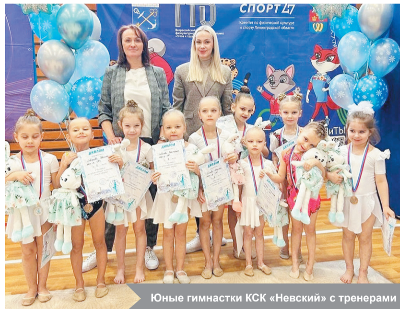
Юные гимнастки КСК «Невский» с тренерами