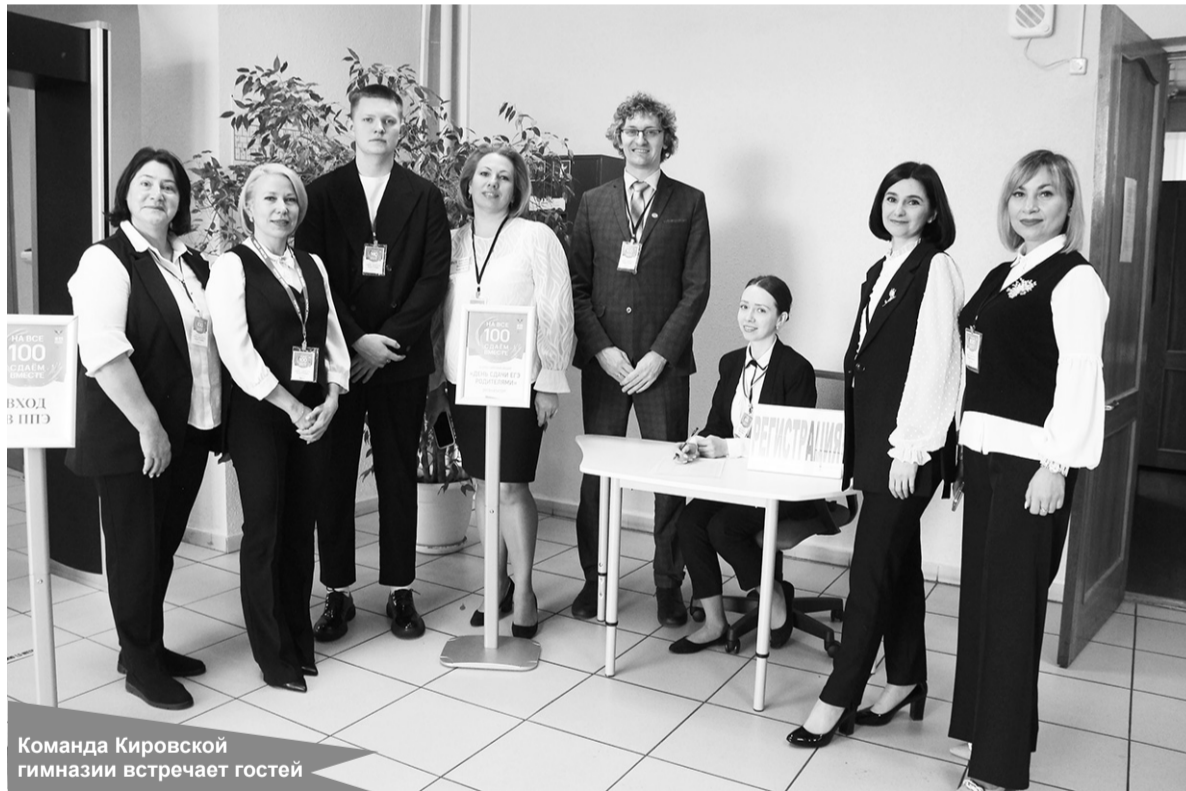
Команда Кировской гимназии встречает гостей

можность пройти всю процедуру ЕГЭ – от регистрации до получения результатов. Родители и приглашённые гости вошли в пункт через металлодетектор, прошли регистрацию на экзамен, предъявили паспорт при входе, а затем в аудитории прошли инструктаж, заполнили бланки и в течение часа написали экзаменационную работу.