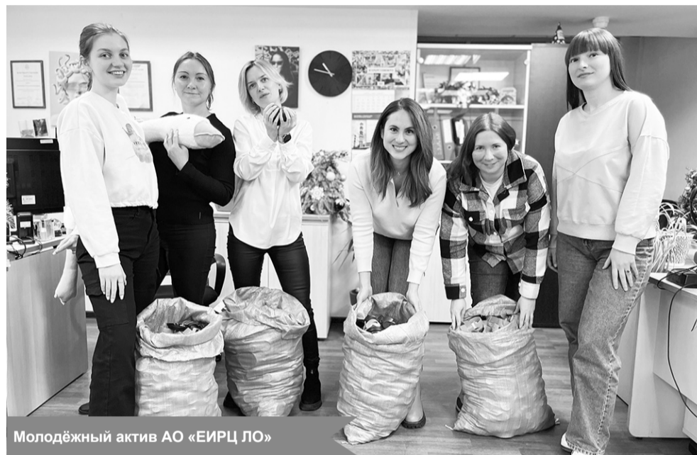
Молодёжный актив АО «ЕИРЦ ЛО»