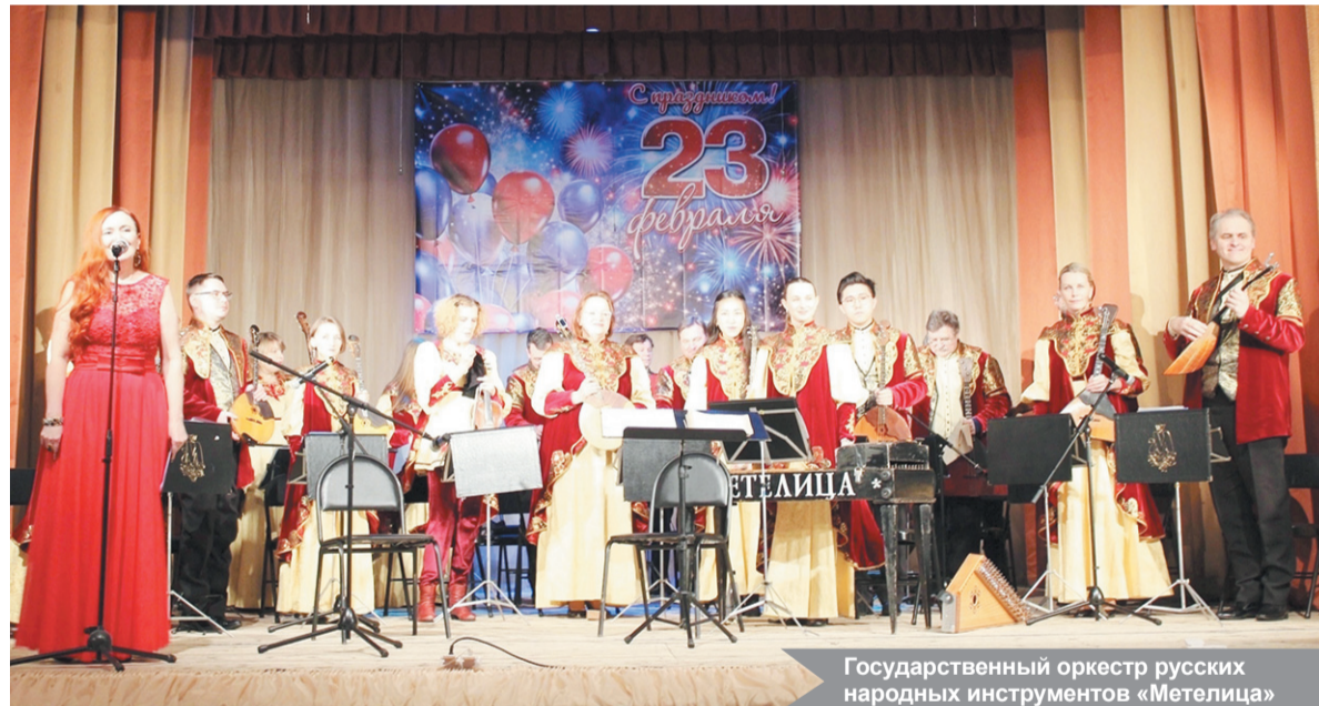
Государственный оркестр русских народных инструментов «Метелица»

Накануне Дня защитника Отечества в Доме культуры посёлка Павлово прошёл праздничный концерт государственного оркестра русских народных инструментов «Метелица». Мероприятие, организованное при поддержке администрации Павловского городского поселения и совета депутатов, собрало жителей, включая семьи участников специальной военной операции (СВО), для которых музыкальный вечер стал символом поддержки и единства.