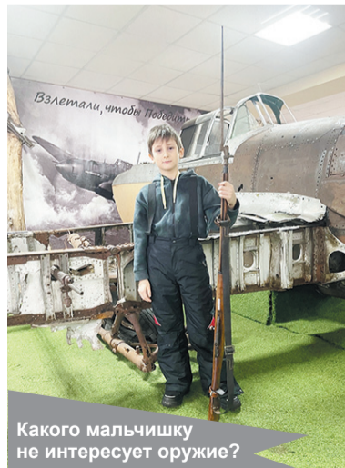
Какого мальчишку не интересует оружие?

Такие мероприятия не только расширяют кругозор, но и воспи-