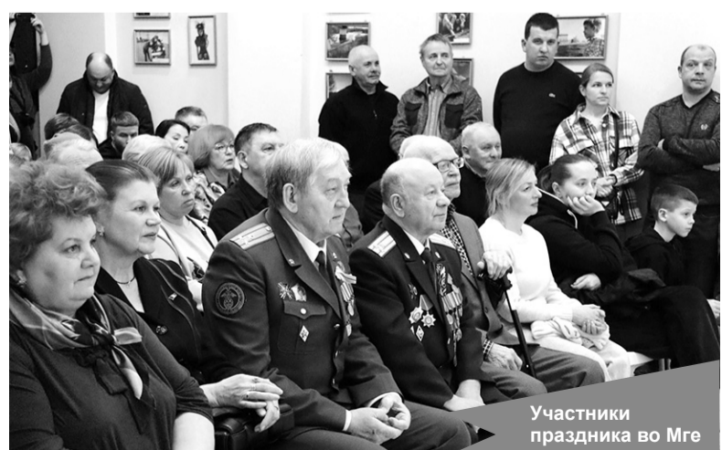
Участники праздника во Мге