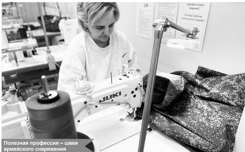
Полезная профессия — швея армейского снаряжения

Пресс-служба губернатора и правительства ЛО