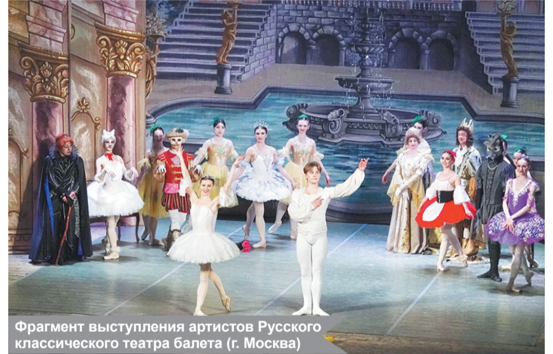
Фрагмент выступления артистов Русского классического театра балета (г. Москва)