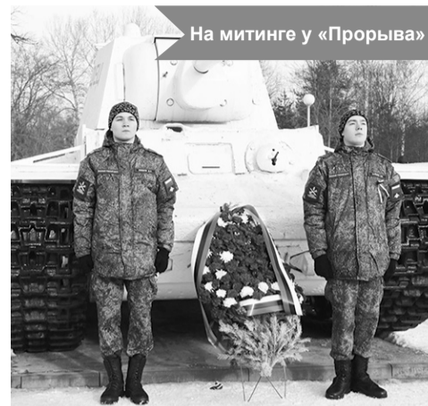
На митинге у «Прорыва»

Праздничные концерты, посвящённые Дню защитника Отечества прошли во всех