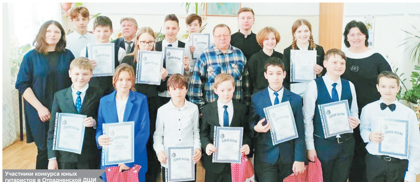
Участники конкурса юных гитаристов в Отрадненской ДШИ