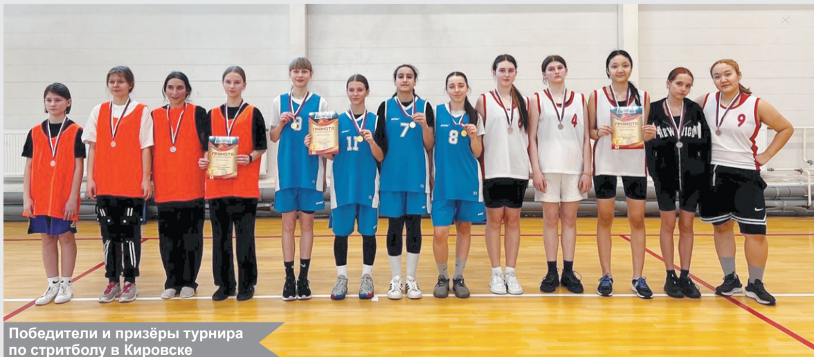
Победители и призёры турнира по стритболу в Кировске

20 февраля в спортивно-зрелищном комплексе г. Кировска в рамках 60-й Спартакиады школьников прошли районные соревнования по стритболу среди девушек 7-х классов. На площадке собрались 45 участниц из 9 общеобразовательных учреждений района, чтобы побороться за звание лучших в динамичной уличной версии баскетбола.