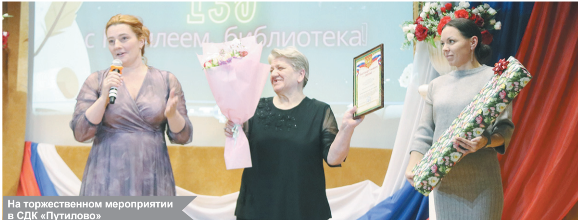
На торжественном мероприятии в СДК «Путилово»