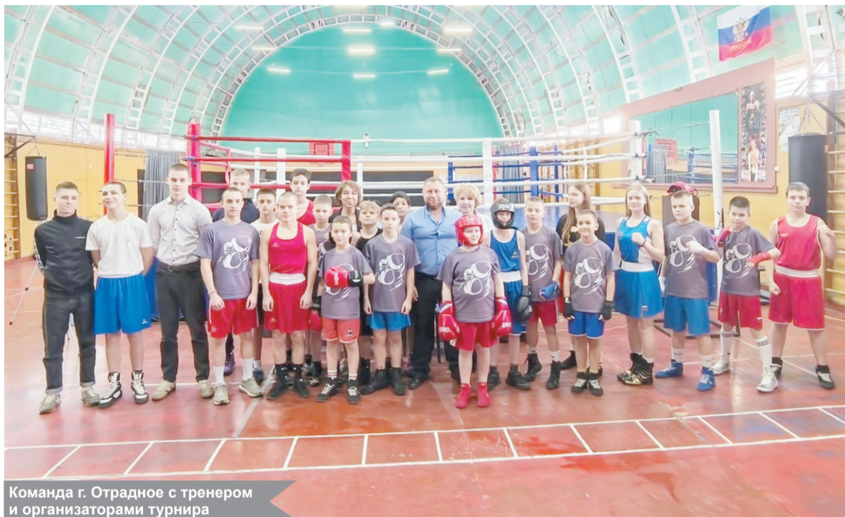
Команда г. Отрадное с тренером и организаторами турнира

22 февраля в городе Отрадном состоялся турнир по боксу, посвящённый Дню защитника Отечества. Соревнования, организованные на базе местной ДЮСШ, собрали юных спортсменов, их наставников и болельщиков, чтобы продемонстрировать силу, технику и боевой дух.