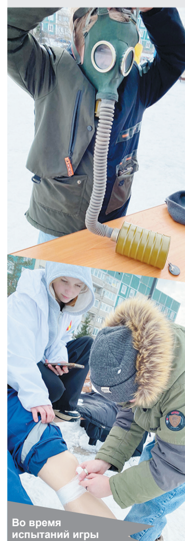
Во время испытаний игры