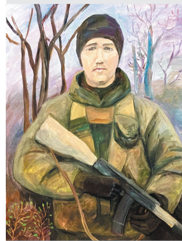
Работа Татьяны Закутасовой