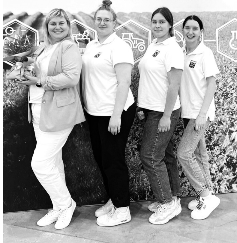
Молодые и перспективные – на пороге новых открытий