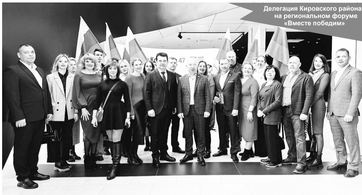
Делегация Кировского района на региональном форуме «Вместе победим»