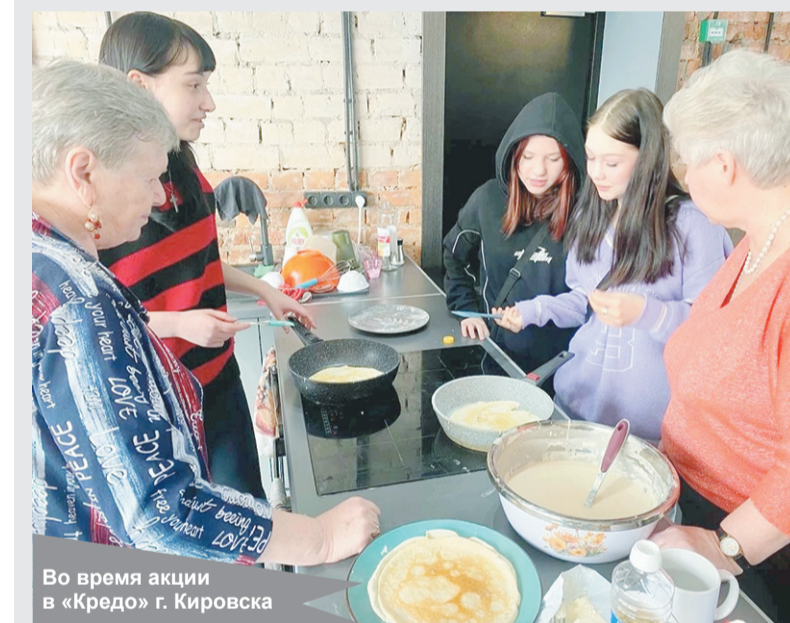
Во время акции в «Кредо» г. Кировска

Фото коворкинг-центра «Кредо» г. Кировска