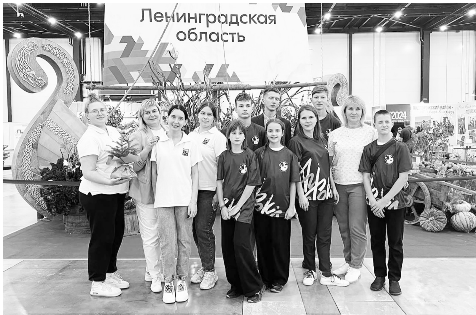
Участники фестиваля профессий «Агрокласс» на форуме в 2024 году

В рамках проекта «Фестиваль аграрных профессий «Агрокласс», планируется провести три конкурсных номинации, квест-игру, выставку «Ярмарка вакансий» с мастер-классами и круглый стол для кураторов агроклассов.