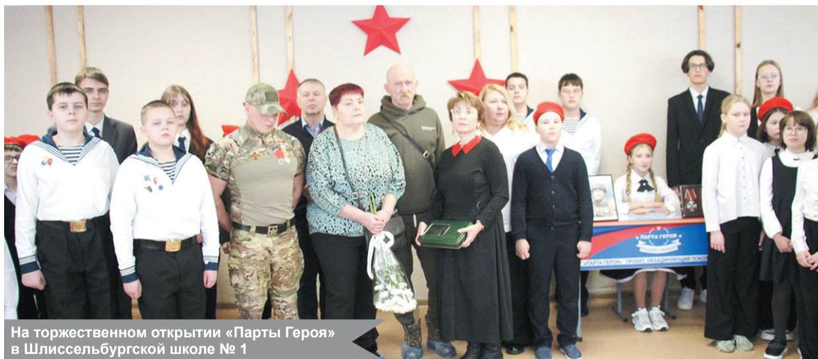
На торжественном открытии «Парты Героя» в Шлиссельбургской школе № 1

Родилась в Шлиссельбурге в 1925 году и прожила здесь всю жизнь. После начала оккупации Шлиссельбурга в сентябре 1941 года переехала в Кобону и работала грузчиком на Дороге жизни. Ей приходилось таскать мешки с