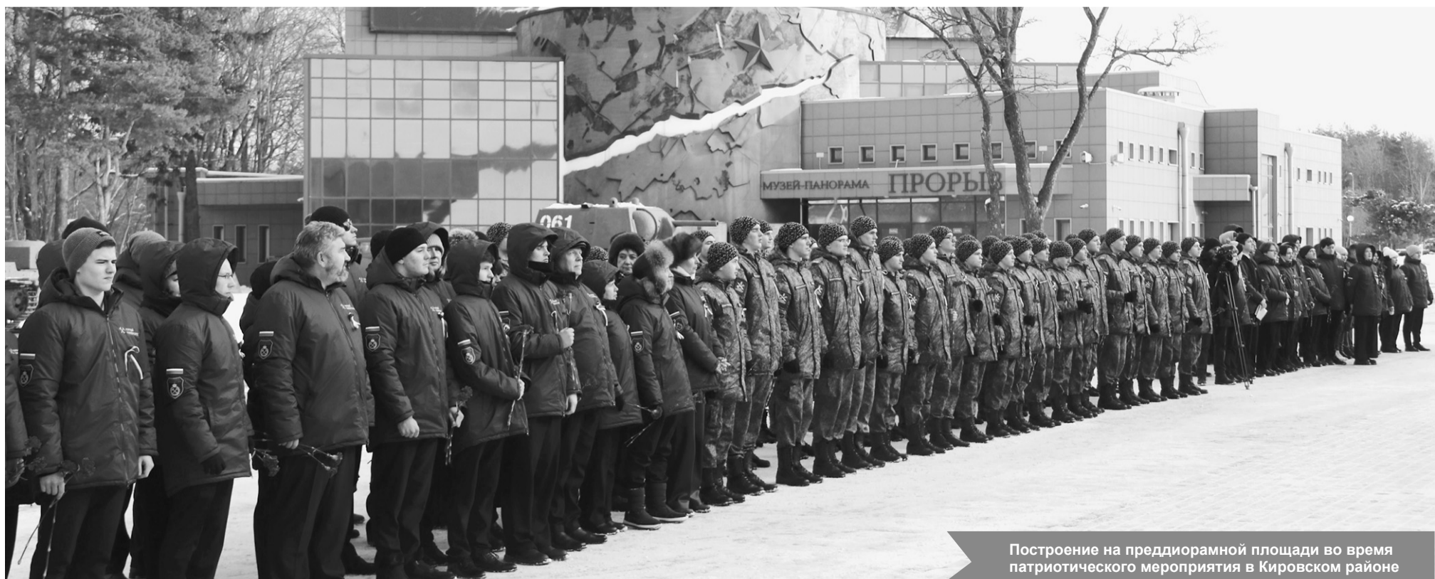
Построение на преддворной площади во время патриотического мероприятия в Кировском районе

С поздравлениями и тёплыми пожеланиями скорейшего выздоровления к героям обратились начальник управле-