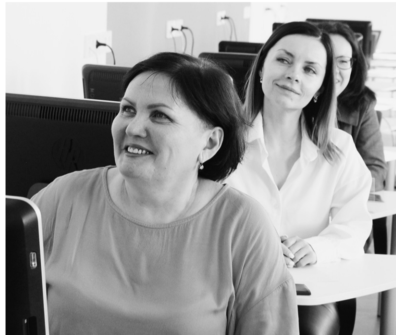
Родители – участники акции «Сдаём вместе. День сдачи ЕГЭ родителями»