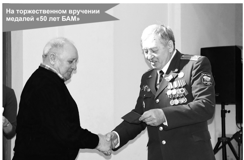
На торжественном вручении медалей «50 лет БАМ»