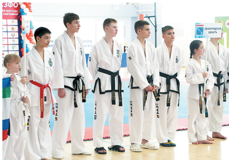
Сборная Ленобласти по тхэквондо ИТФ

В минувшие выходные тхэквондисты Кировского района отправились покорять окружные соревнования по тхэквондо ИТФ и фестиваль среди цветных поясов в рамках турнира. Состязания проходили с 14 по 16 февраля в городе Сыктывкаре (Республики Коми). В соревнованиях приняли участие спортсмены из пяти регионов.