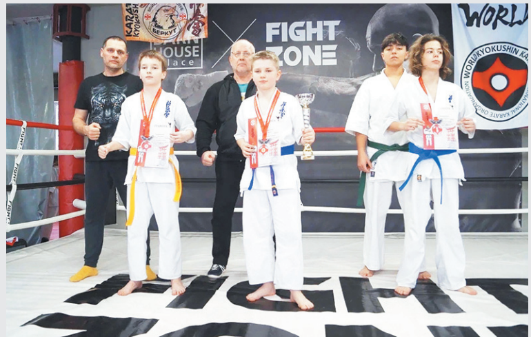
На пьедестале почёта – сильнейшие каратисты