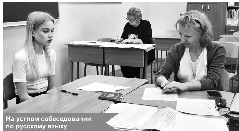
На устном собеседовании по русскому языку

Итоговое собеседование – важный этап в подготовке к государственной итоговой аттестации. Оно позволяет оценить не только знание грамматических норм и лексического запаса, но и коммуникативные навыки, умение формулировать свои мысли чётко и последовательно, вести