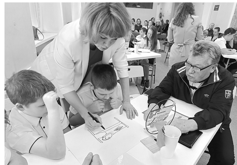
● Тематический квиз в честь праздника 23 февраля в РЦДО

В качестве творческого подарка обучающиеся РЦДО г. Кировска подготовили для гостей праздничный концерт. С импровизированной сцены перед зрителями выступили хореогра-