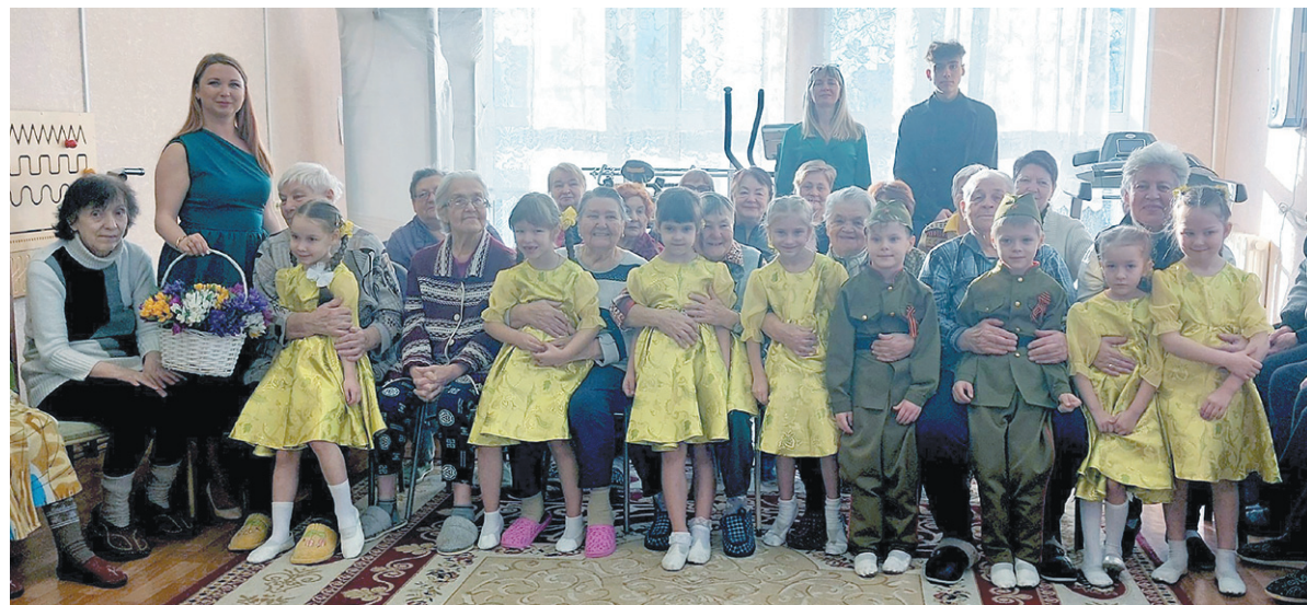
Дошколята поздравляют старших товарищей с предстоящими праздниками

19 февраля получатели услуг Кировского центра социального обслуживания населения посетили с творческим подарком юные артисты. Визит воспитанников и педагогов детского сада № 2 «Солнышко» г. Кировска, посвящённый Дню защитника Отечества, организован в рамках проекта «Дари Добро».