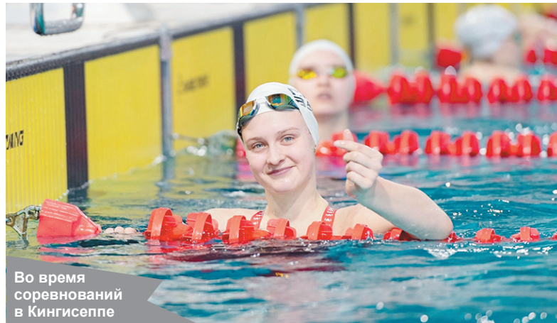
Во время соревнований в Кингисеппе