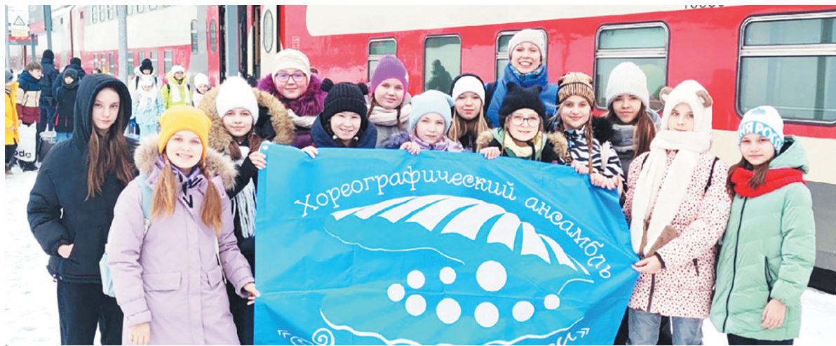
Хореографический ансамбль «Жемчужинки» РЦДО г. Кировска