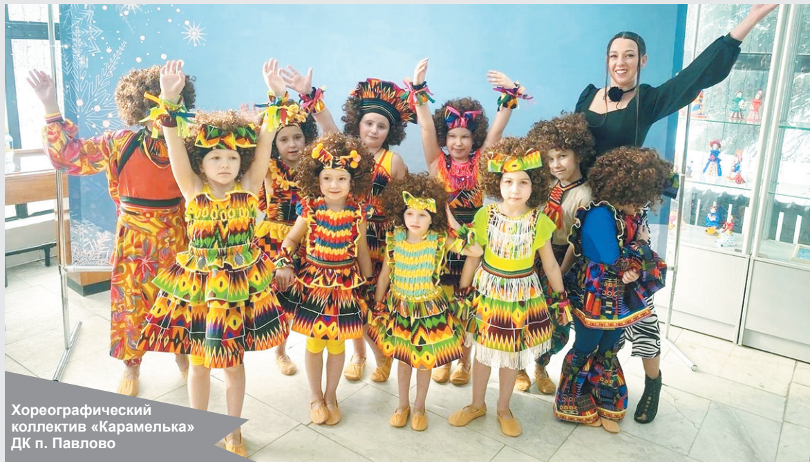
Хореографический коллектив «Карамелька» ДК п. Павлово

Фото хореографического коллектива «Карамельки»