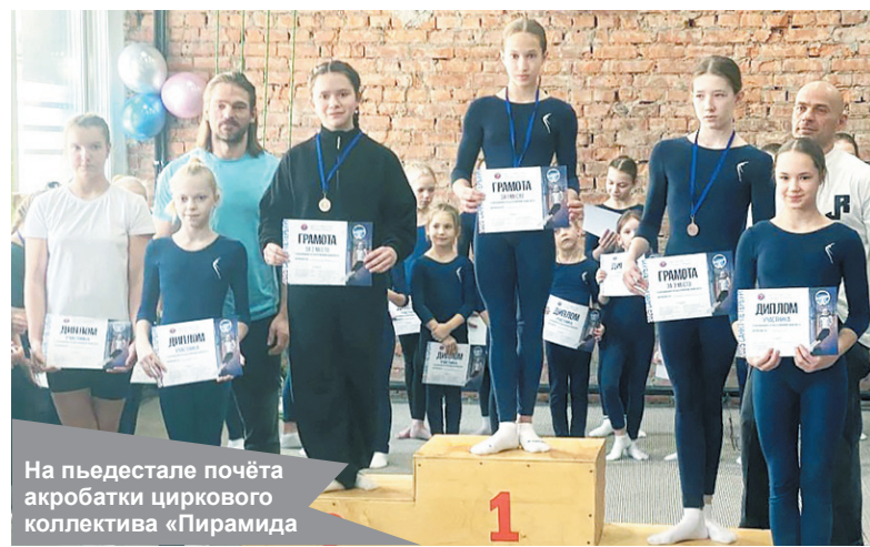
На пьедестале почёта акробатки циркового коллектива «Пирамида»