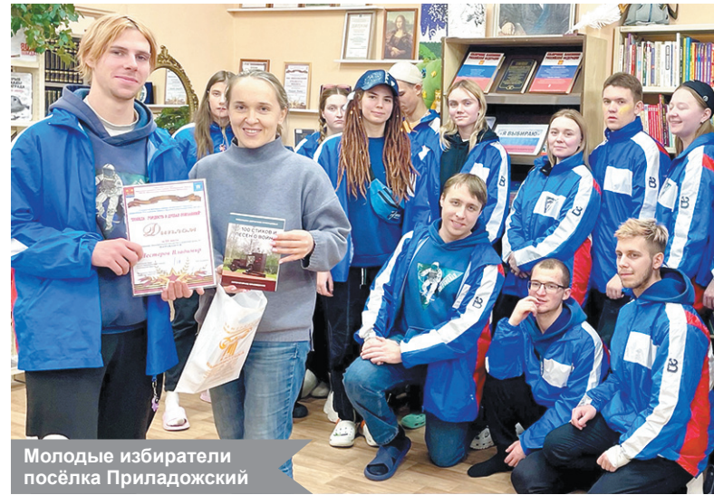
Молодые избиратели посёлка Приладожский