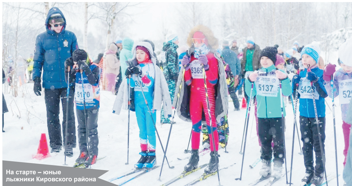
На старте – юные лыжники Кировского района