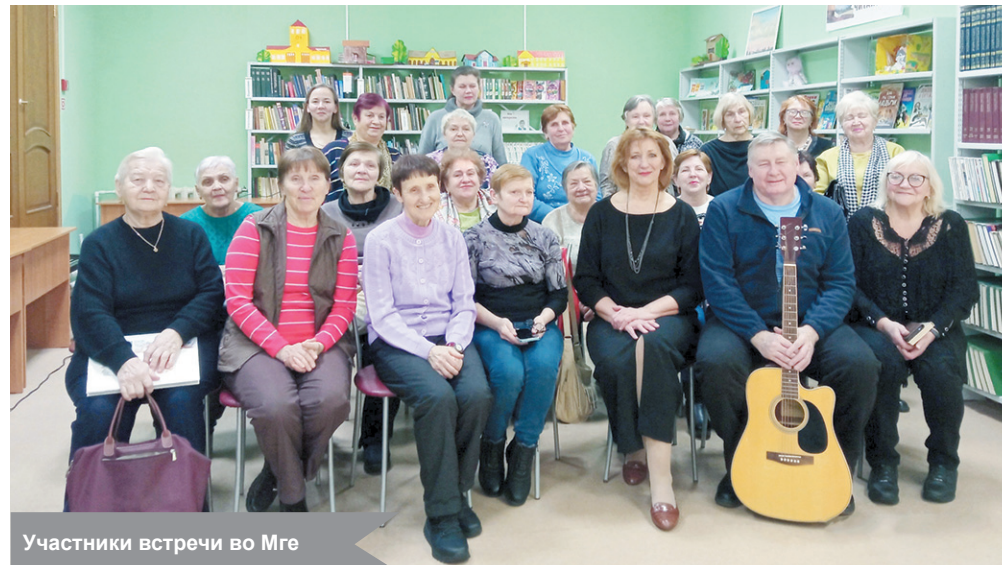
Участники встречи во Мге