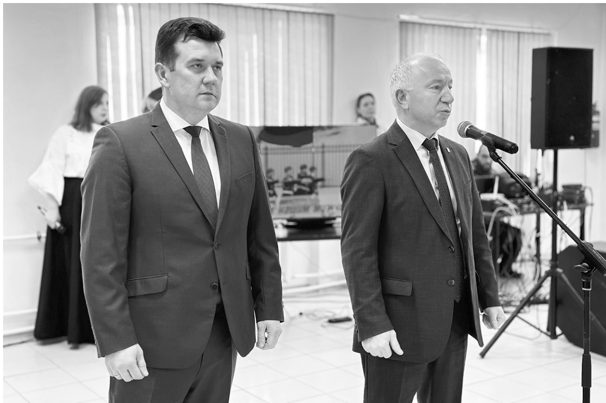
● Руководители района на праздничном мероприятии в Отрадном

В преддверии Дня защитника Отечества в Кировском районе состоялся торжественный приём, собравший людей, которые защищают нашу Родину в различных сферах. Здесь были те, кто обеспечивает порядок и безопасность, заботится о здоровье граждан и следит за соблюдением прав и свобод. В это непростое время особое внимание уделяется ветеранам боевых действий и участникам СВО, которые являются настоящими героями нашего времени.