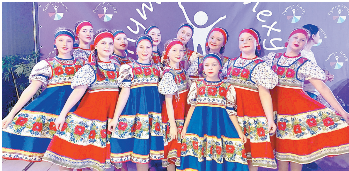
Хореографический коллектив «Улыбка» РЦДО г. Кировска