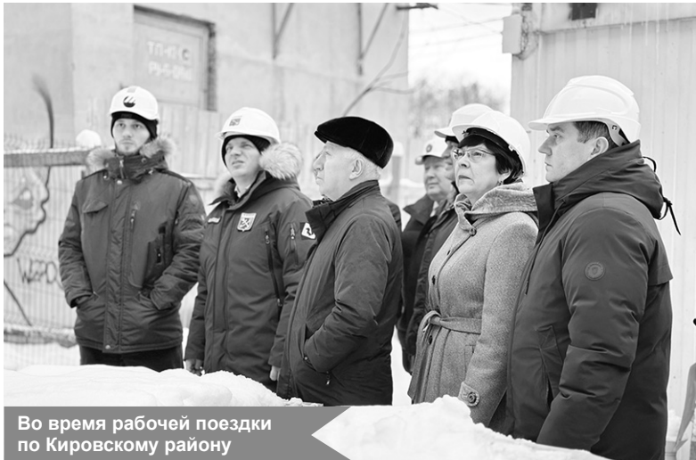
Во время рабочей поездки по Кировскому району

– Работы начались в сложный для отрасли период, но подрядчик выправился, прогресс видно: на площадку приходят новые материалы, а монтируют инженерию и ведут кладку стен десятки человек. Договорились, что к весне запустят работы по благоустройству и отделке помещений. Это один из немногих проектов, объединяющих школу с детским садом, но именно такие решения позволяют строить капитальные здания, где возможно реа-