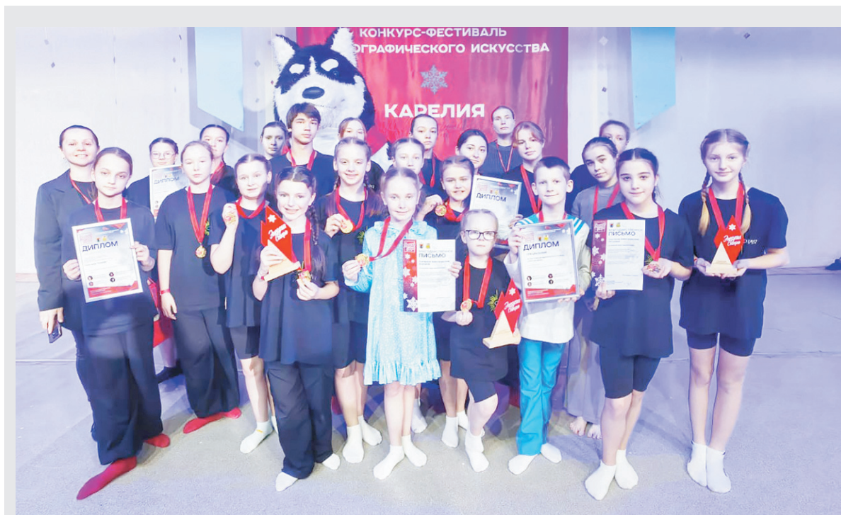
Театр танца «Олимпия» ДК с. Путилово