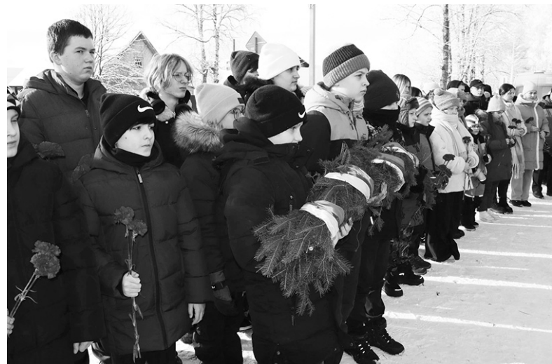
● На возложении на кладбище во Мге